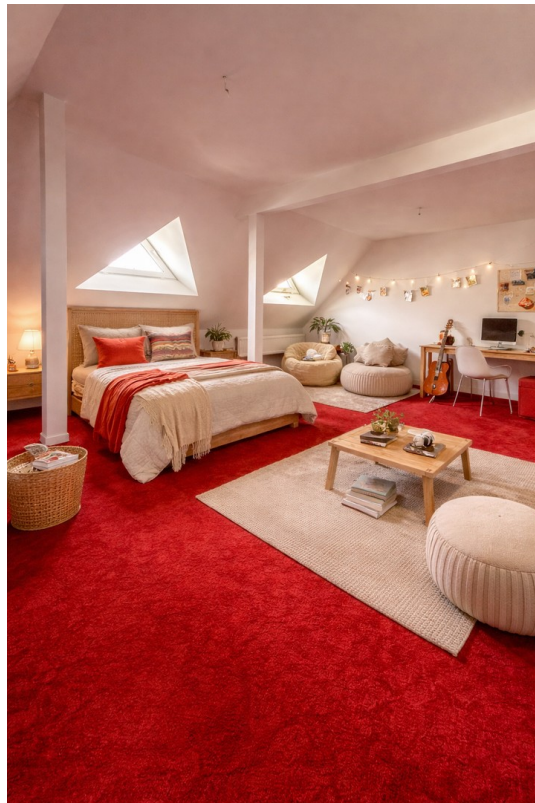
Zusätzliches Zimmer (Optional)