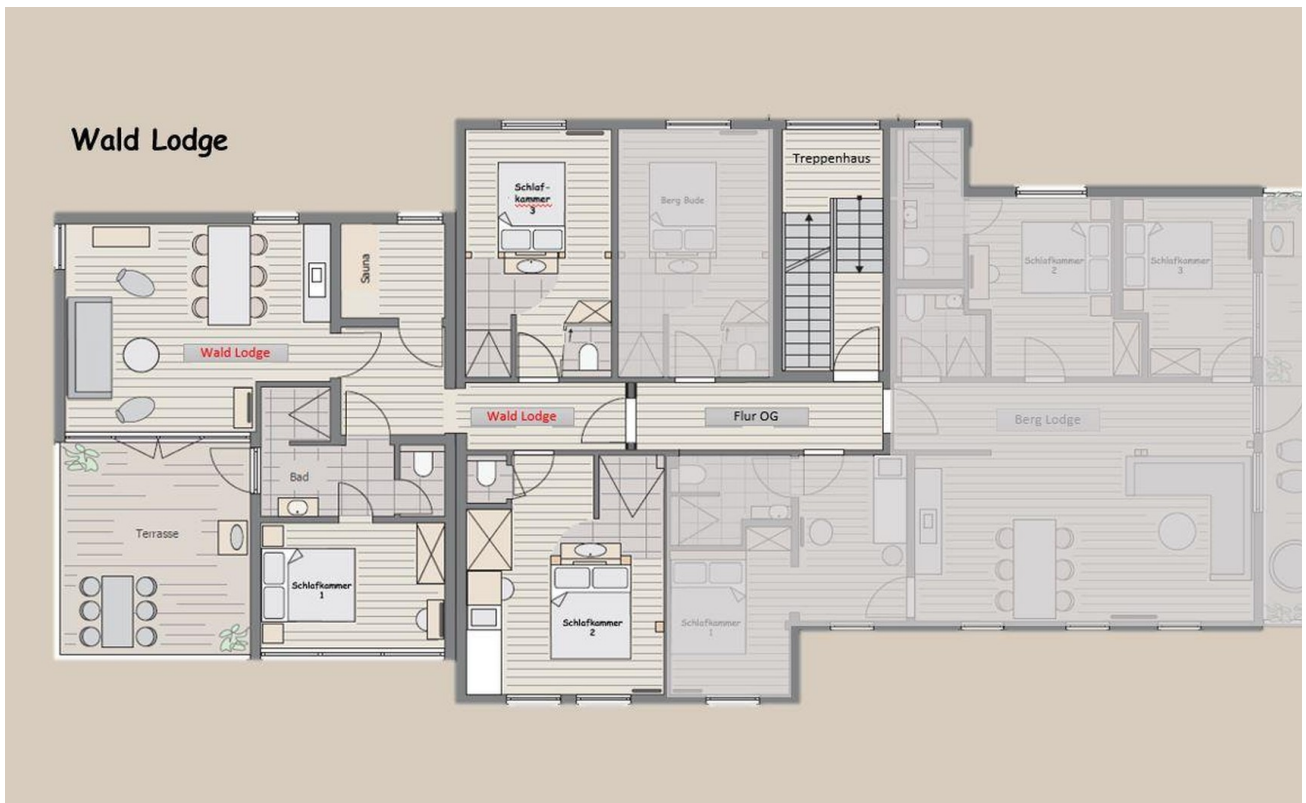
Grundriss WL 1.OG