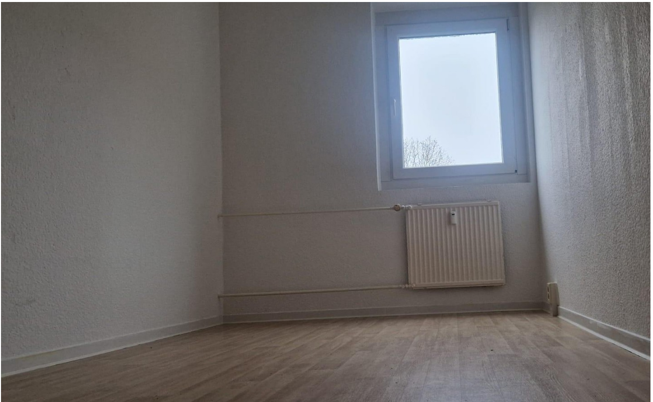
Kinder- oder Arbeitszimmer