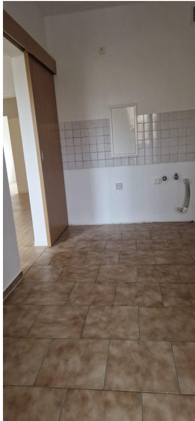
Platz in der Küche mit Balkon