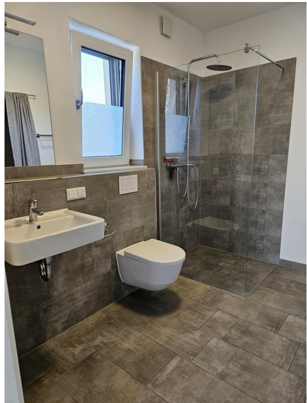
Badezimmer mit Regendusche