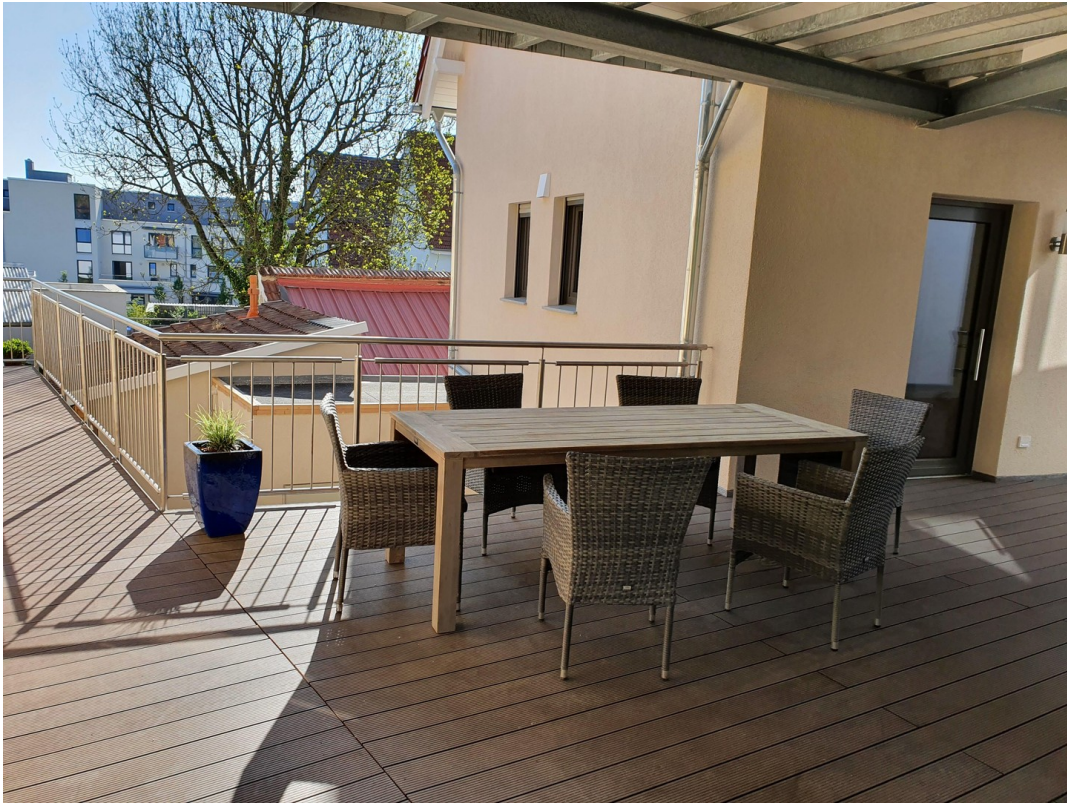
Gemeinschaftsterrasse im 1. OG