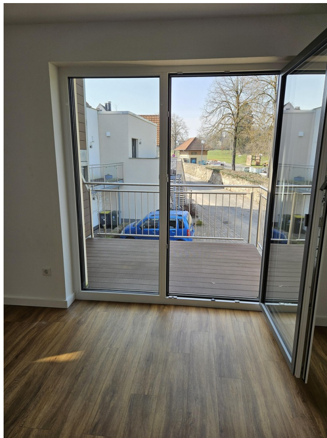
Balkon mit Abendsonne