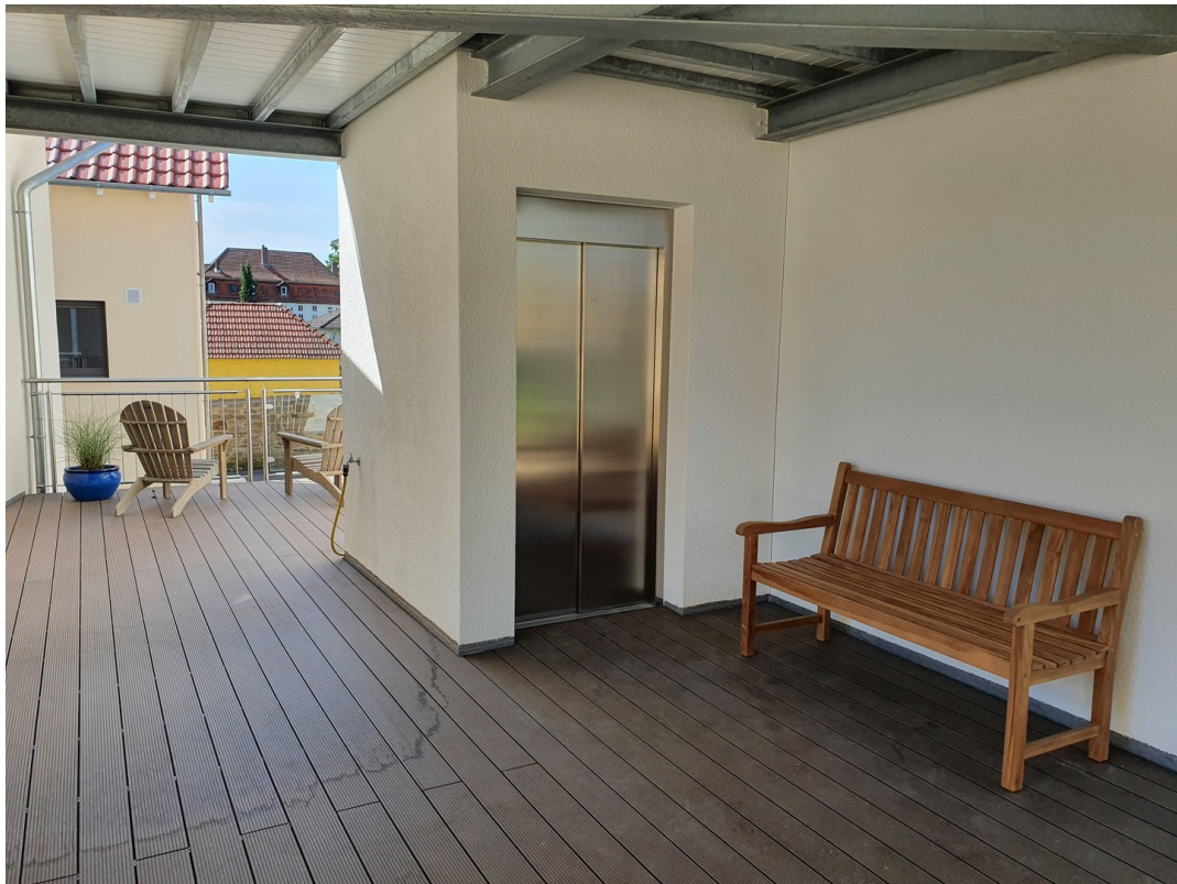
Gemeinschaftsterrasse im 1. OG