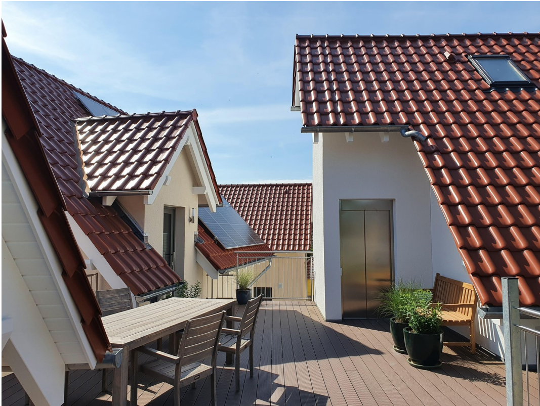
Gemeinschaftsterrasse im 2. OG