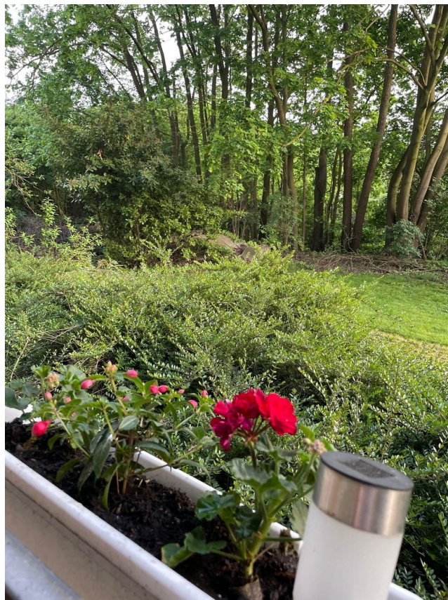
Blick auf Grün