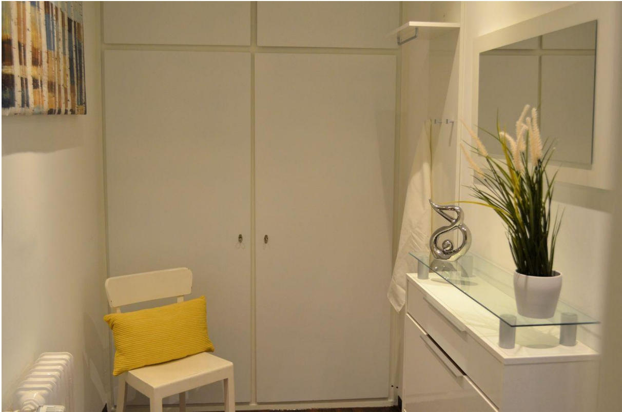
Schrank im Flur