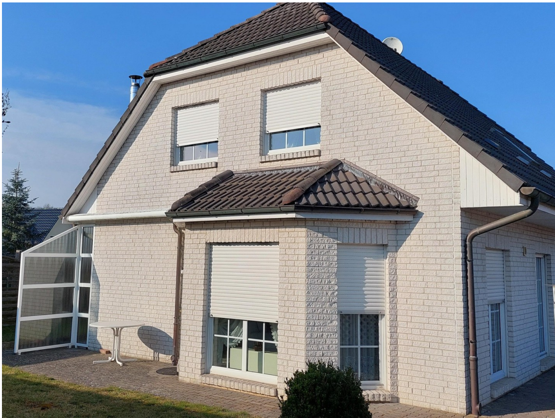
Südansicht mit Terrasse