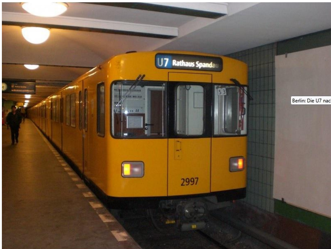
Berlin: Die U7 nach