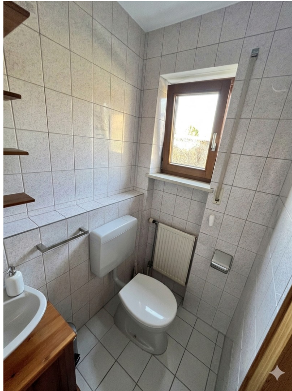
Gäste WC im EG