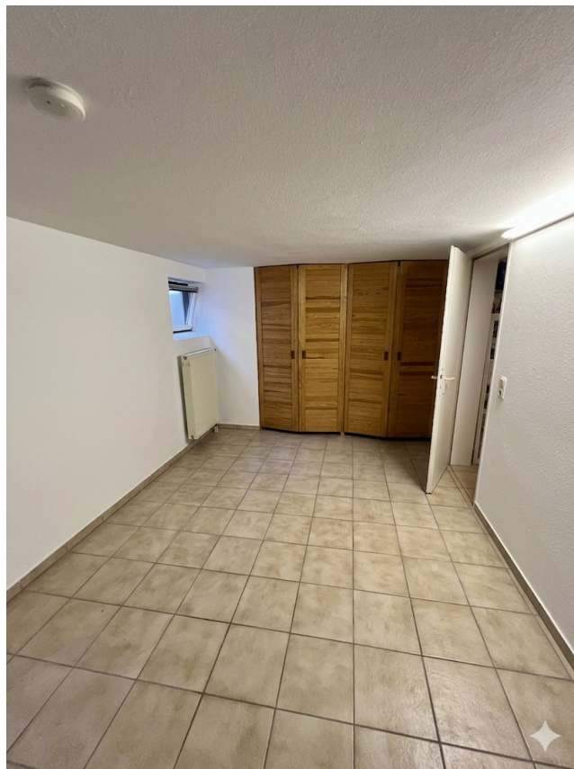
Hobbyraum im Keller