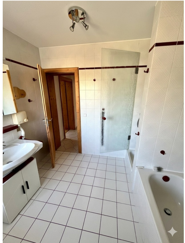
Bad mit Dusche & Badewanne