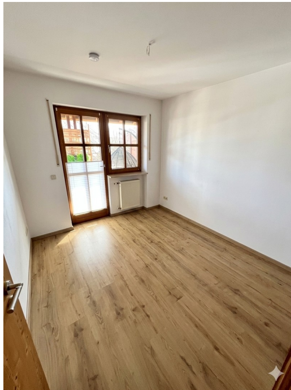
Kinderzimmer 1 im OG