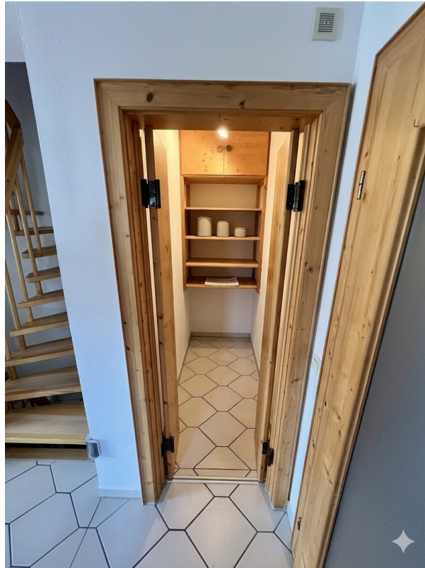
Speisekammer im EG