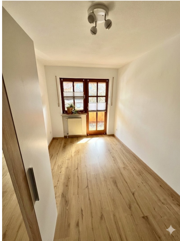
Kinderzimmer 2 im OG