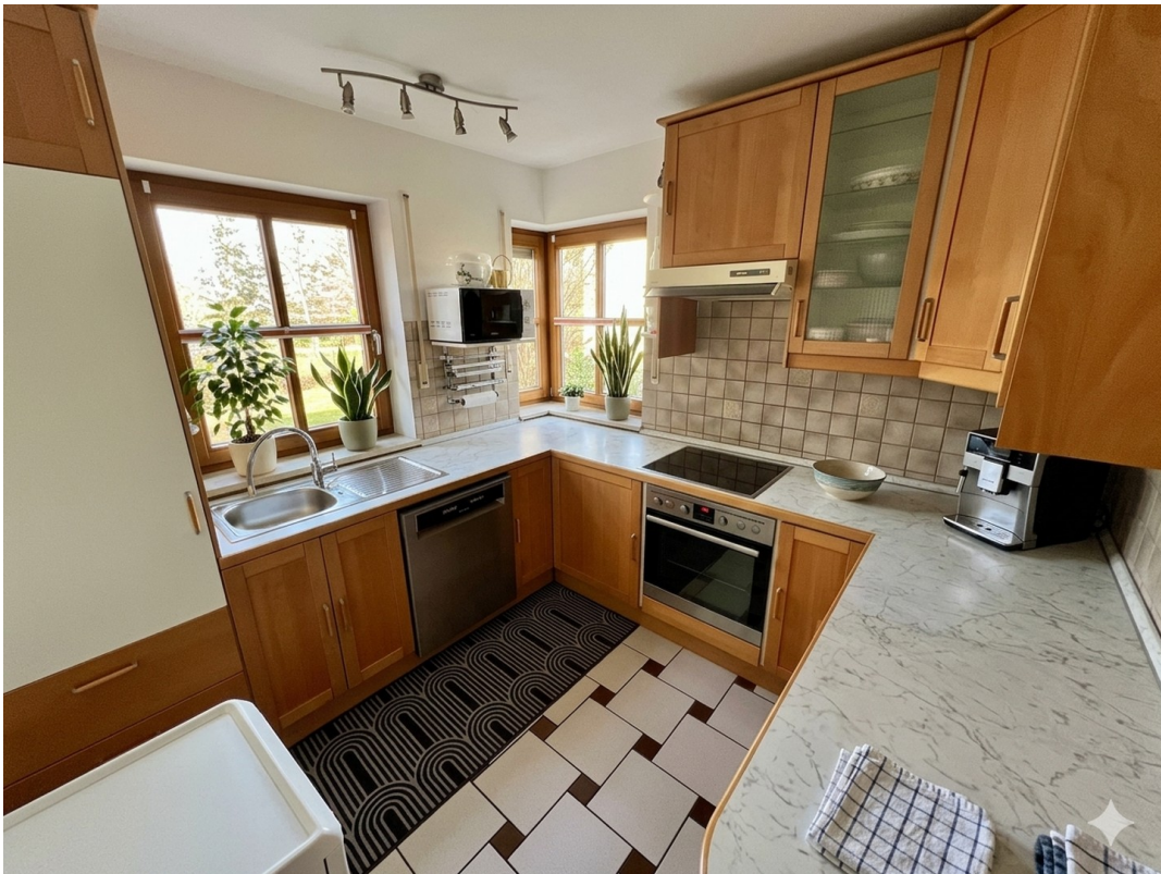
Küche mit Blick in den Garten