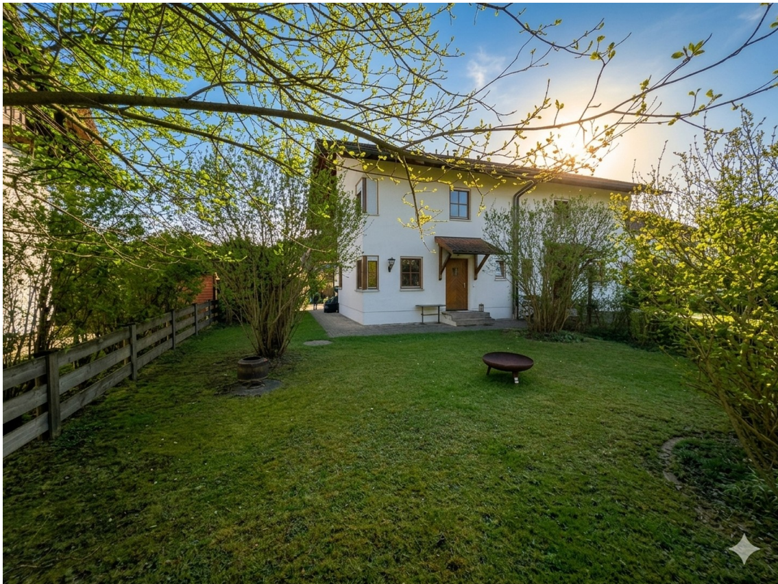
Ansicht aus dem Garten