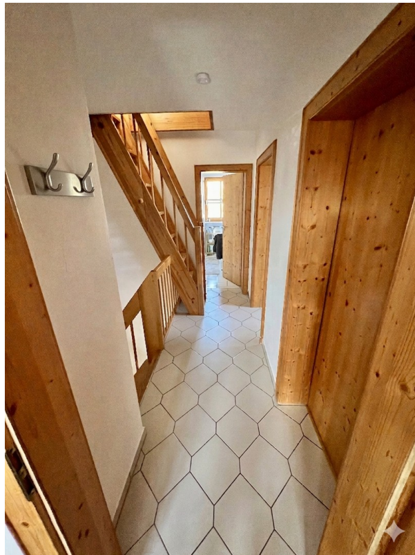
Flur im OG