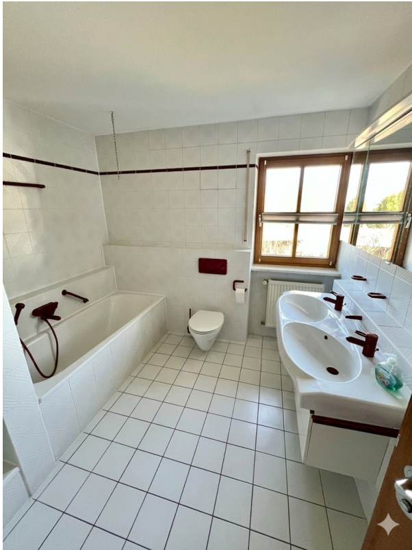
Bad im OG