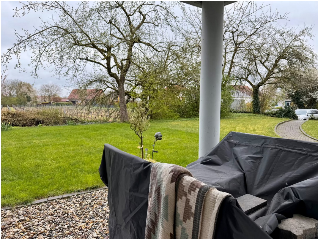
Blick von der Hauptterrasse