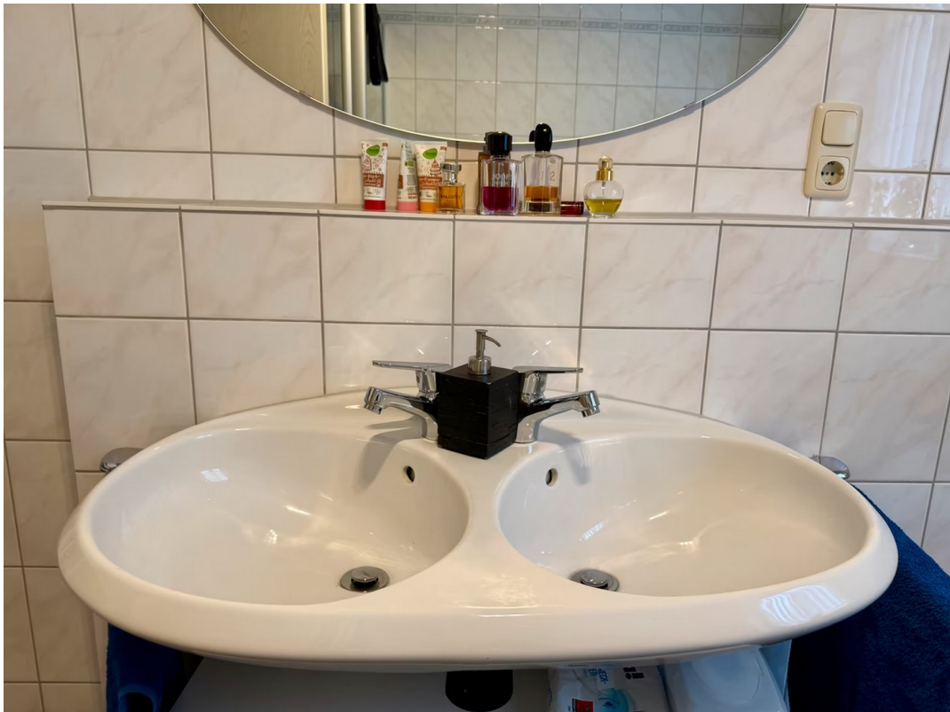
Badezimmer mit Doppelwaschbeck