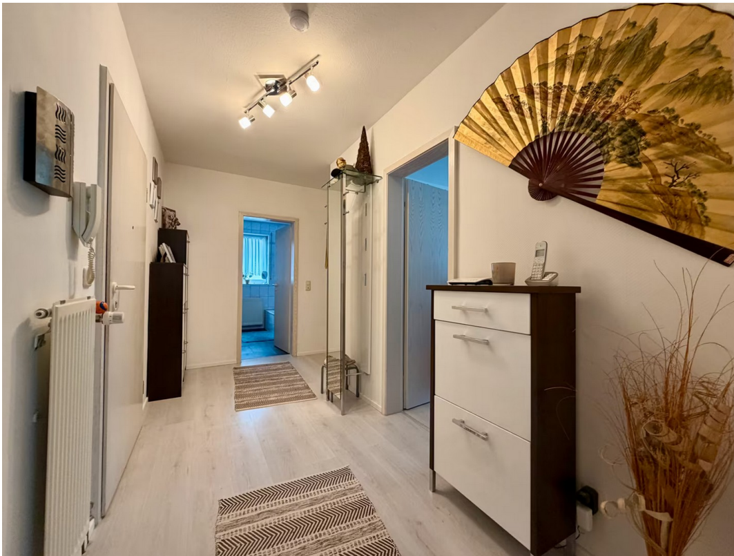
Flur / Diele