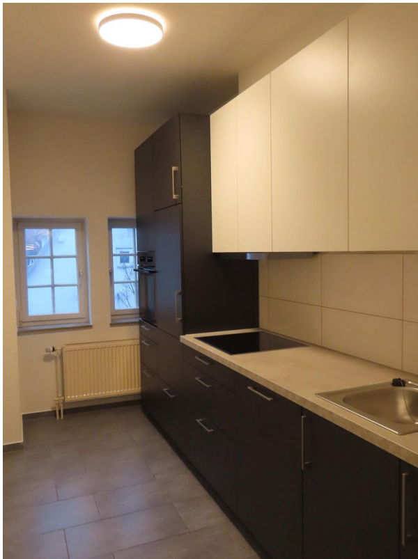
Küche mit neuer EBK