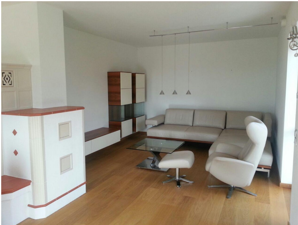
Wohnzimmer mit Kachelofen