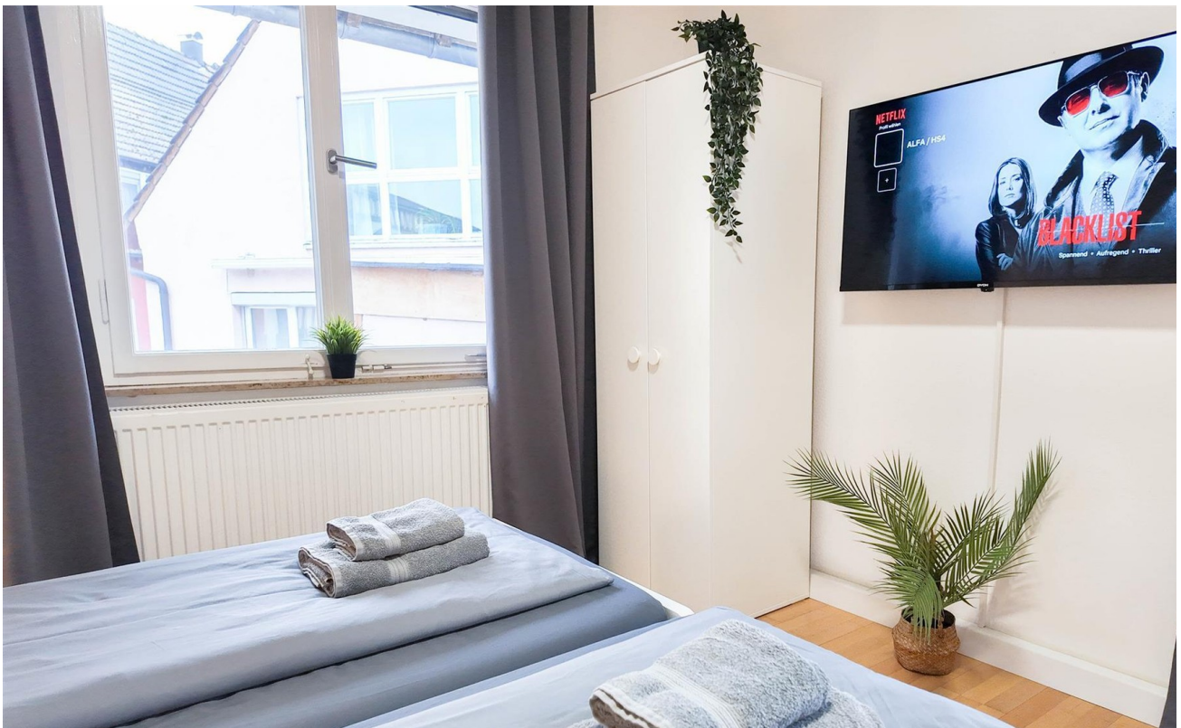
Zimmer 2 / Helles und Modern