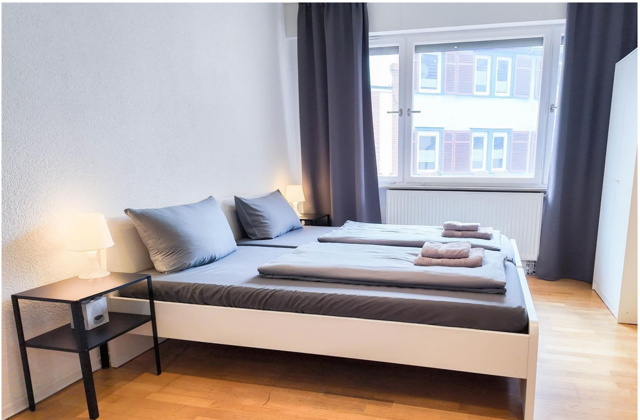
Zimmer 1 / Großzügiges Zimmer