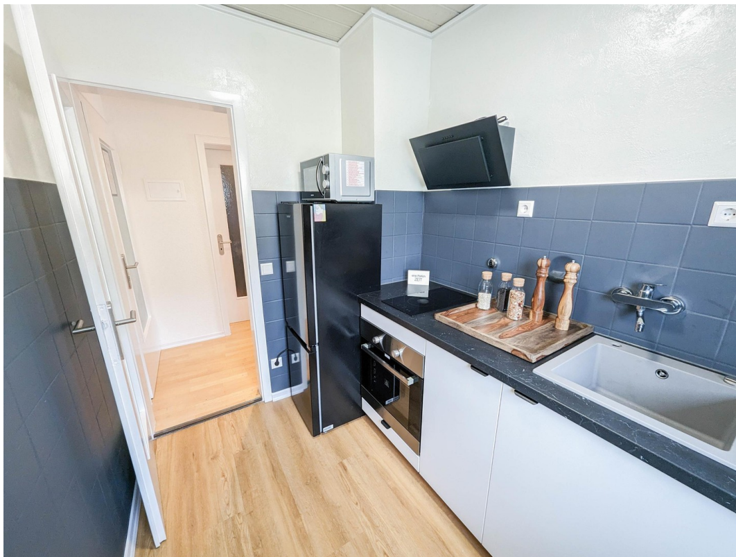
Neue moderne Einbauküche