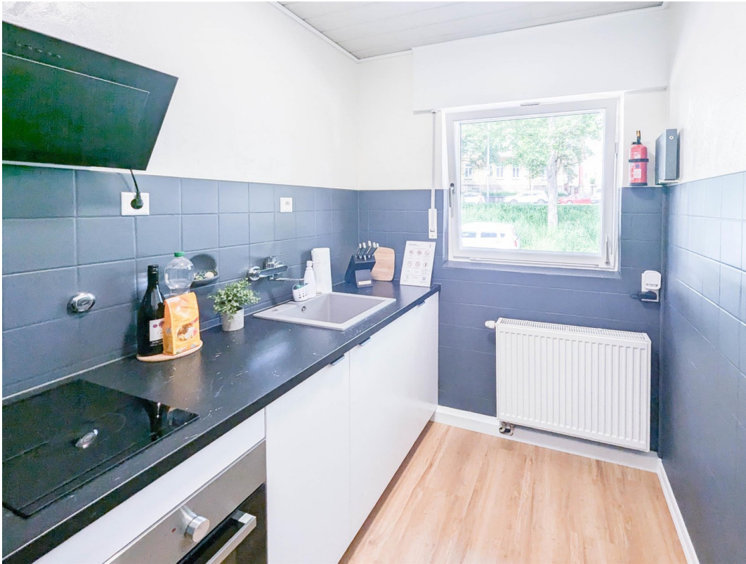
Einbauküche / Neueinbau