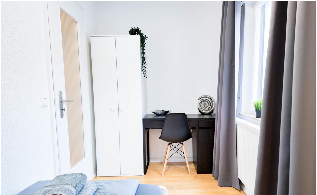
Zimmer 3 / Arbeitsbereich