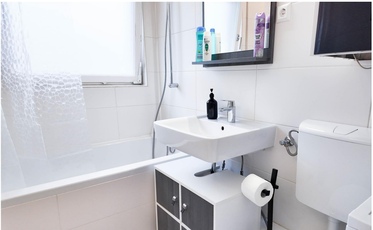
Badezimmer / Hell & Modern