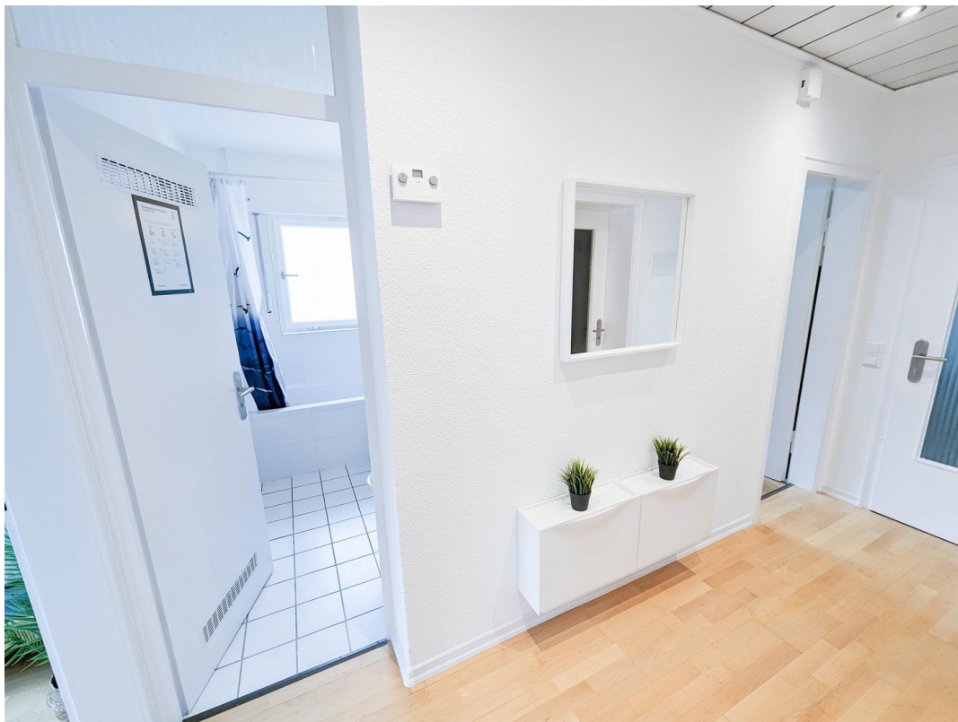
Flur / Fertig eingerichtet