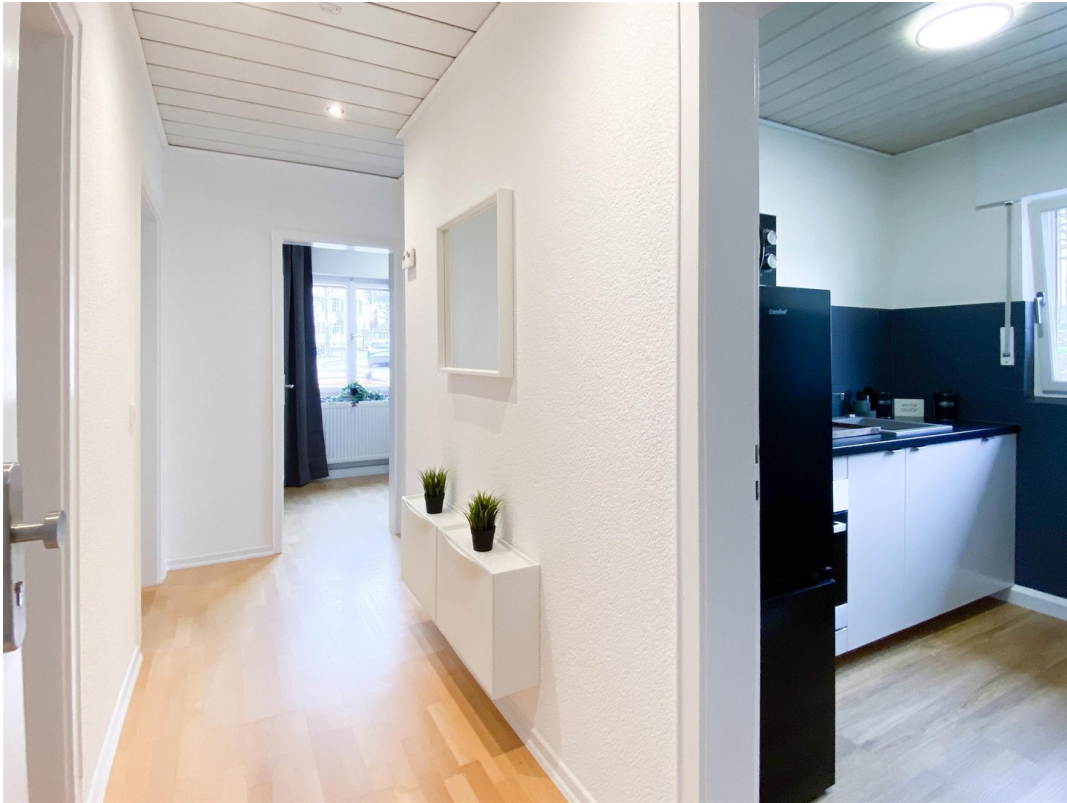
Eingang / Top Grundriss