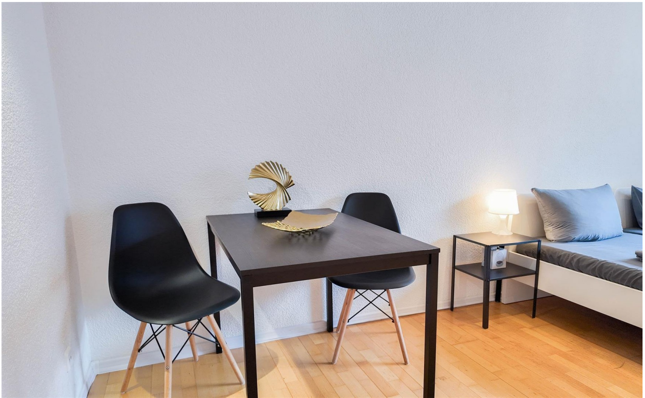
Zimmer 1 / Essbereich