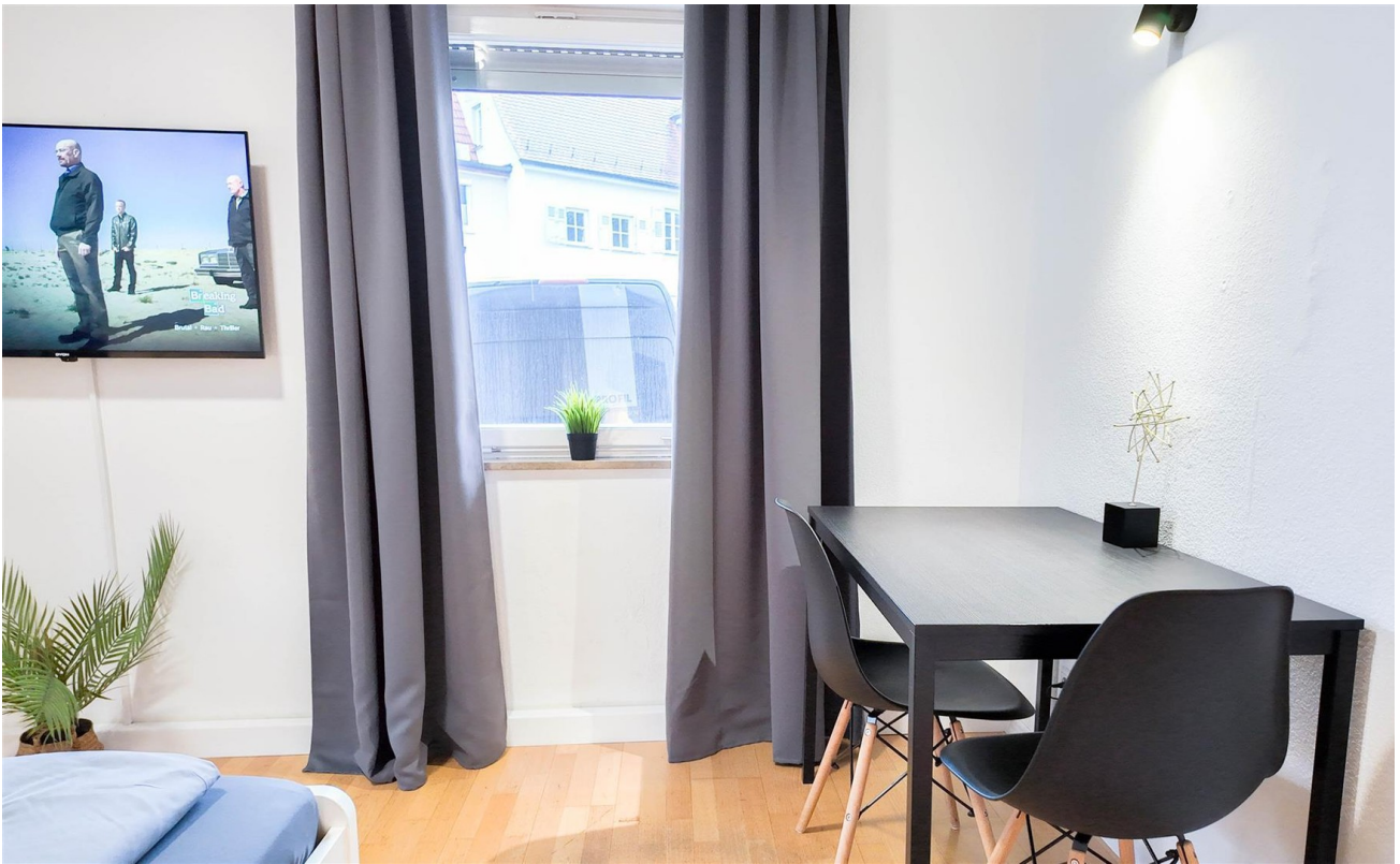
Zimmer 2 / Essbereich