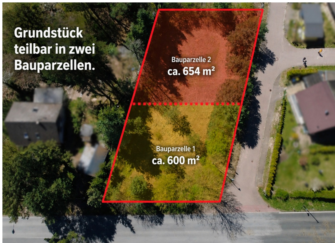
voll erschlossen - teilbar