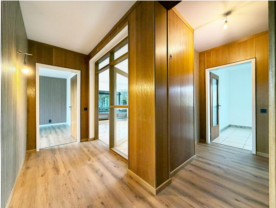
Flur - Eingangsbereich