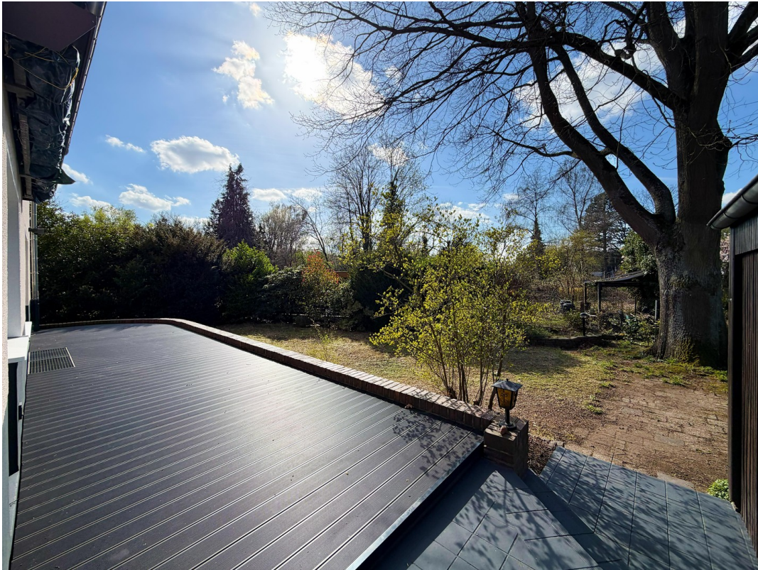
Terrasse + Garten