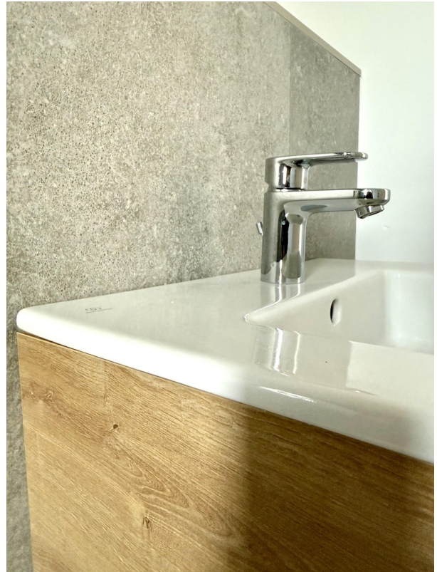
Details im Bad