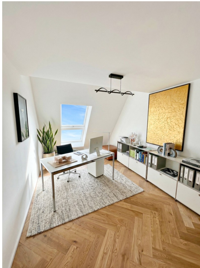
Arbeits- / Gästezimmer