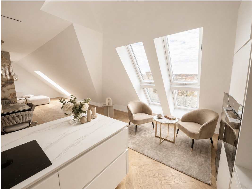
Küche- und Essbereich