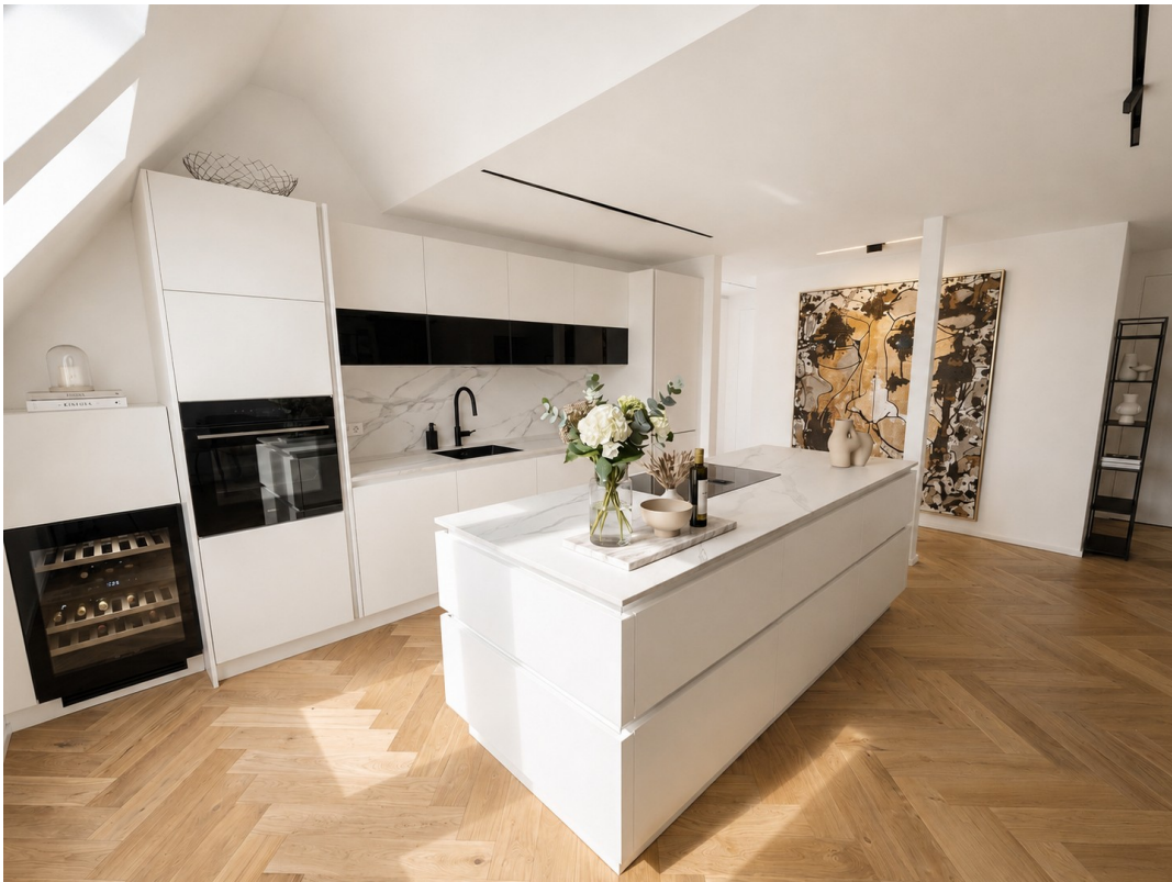
Küche- und Essbereich