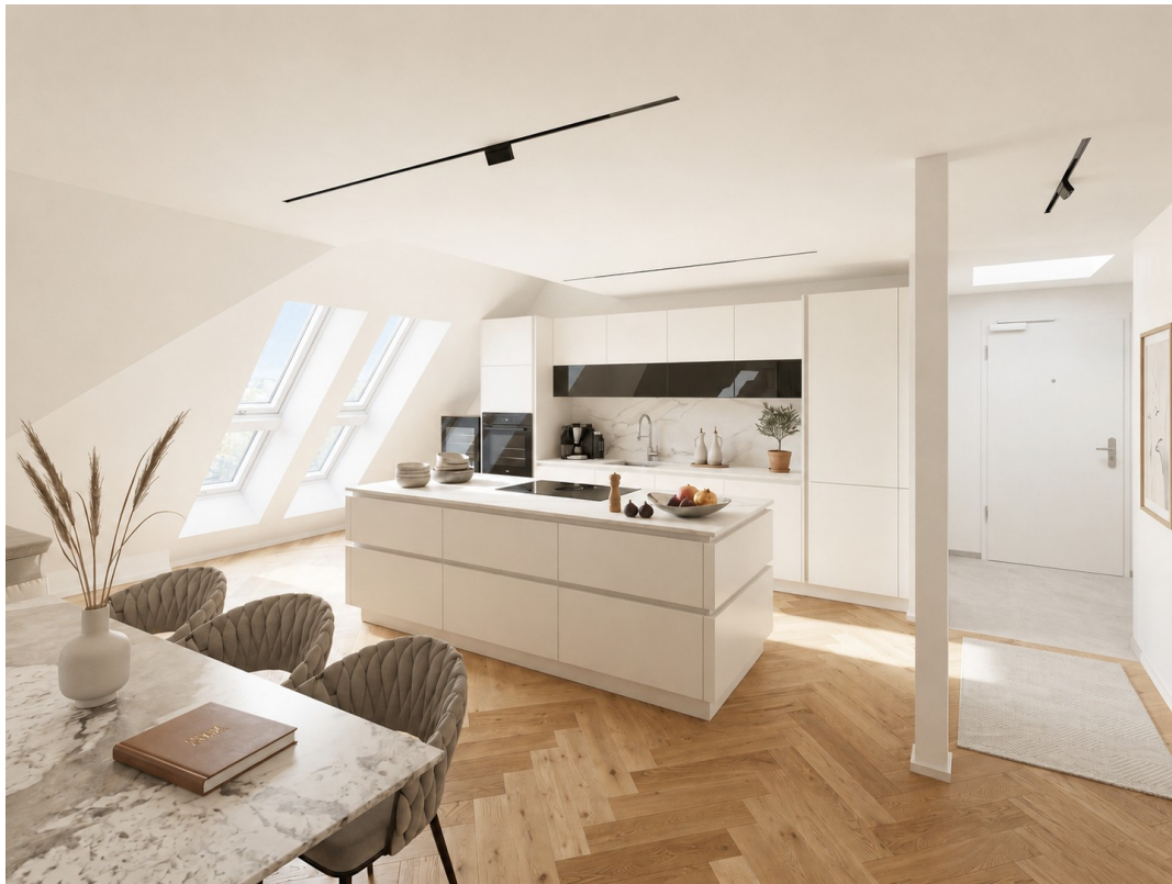
Küche- und Essbereich