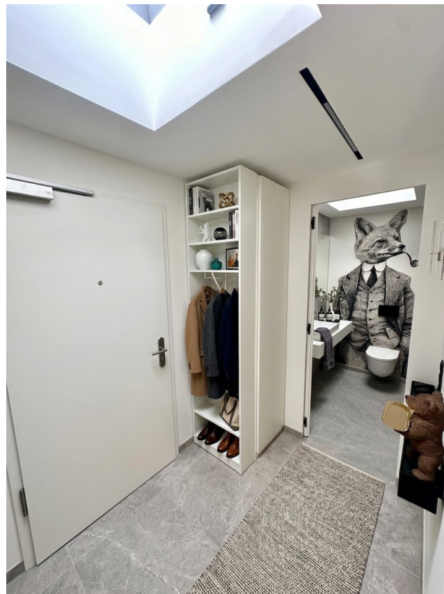
Eingangsbereich / Gäste Bad