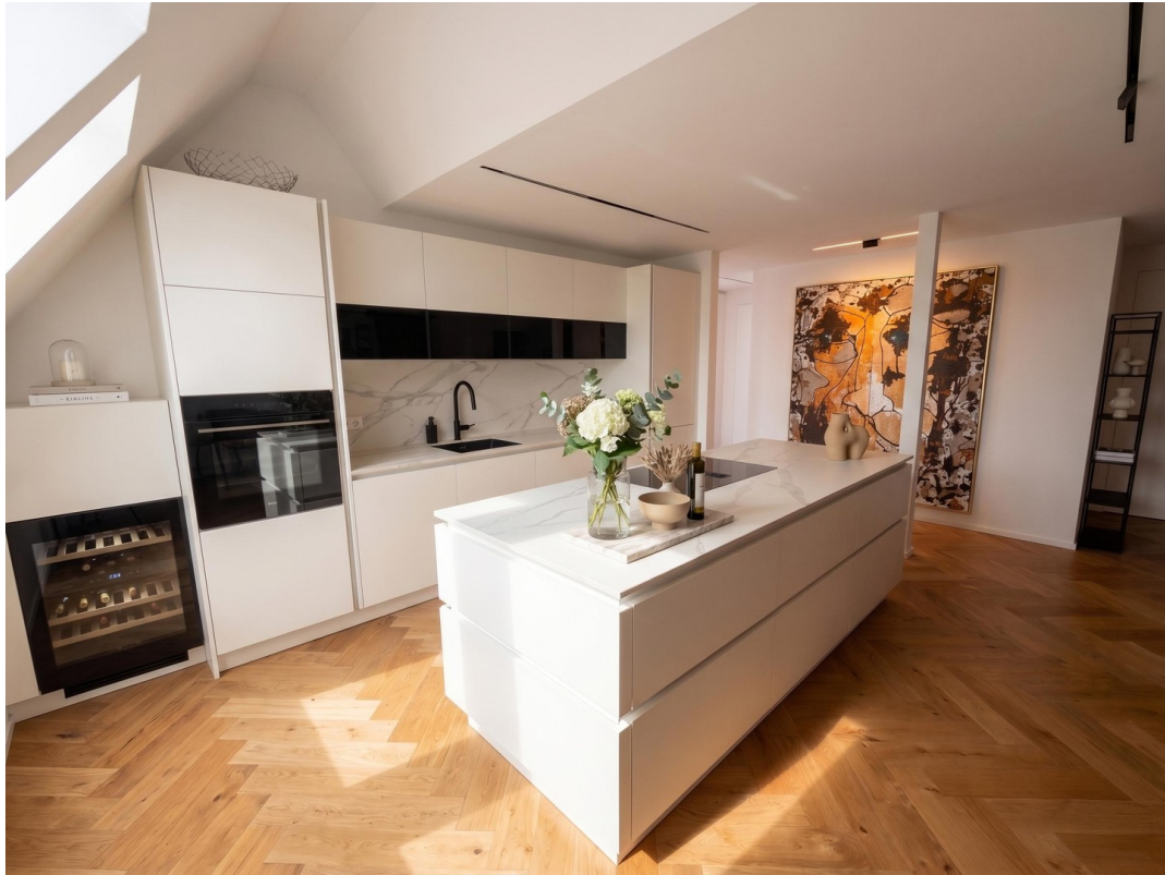
Küche- und Essbereich