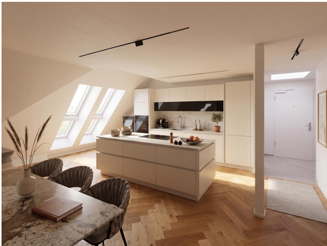
Küche- und Essbereich