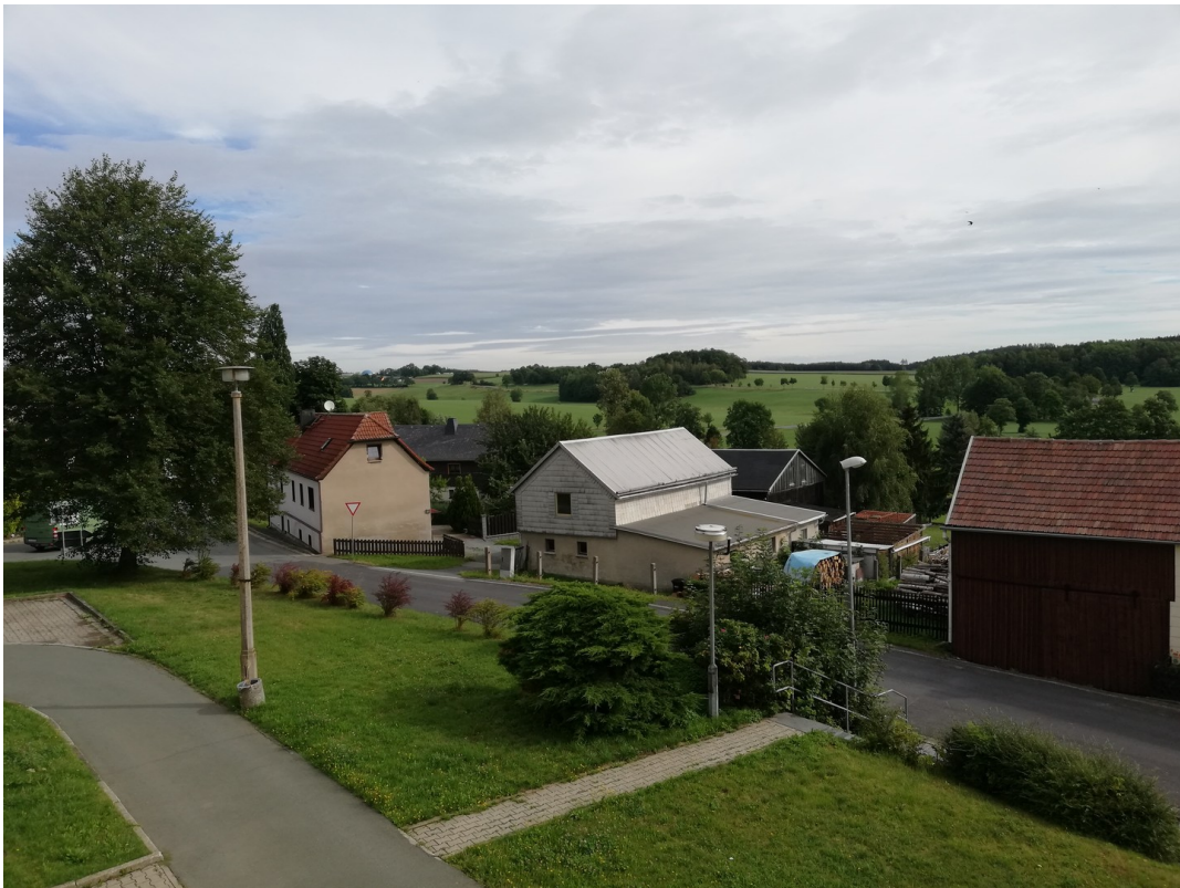
Blick aus dem Fenster