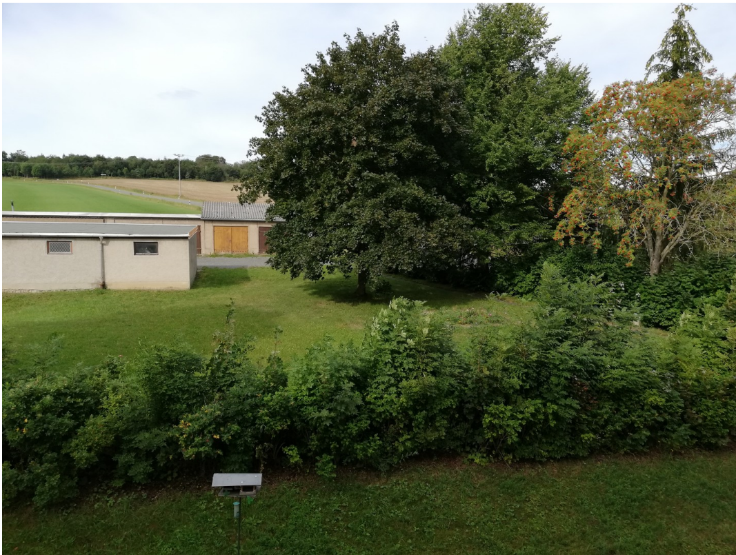
Blick aus dem Fenster