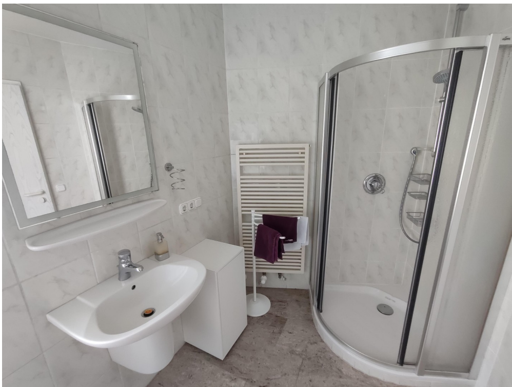
Gästebad mit Dusche