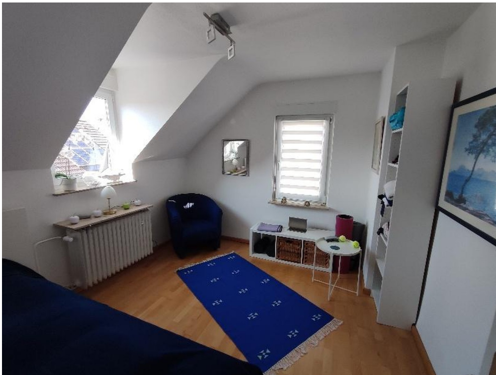
OG Zimmer 1