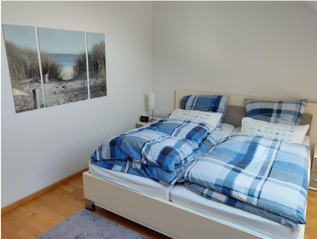
OG Zimmer 2