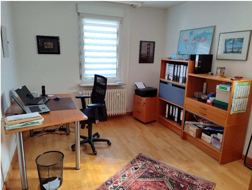
OG Zimmer 3