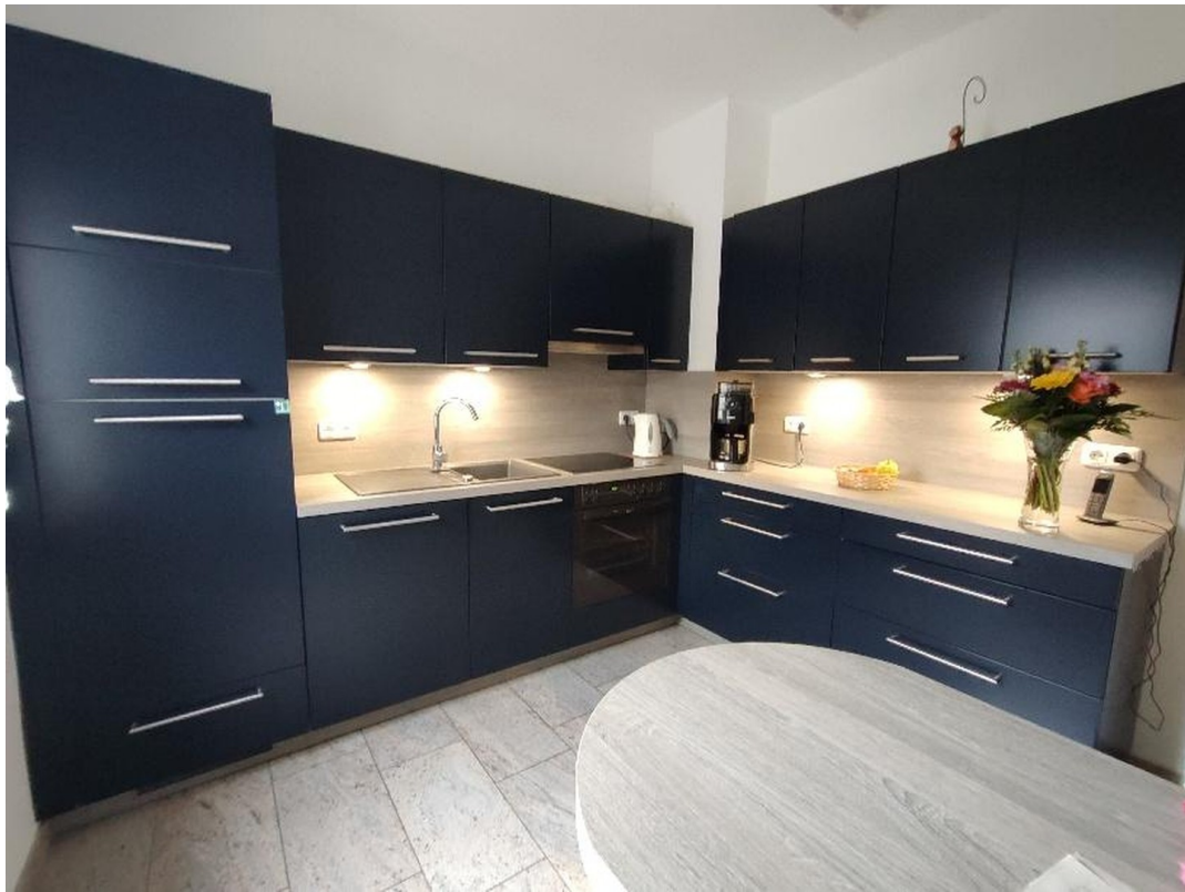
EG Einbauküche komplett