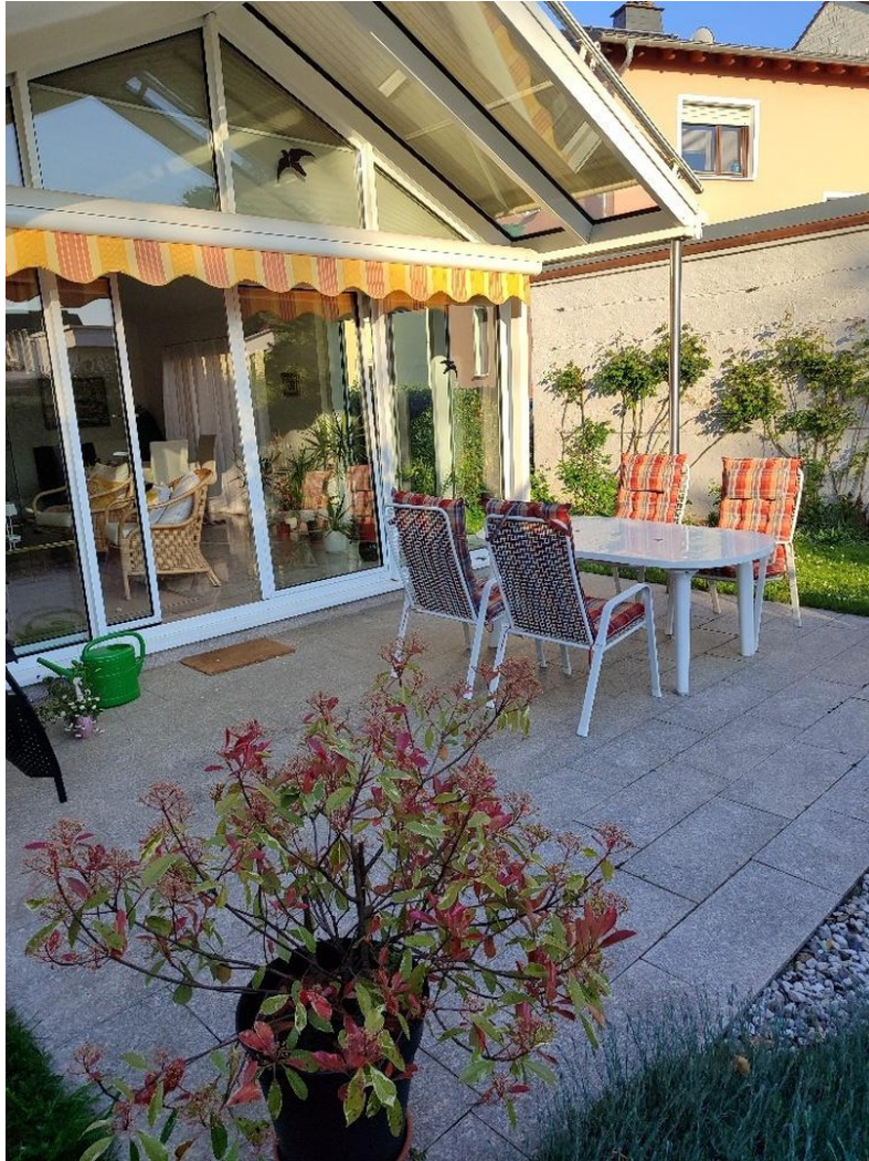
Hier lässt sich's gut leben