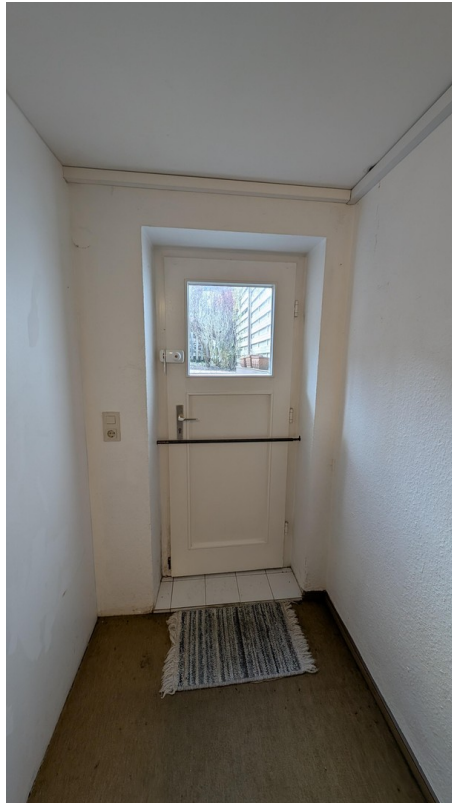
Eigener Zugang vom Garten