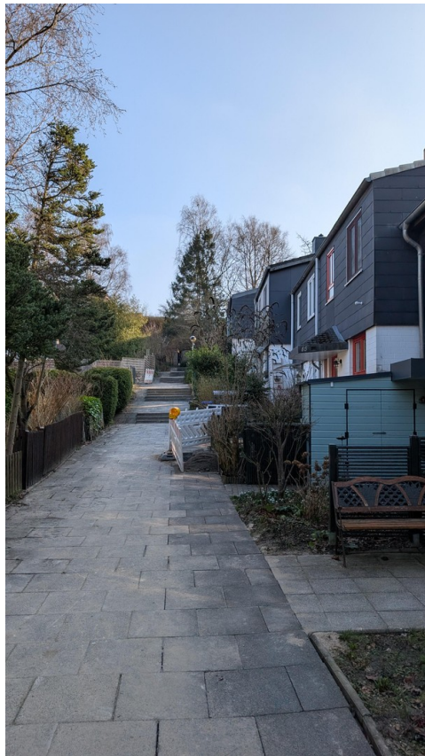
Verbindungsweg zu den Häusern