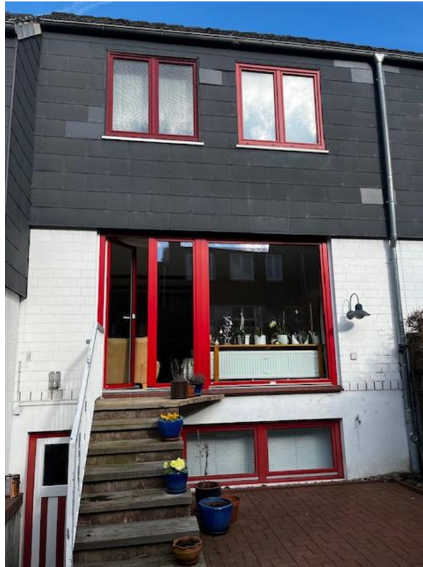
Gartenseite mit Treppenabgang