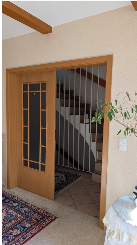
Doppeltür ins Wohnzimmer