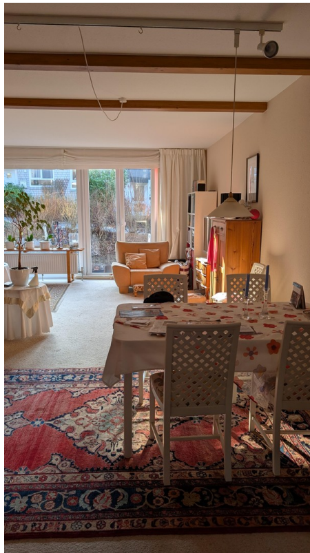
Blick zurück zum Garten