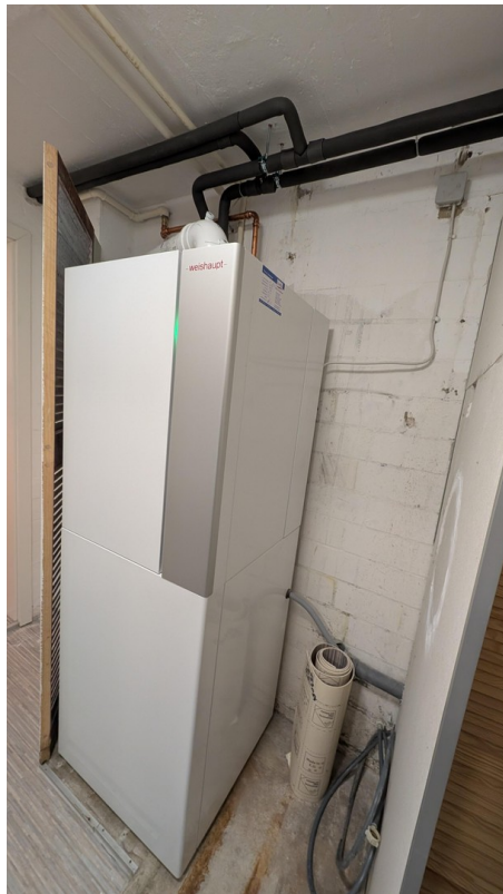
Neue Gasheizung (2025)