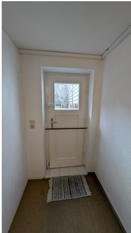
Eigener Zugang vom Garten