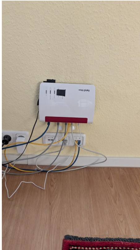
Technik für Büronutzung