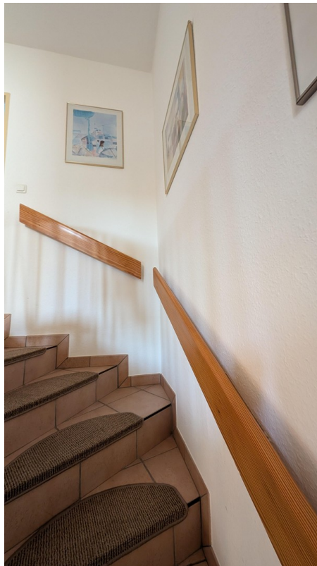
Treppe ins OG