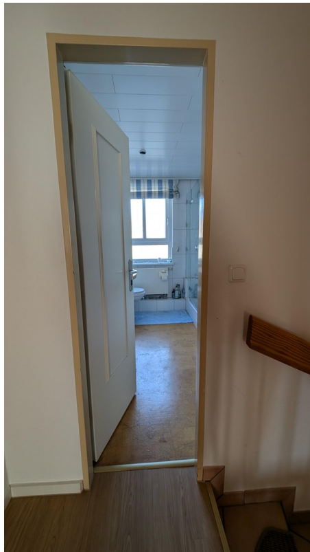
Zugang zum Bad im OG