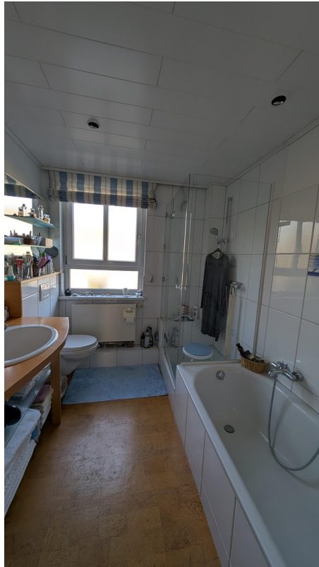
Vollbad mit Wand-WC