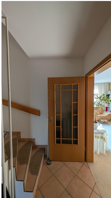
Diele mit Treppe ins OG