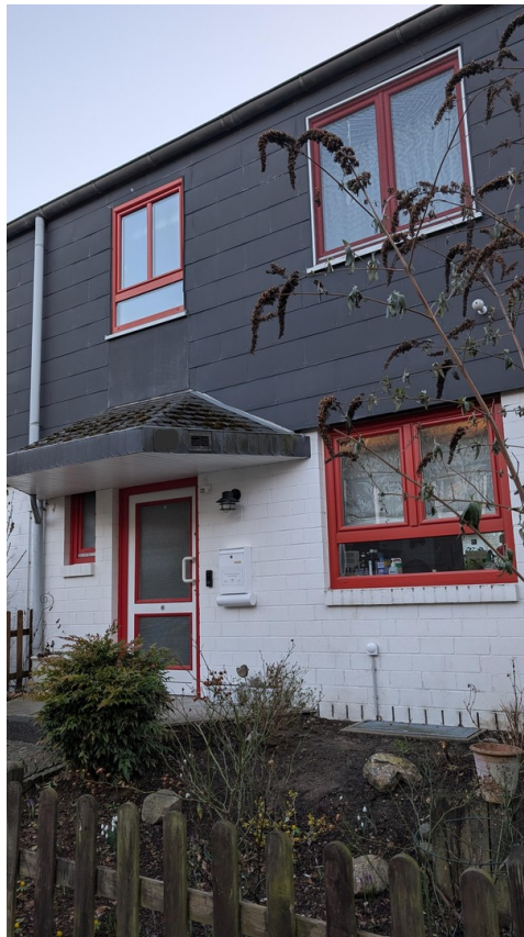
Hausansicht vom Weg