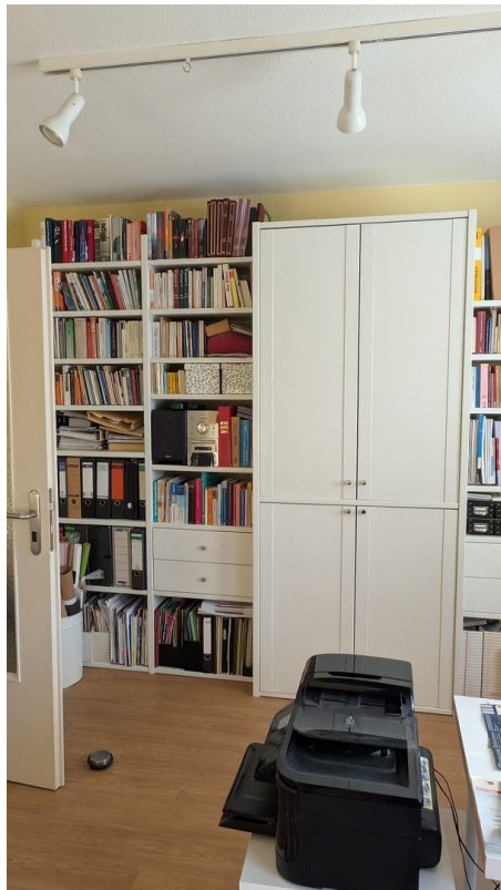
Wandschrank für viele Bücher