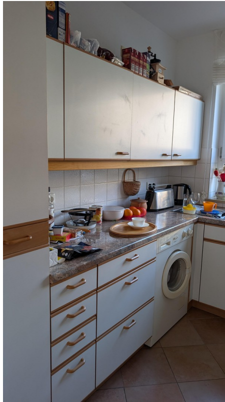
Küchenzeile mit Waschmaschine