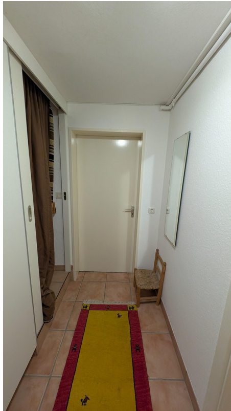
Flur im Keller