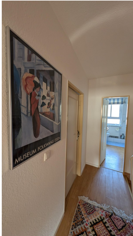
Flur im OG