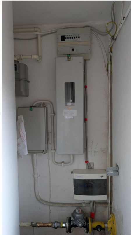
Neue Elektrik mit dig. Zähler