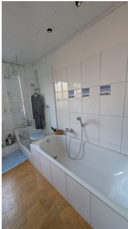
Dusche + extralange Badewanne