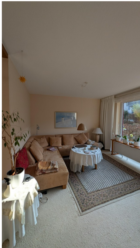
Wohnzimmer mit Blick in Garten