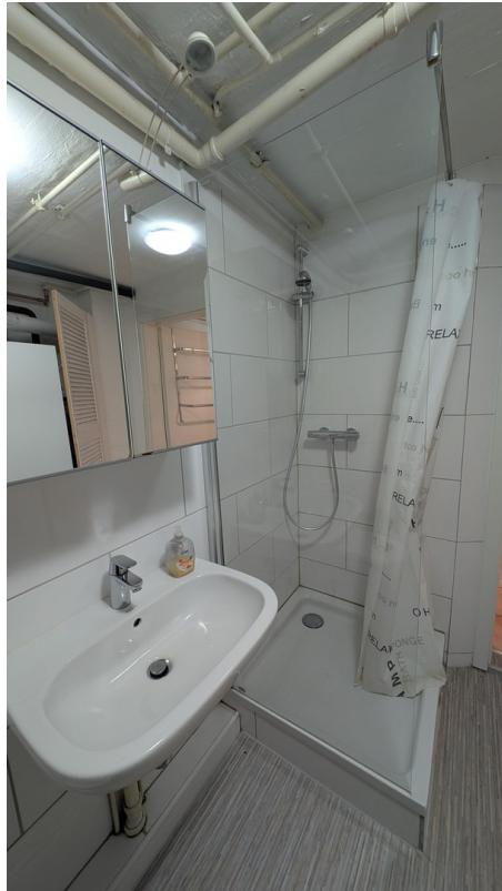
Dusche im separaten Raum