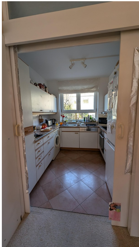
Küche mit Doppeltüren