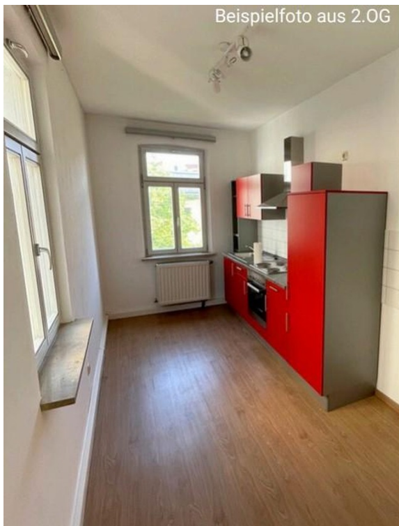
Beispielfoto aus 2.OG