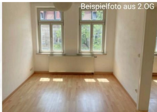
Beispielfoto aus 2.OG