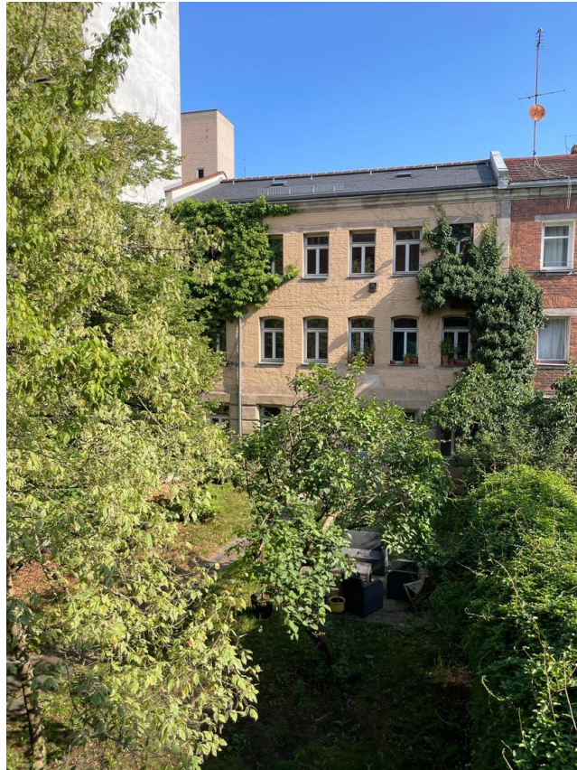
Blick in Gemeinschaftsgarten