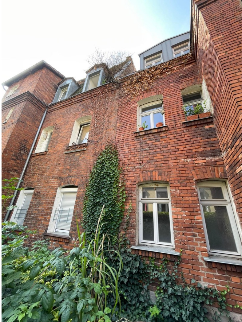
Haus von Hinten