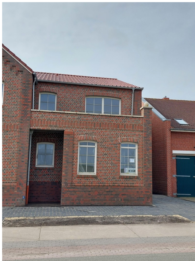
Ansicht mit Balkonnische