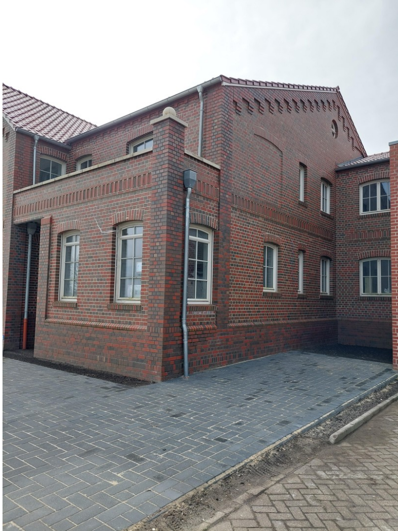
Nordwestgiebel mit Stellplatz