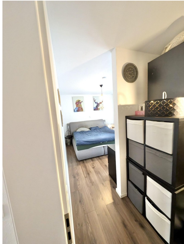
Schlafzimmer mit Vorraum