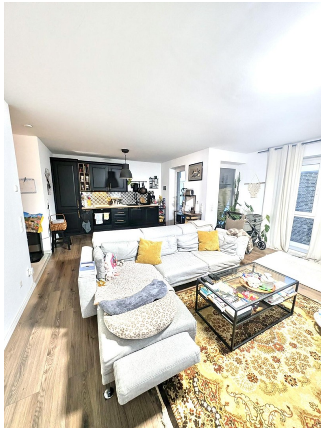
Wohnzimmer mit Küchenzeile