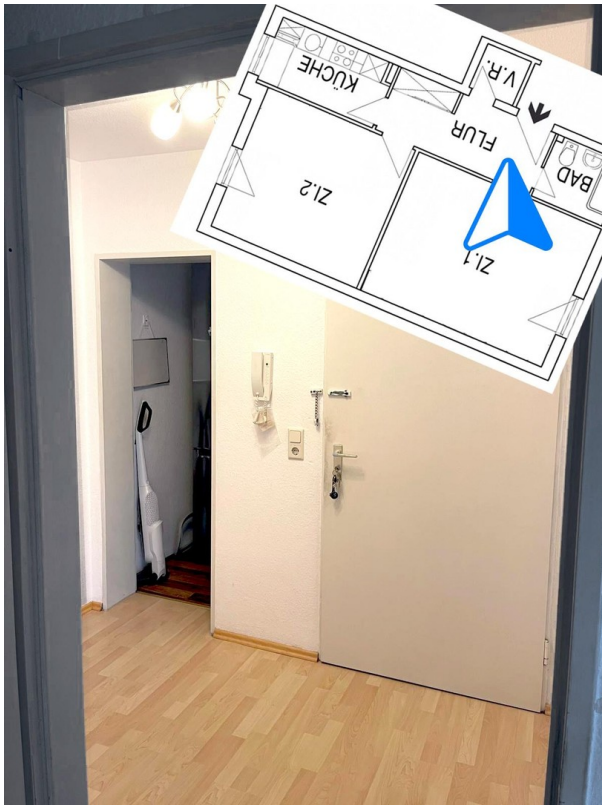
Flur, Abstellkammer v. WZ aus