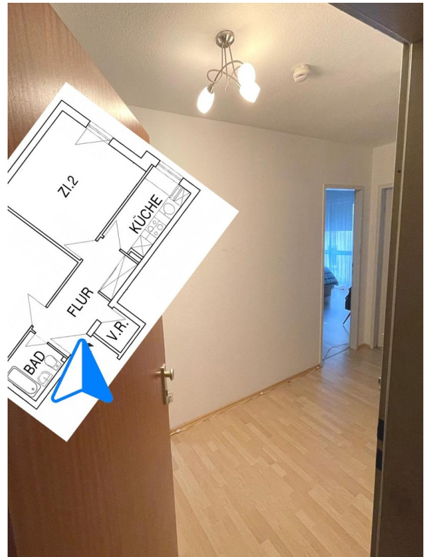
Eingang, Flur Ri. Schlafzimmer