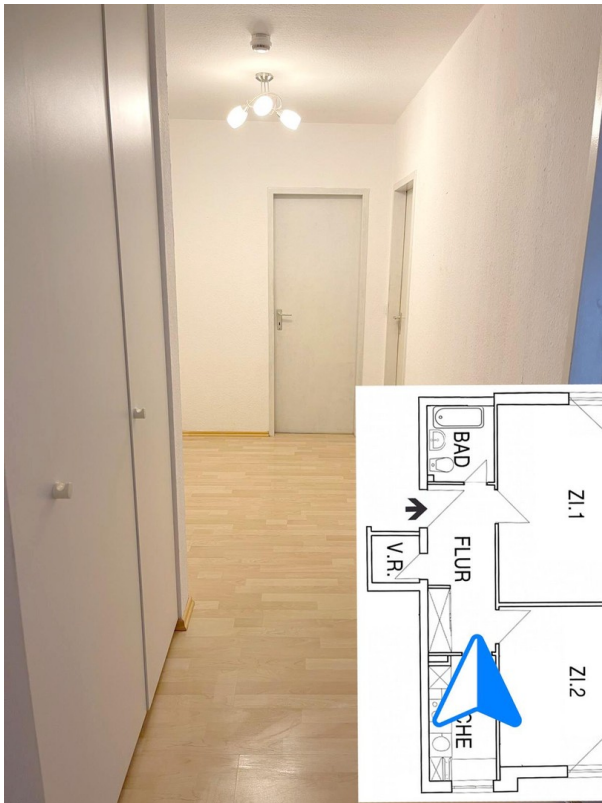
Flur Richtung Bad