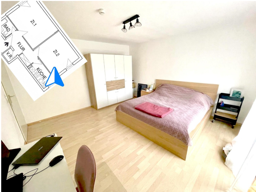
Schlafzimmer Richtung Schrank