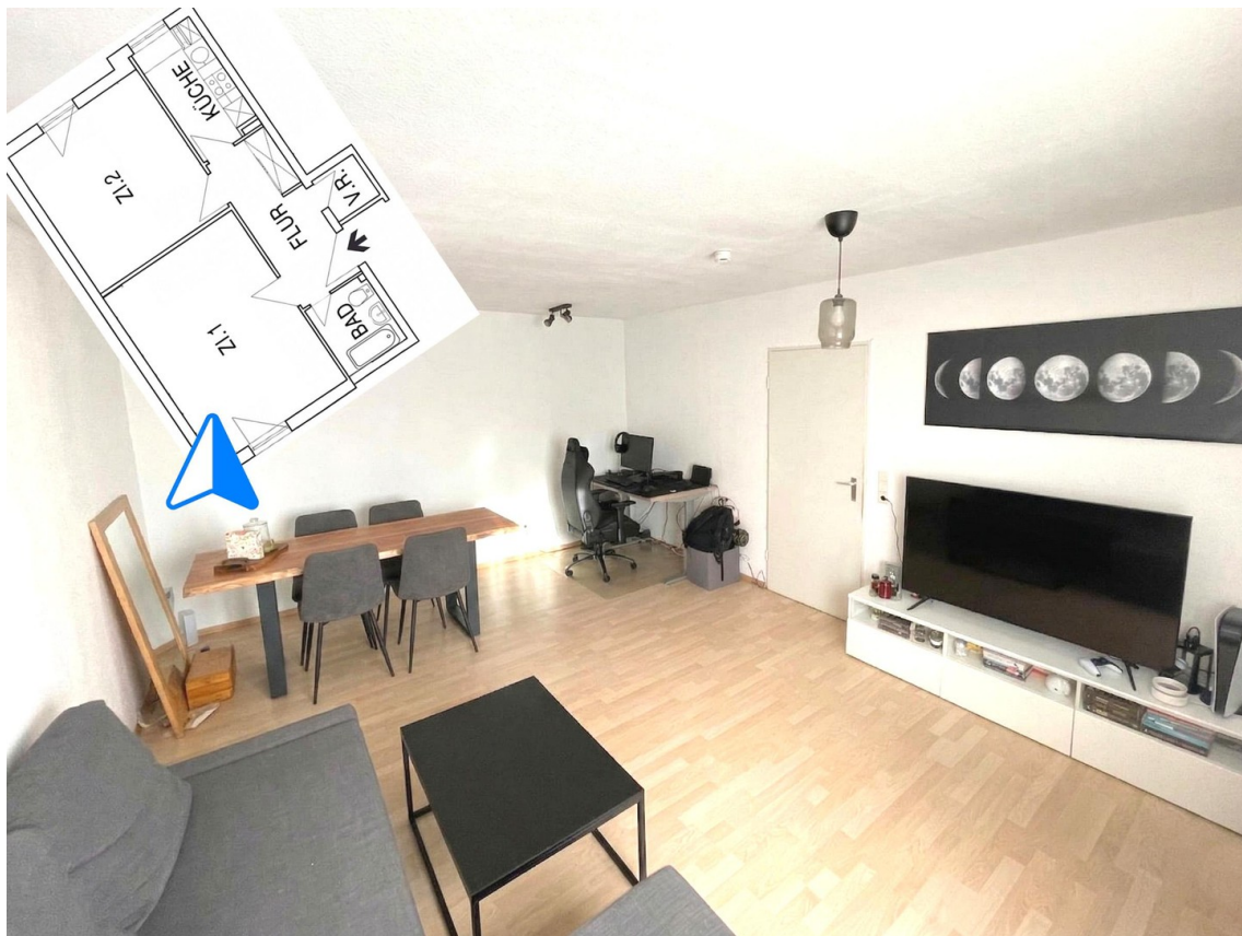
Wohnzimmer von Fensterseite