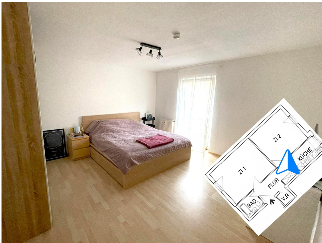
Schlafzimmer Richtung Fenster