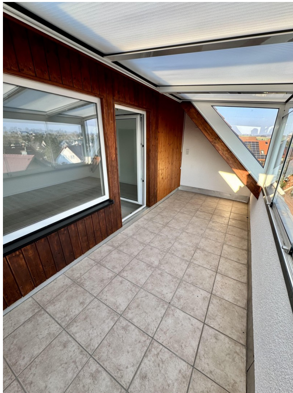
Loggia / Wintergarten