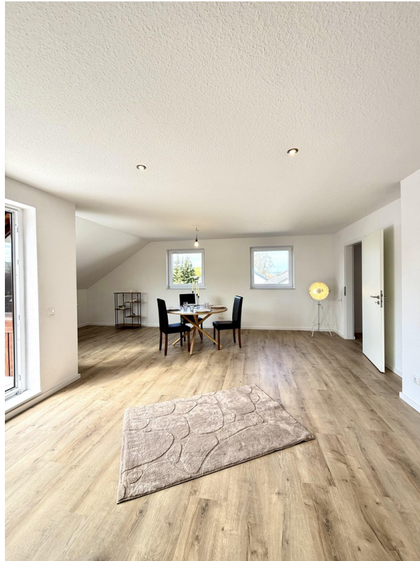
Wohnzimmer mit Essbereich