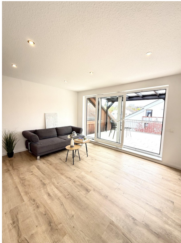
Wohnzimmer mit Dachterrasse