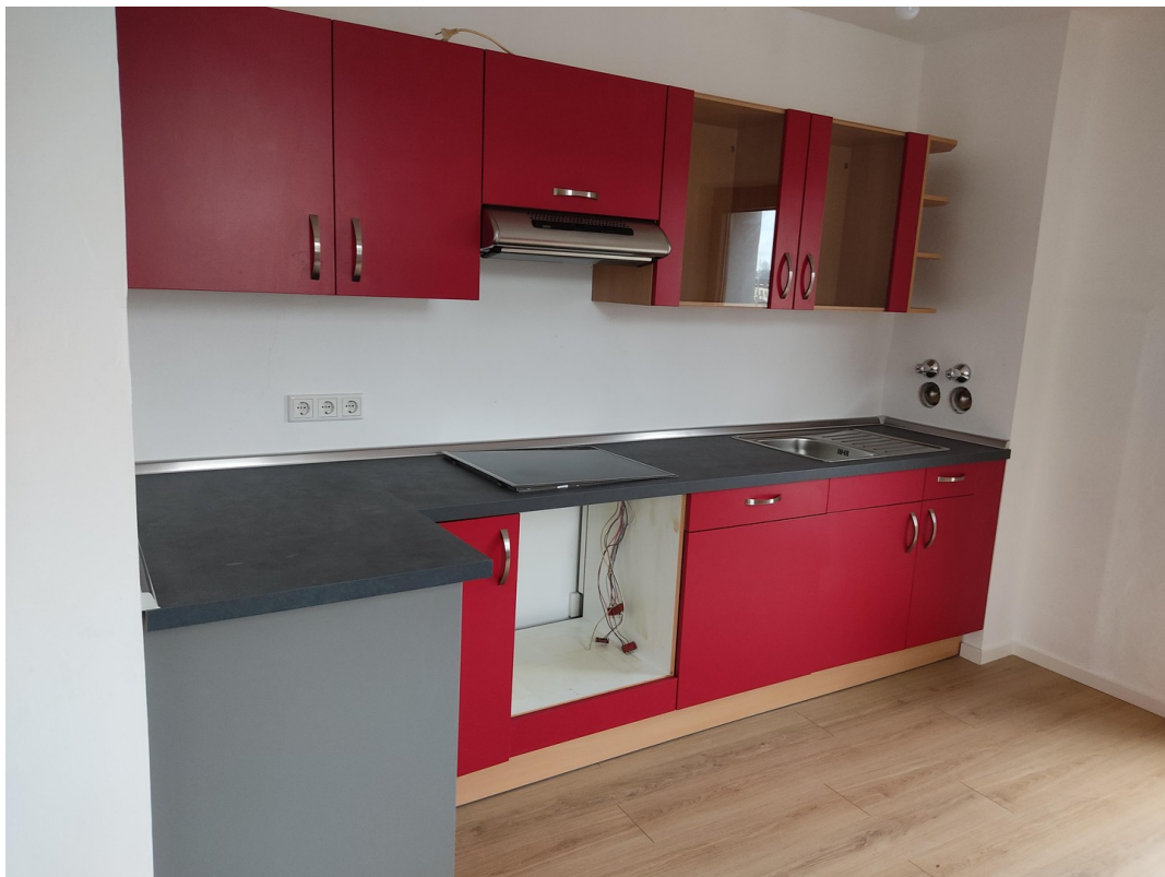
Küche (inkl. Backofen)