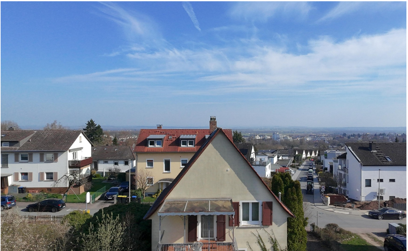
Osten - Zentrum