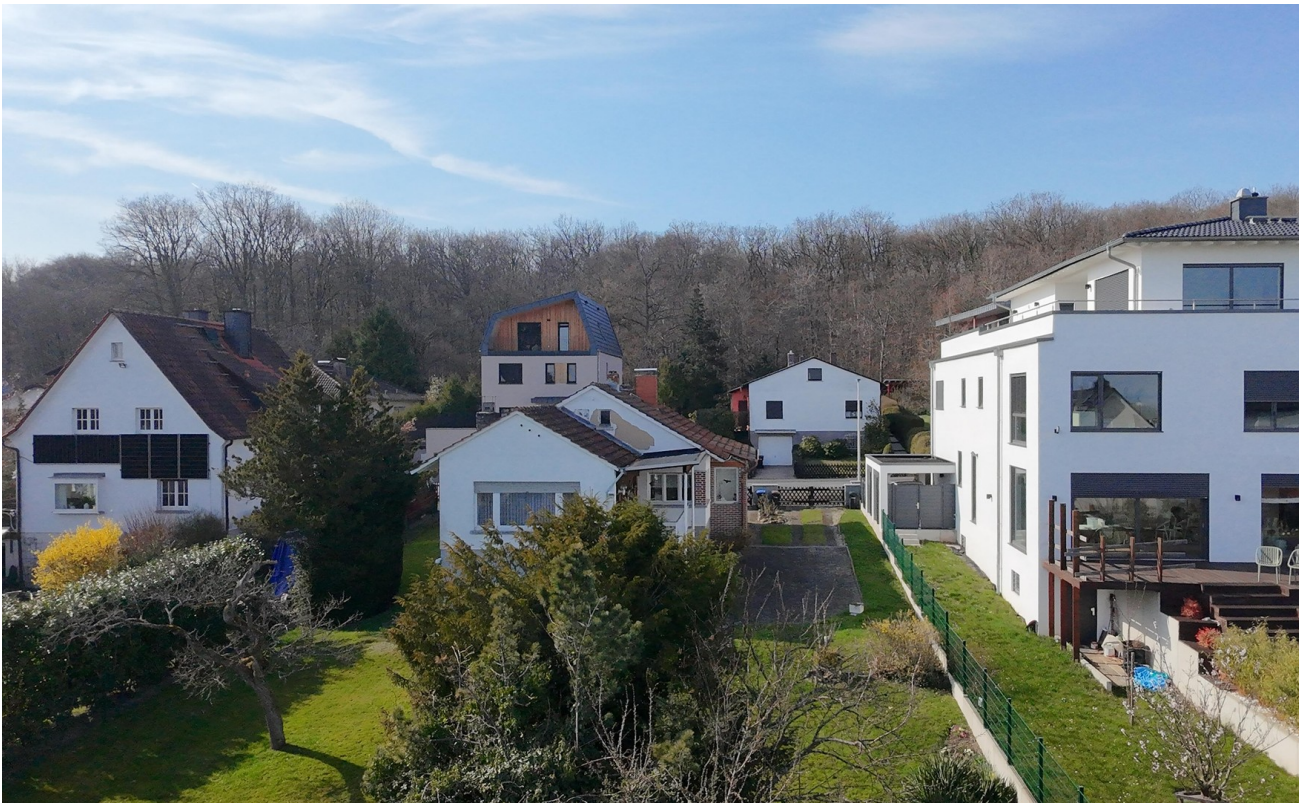
Westen - Taunuskamm