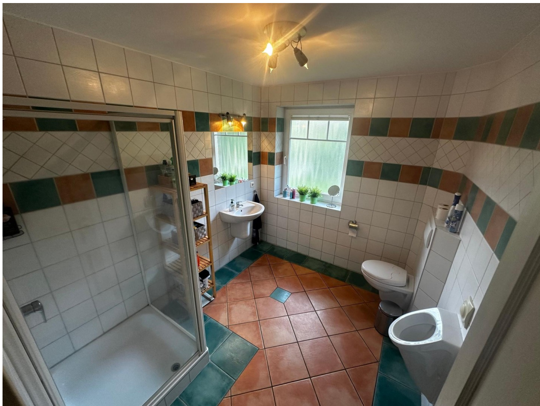
Modernes Badezimmer mit Dusche