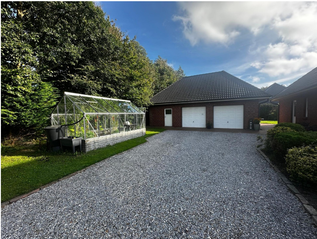
Doppelgarage mit elektrischen