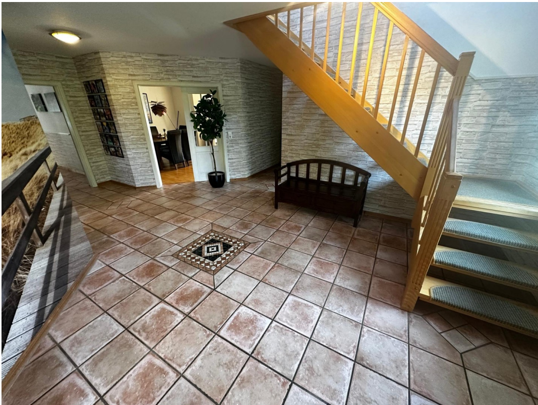
Großzügiger Eingangsbereich mi