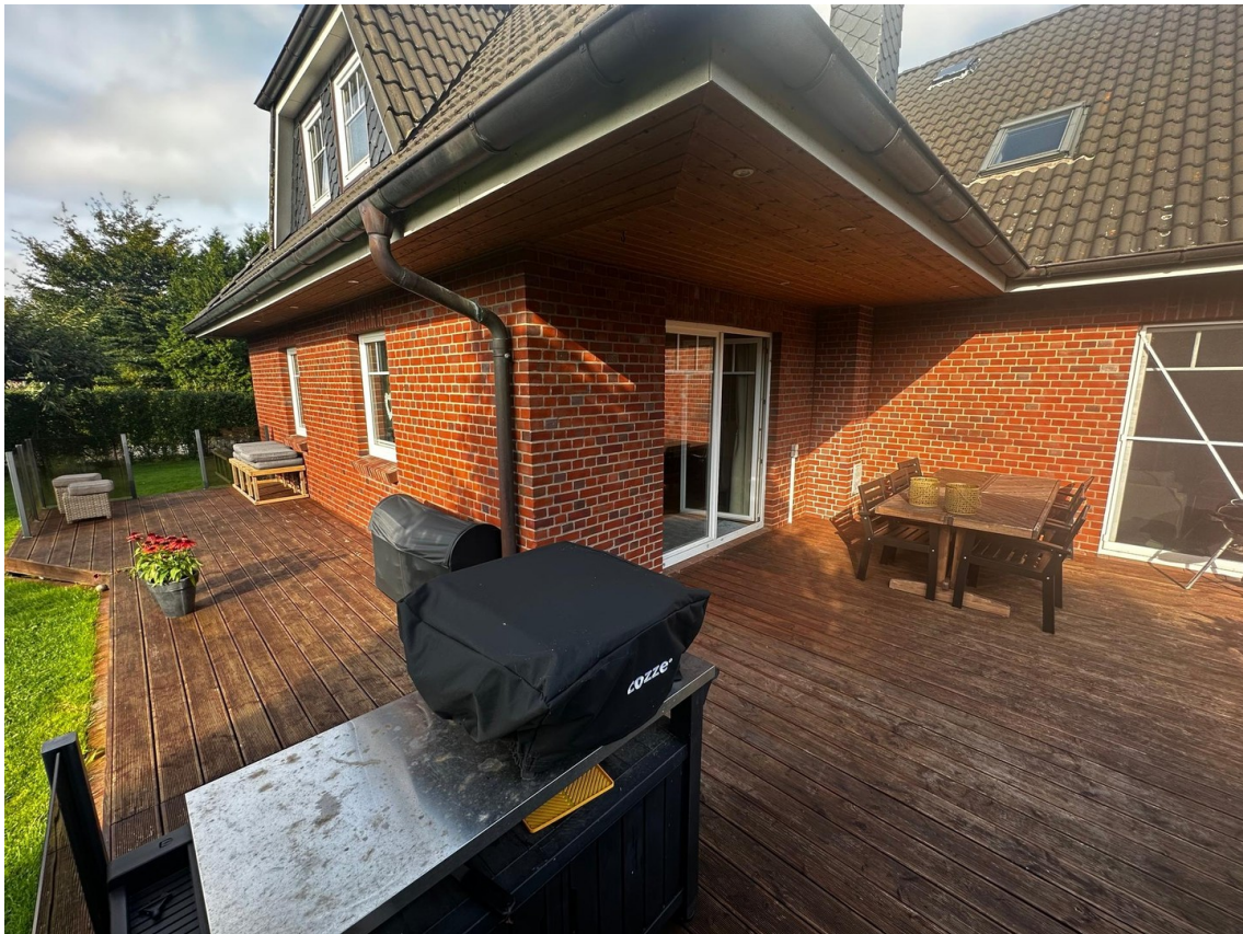
Großzügige Terrasse mit viel P