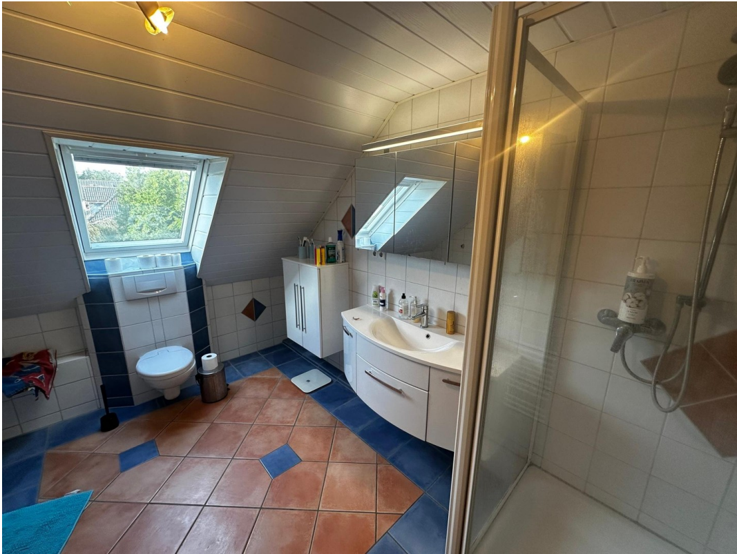
Helles Badezimmer im Obergesch