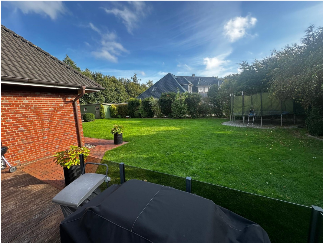
Sonniger, gepflegter Garten mi