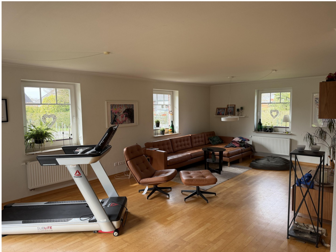
Heller und großzügiger Wohnber