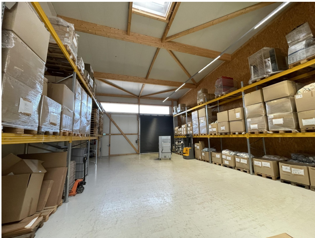
Regalierung Halle 2