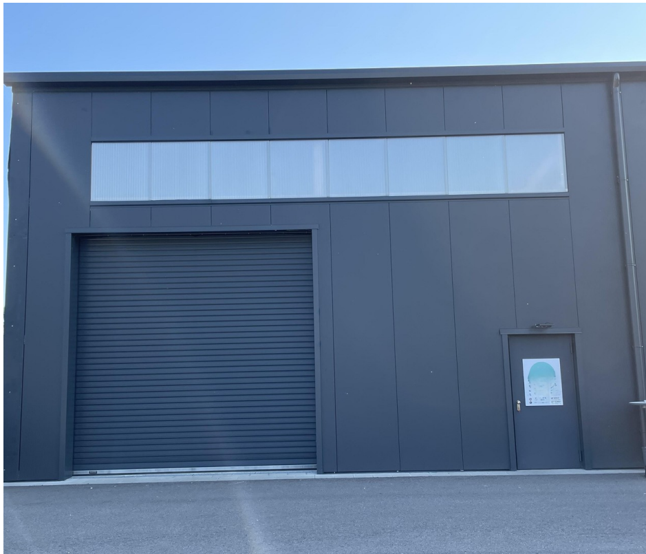
Südseite Halle 2