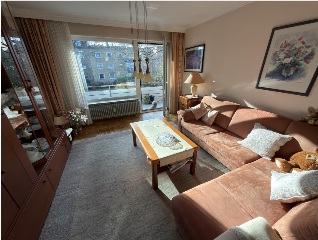
Wohnzimmer mit Möbeln