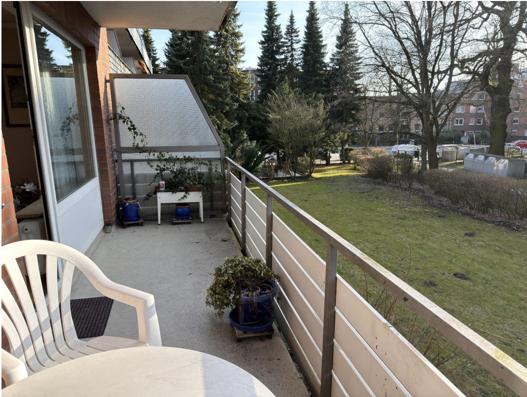
Balkon mit Blick nach links