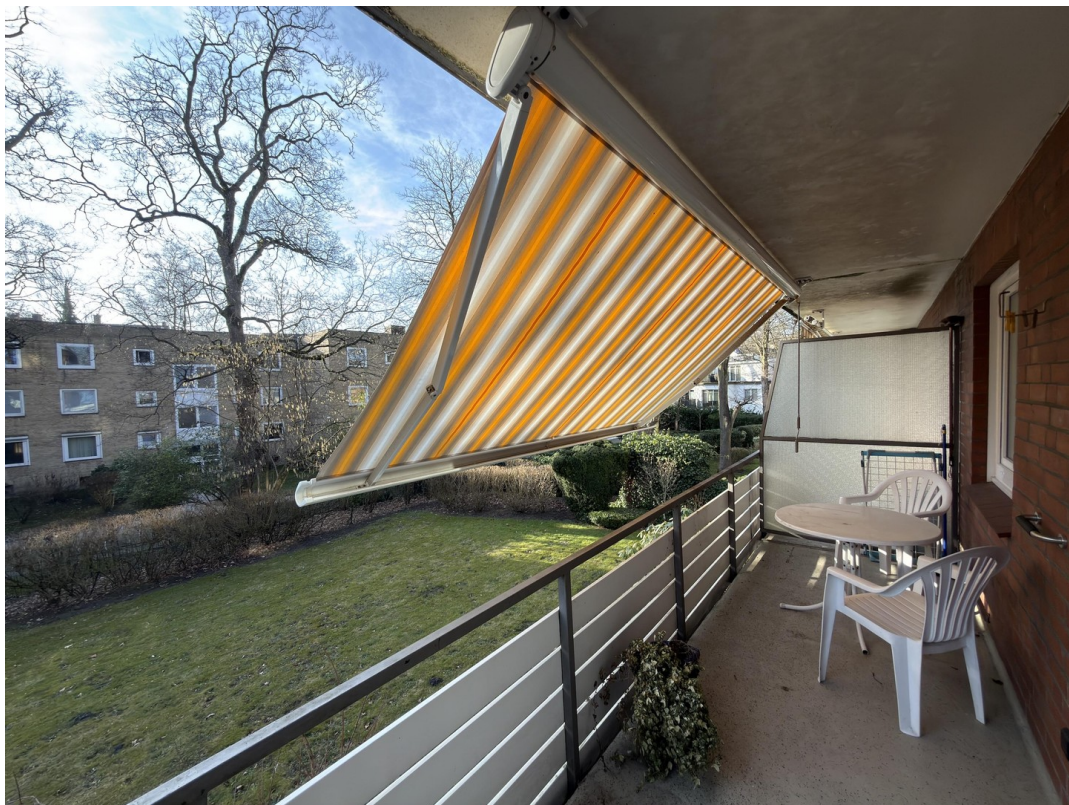
Balkon mit Markise