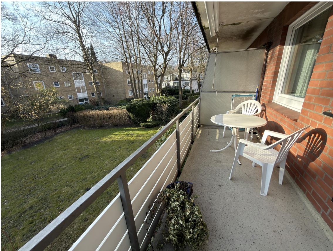
Balkon mit Blick nach rechts