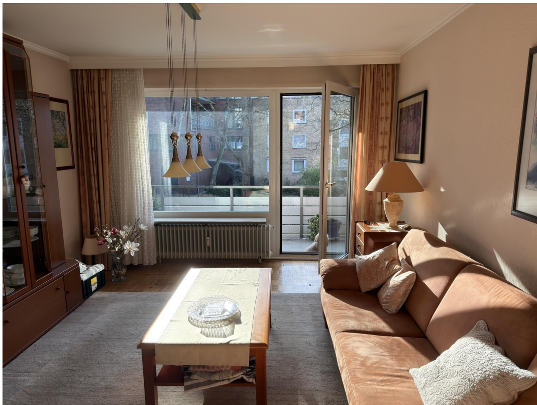
Wohnzimmer mit Möbeln