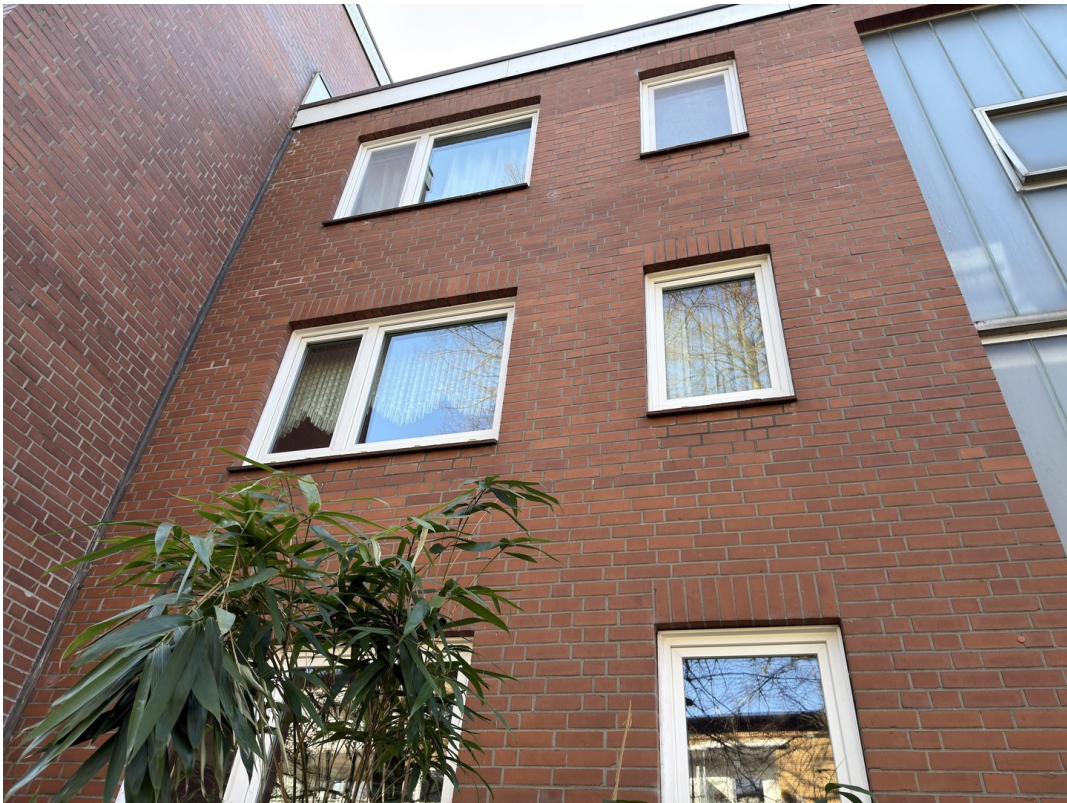
Ansicht vom Eingang aus