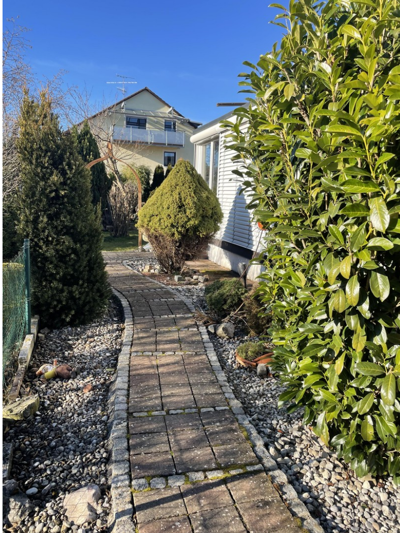
Sehr gepflegter schöner Garten