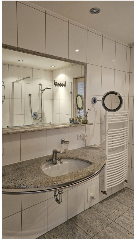
Bad EG mit FBH