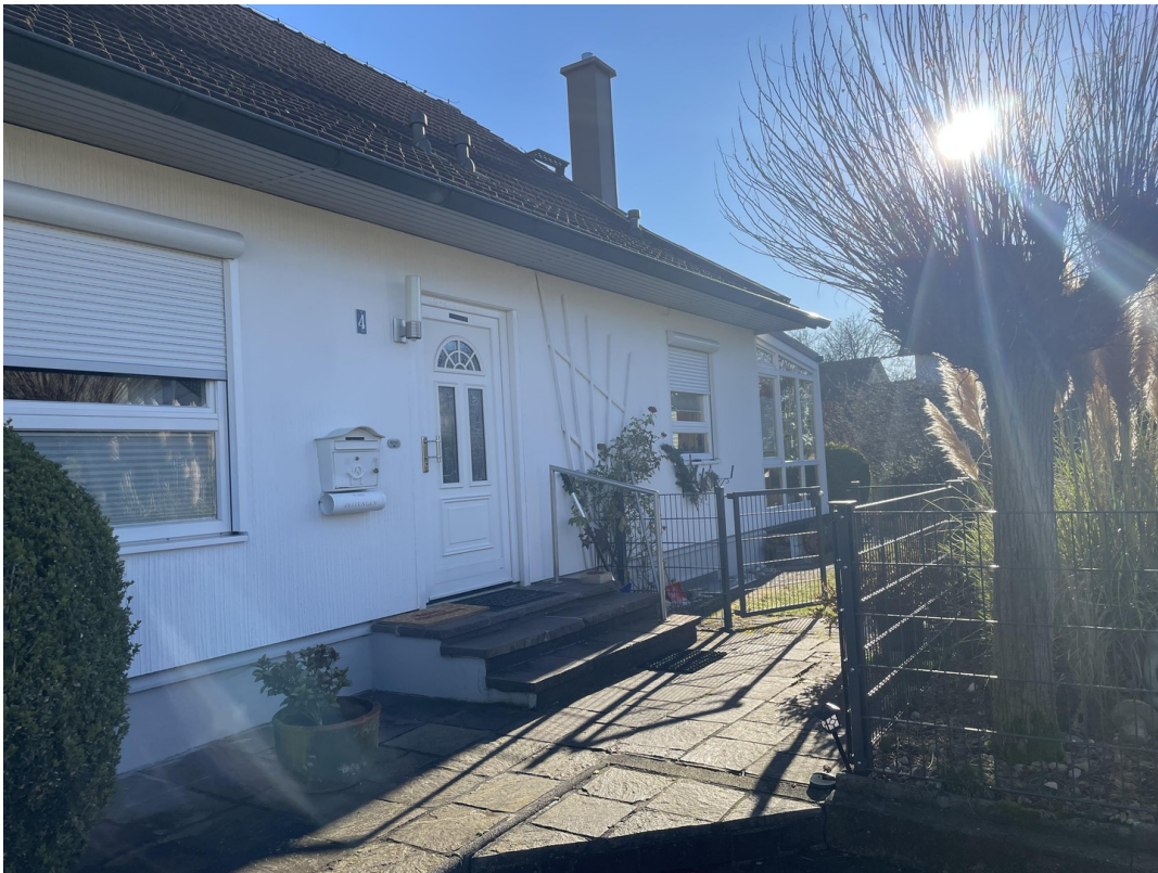
Vor dem Hauseingang