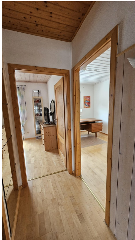
Blick in die SZ