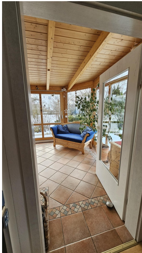
WiGarten mit Blick ins Grüne