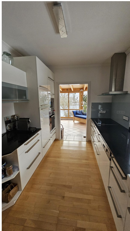
Küche mit Zutritt Wintergarten