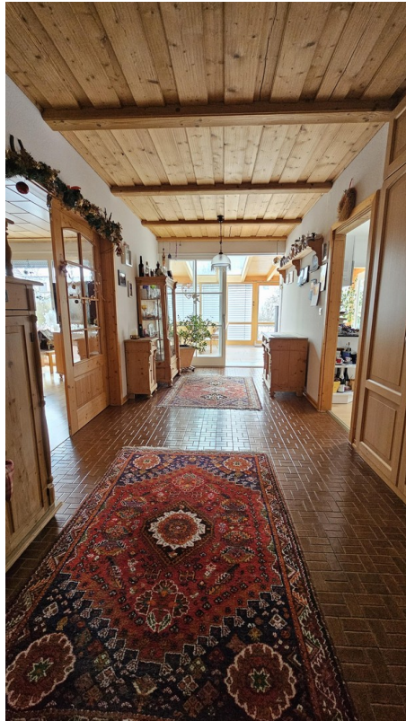
Helle große Diele, Zugang WiGa