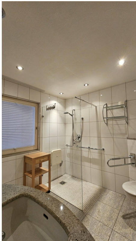
Bad EG, Fenster