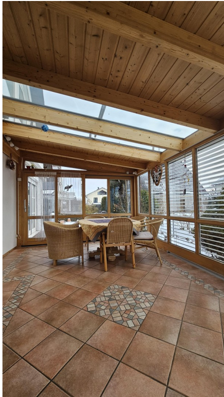
WiGarten, Austritt auf Terrasse