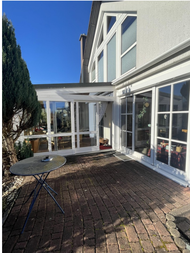
Terrasse mit Blick WiGarten