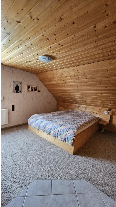
4. Schlafzimmer OG