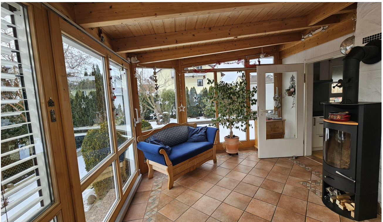
Schwedenofen im WiGarten