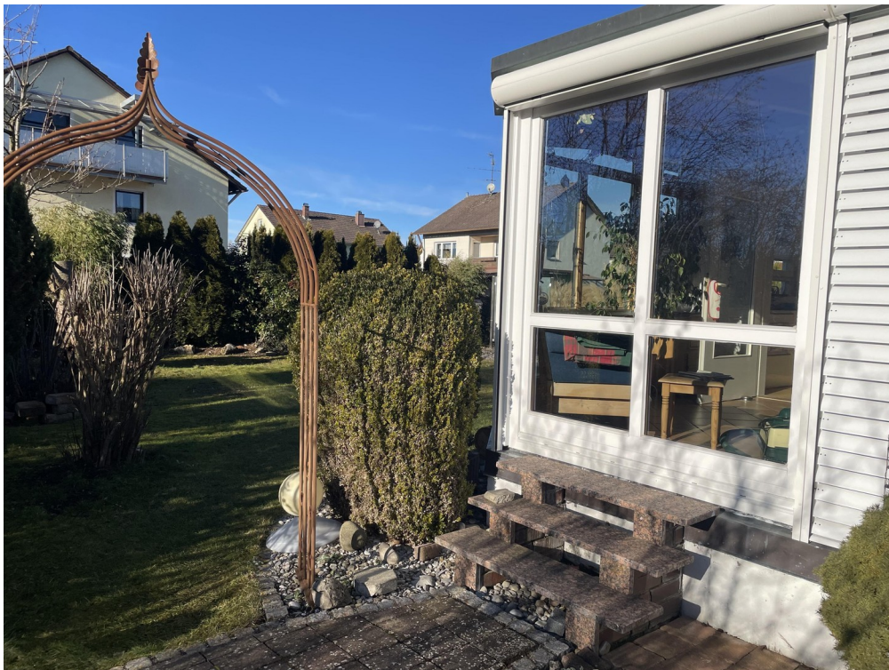
Umlaufender toller Garten