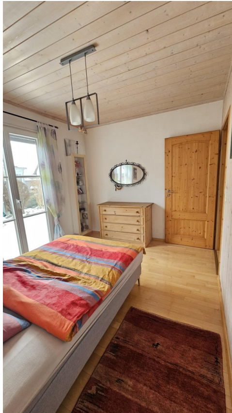
1. Schlafzimmer EG