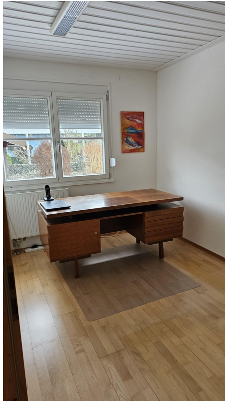
3. Schlafzimmer EG