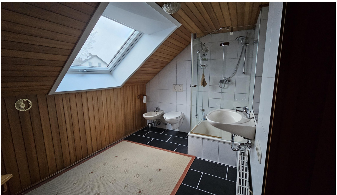
Bad OG mit Fenster