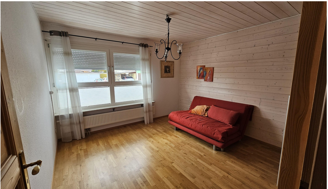
2. Schlafzimmer EG