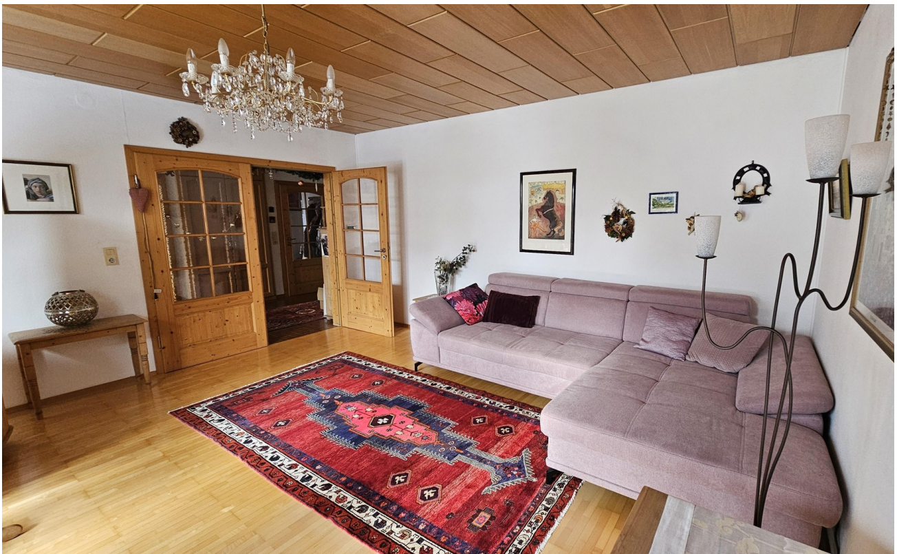
Wohnzimmer mit Parkett