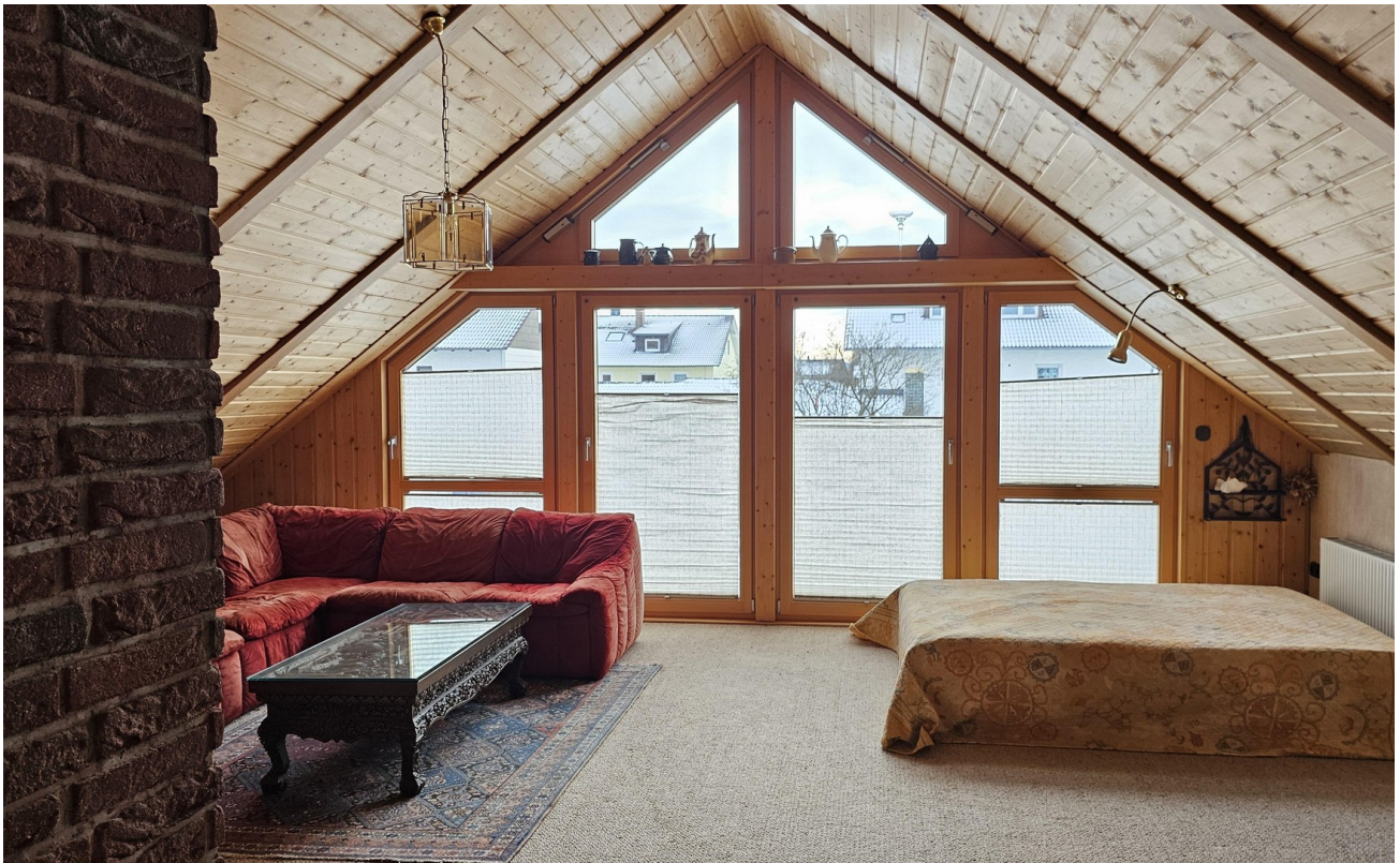
Großes helles Atelier OG