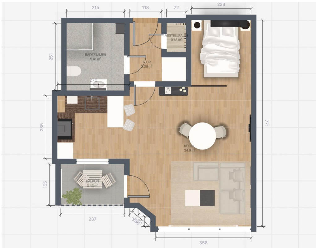
Grundriss mit Mobiliar