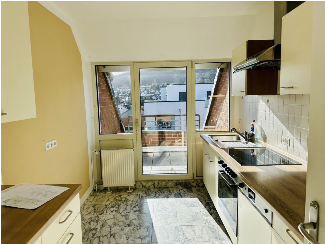
Küche mit Dachterrasse