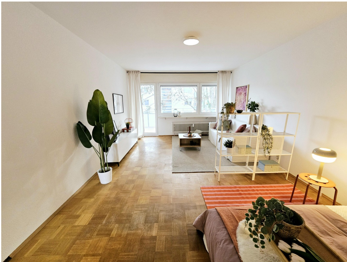
Wohn- & Schlafbereich