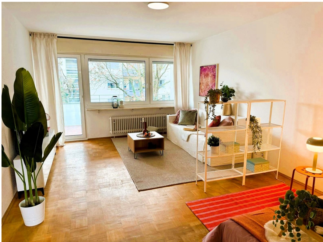
Wohn- & Schlafbereich