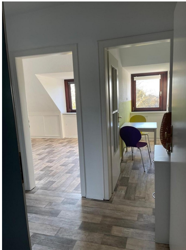
Blick in Küche und Wohnraum