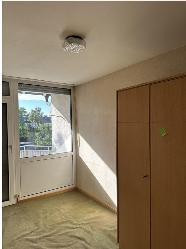
1. OG - Zimmer 2