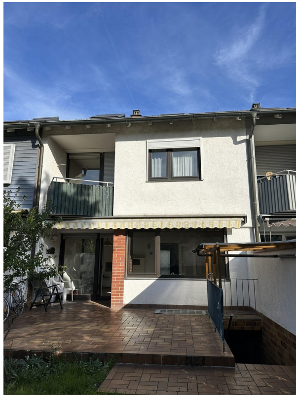
Rückseite Haus (Garten)