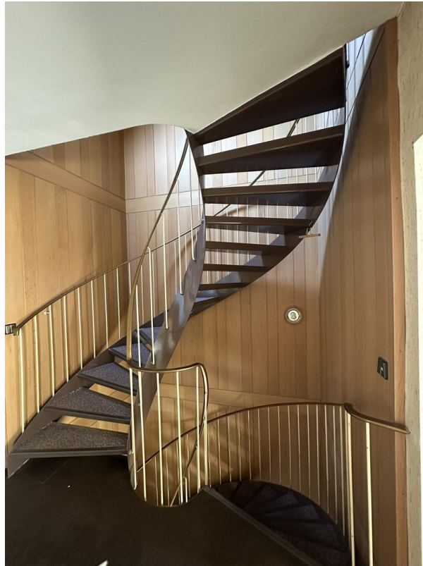
Treppenaufgang zu 1. OG