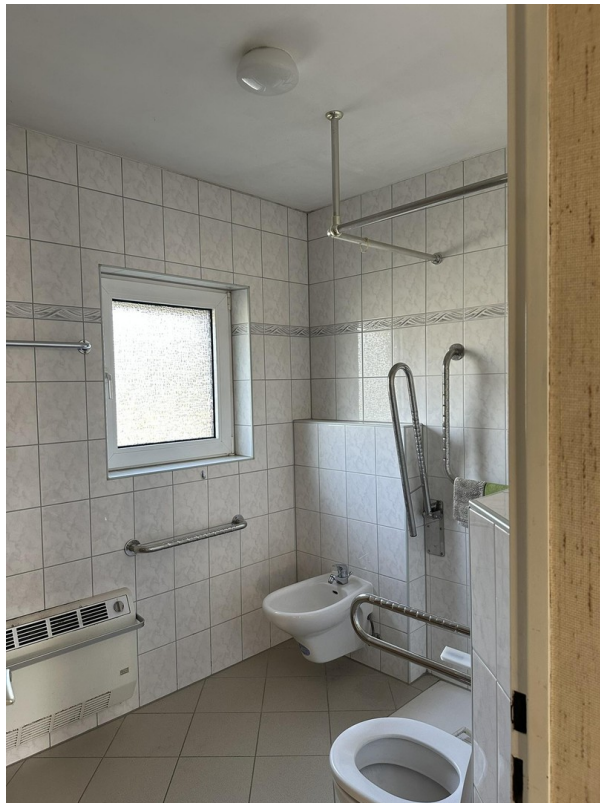
Badezimmer 1. OG