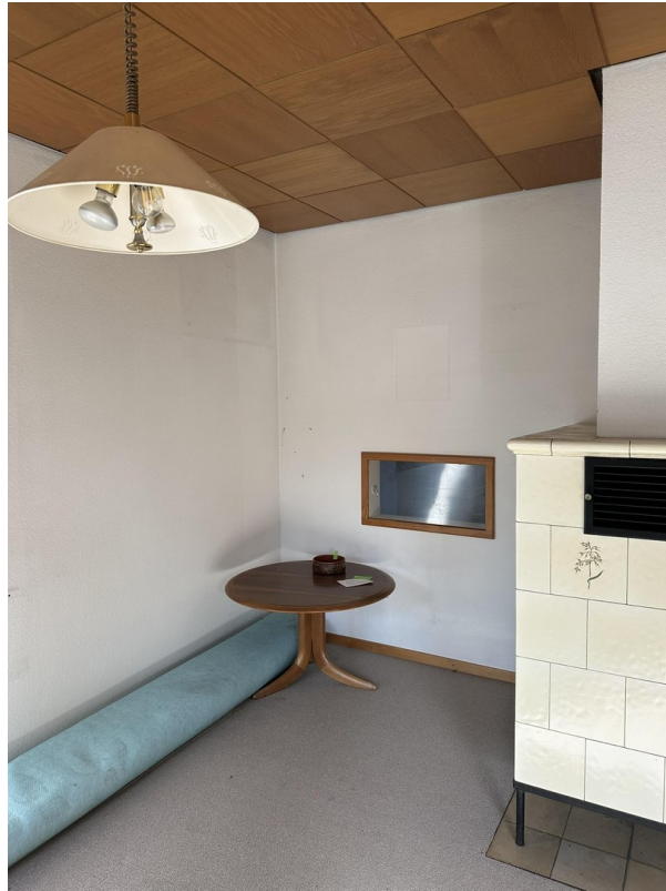
Wohnzimmer mit Fenster Küche