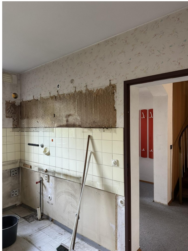
Küche mit Blick in den Flur