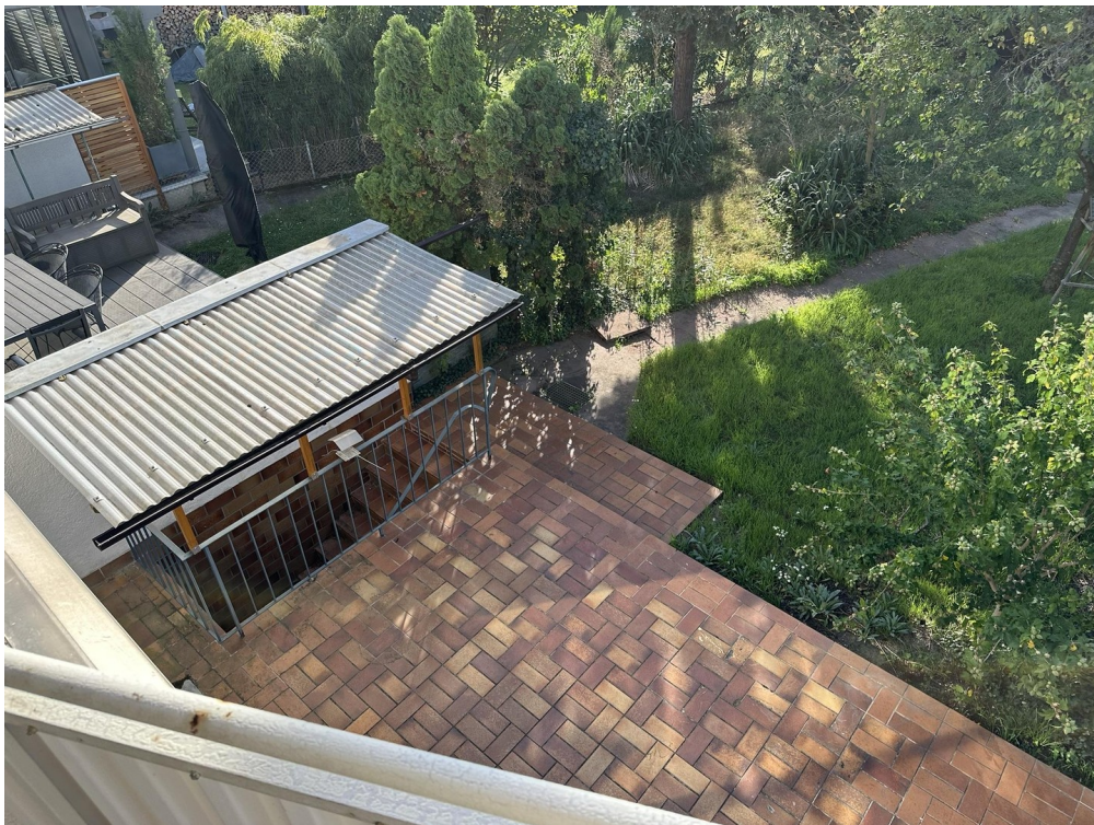
Blick von Balkon auf Terrasse