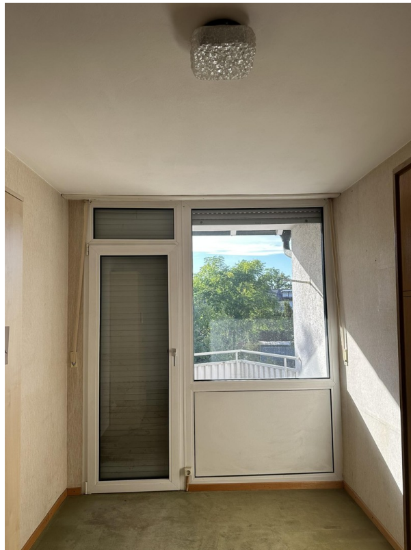
1. OG - Zimmer 2