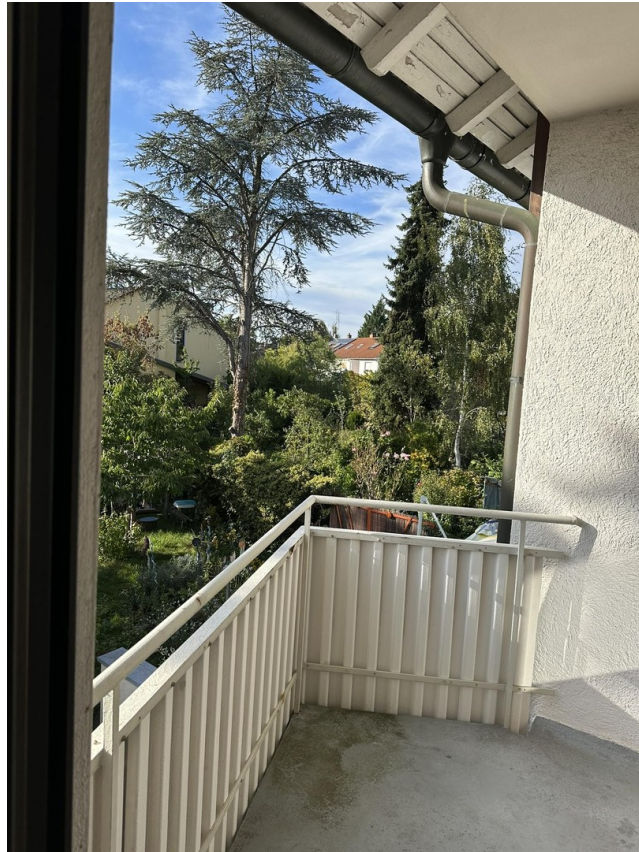
Balkon 1. OG