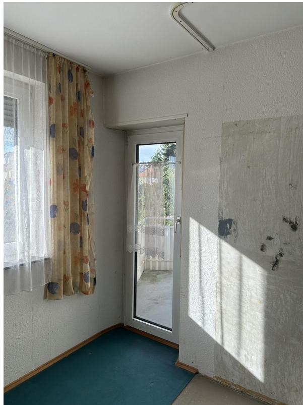
1. OG - Zimmer 1