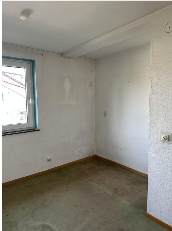
1. OG - Zimmer 3