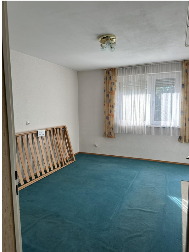
1. OG - Zimmer 1