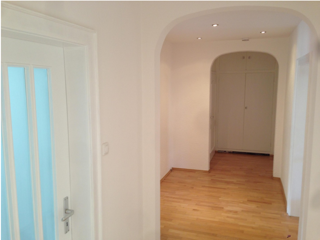
Zugang zu Badezimmer