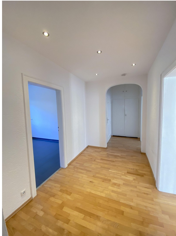
Diele mit Wandschrank