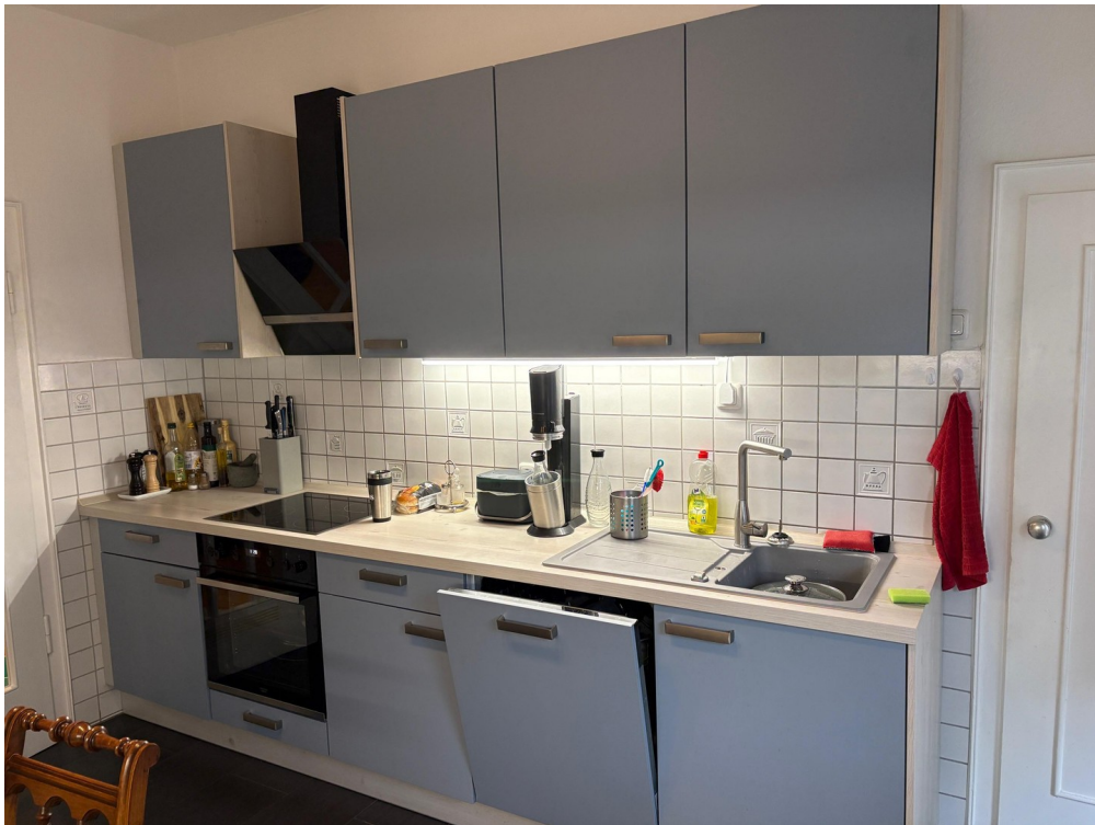
Küche - Gestaltungsbeispiel