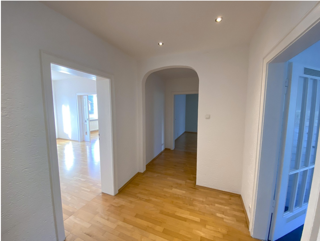
Zugang zu Küche u. Wohnbereich