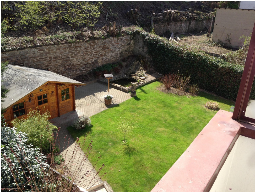
Blick von Balkon