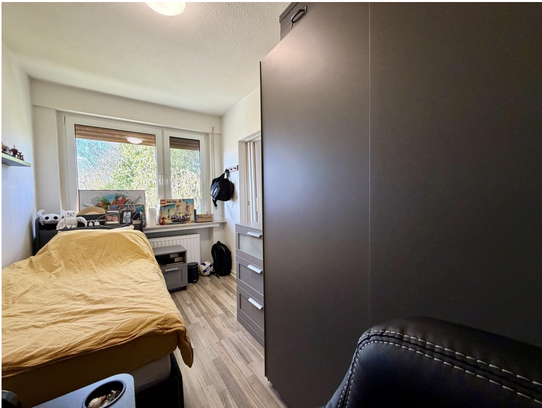
Kinderzimmer / Arbeitszimmer