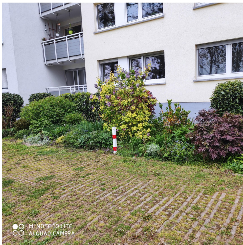
Außenansicht des Gebäudes