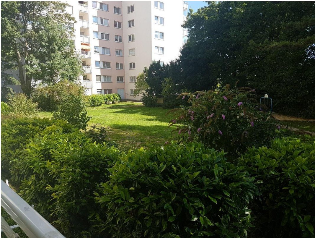
Außenansicht des Gebäudes 2