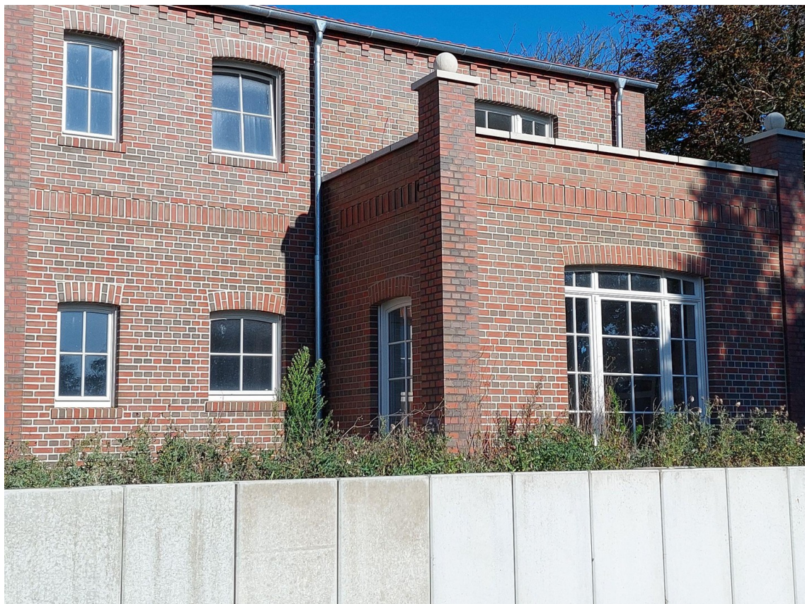
Dachterrasse über Erdgeschoss