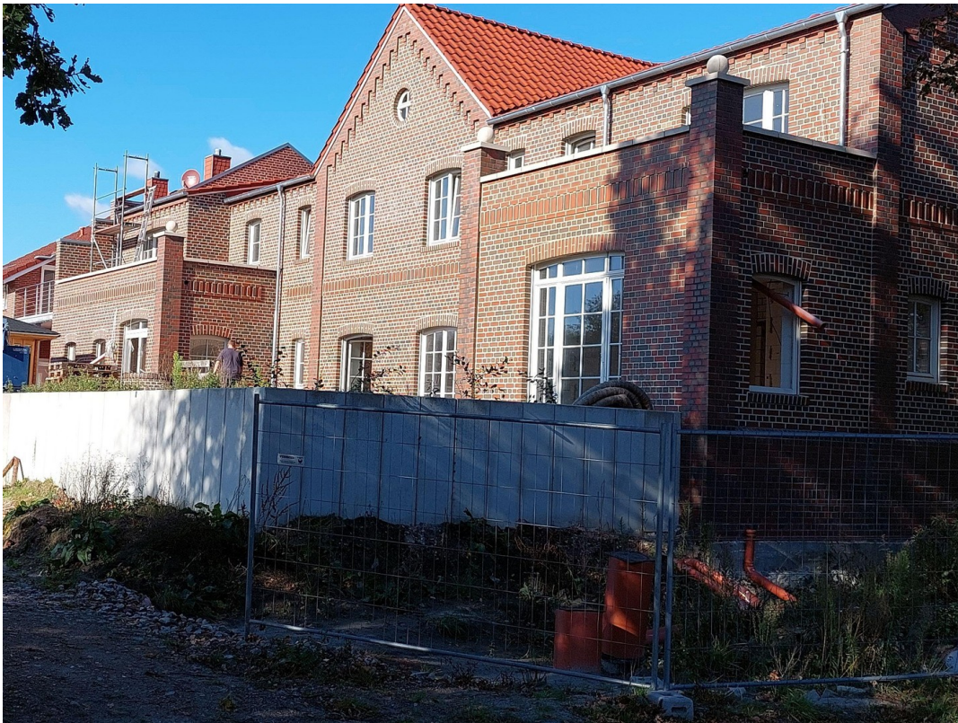
Dachterasse über Erdgeschoss