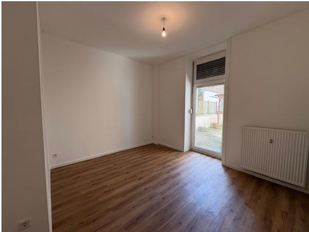
Küche mit Zugang zur Terrasse