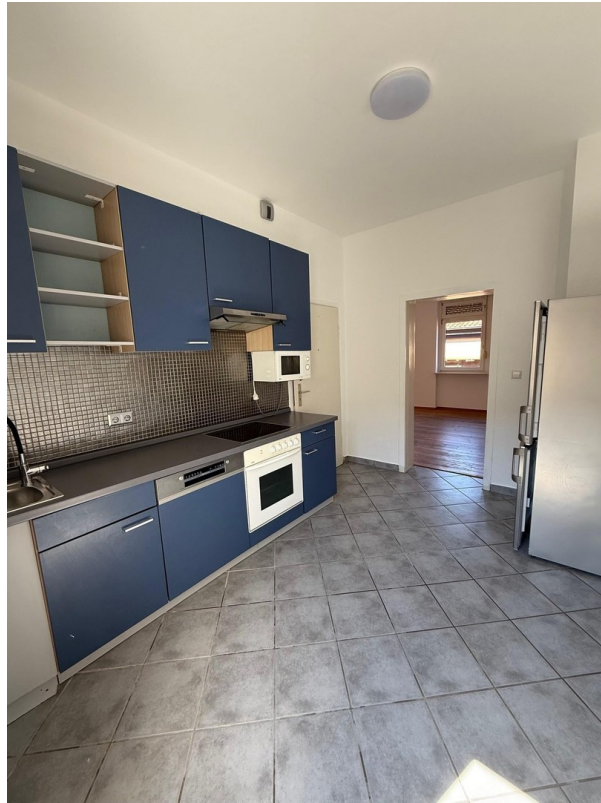
Einbauküche mit E-Geräten