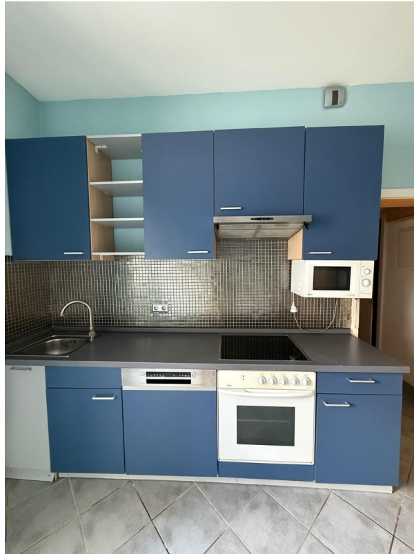
Einbauküche mit E-Geräten