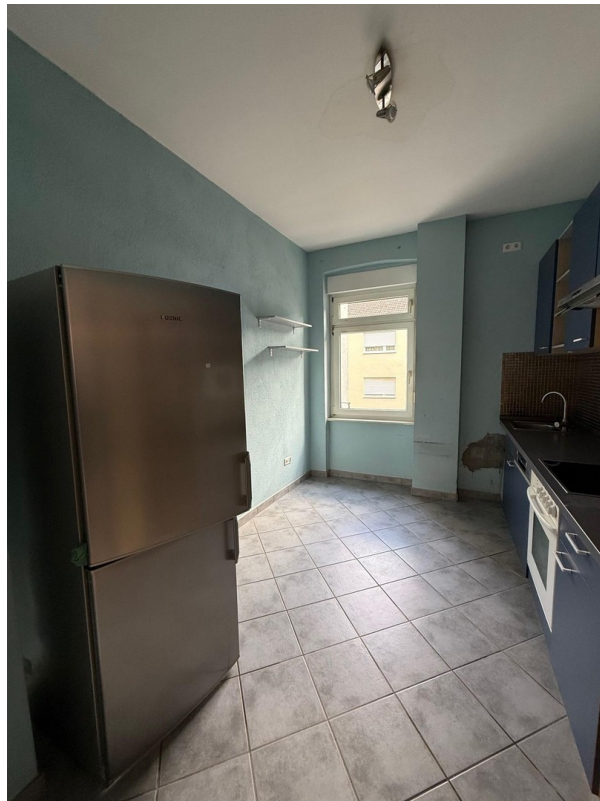
Küche mit Kühlschrank