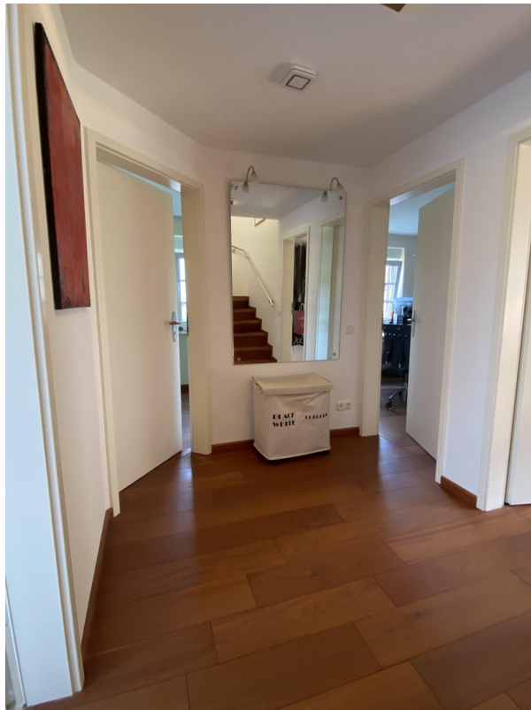
1. OG Flur