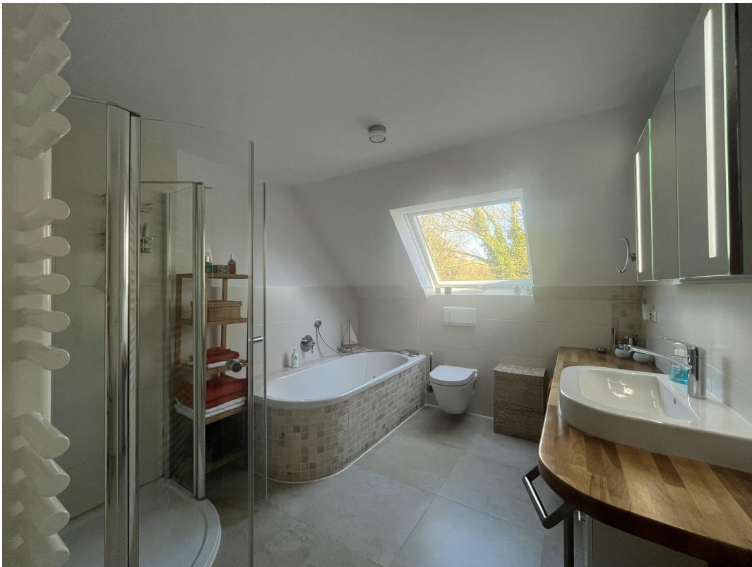
1. OG Bad