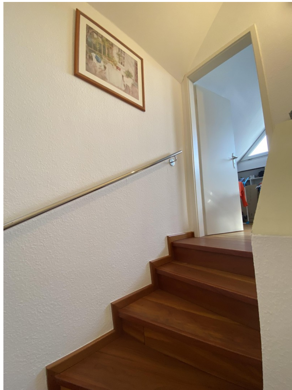
Treppe zum 2. OG