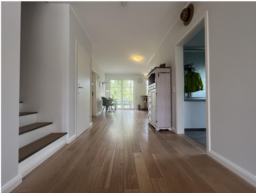
Blick Richtung Küche