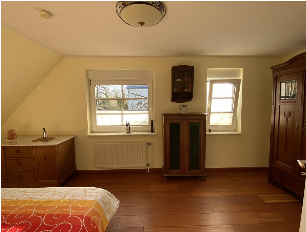
1. OG Schlafzimmer