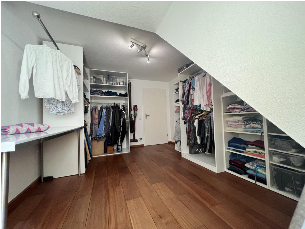
1. OG Ankleidezimmer