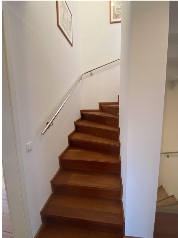
Treppe zum 2. OG