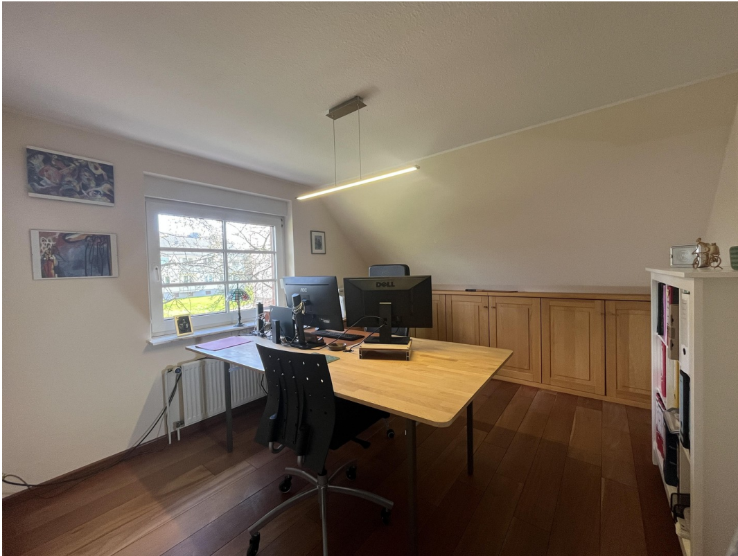
1. OG Arbeitszimmer