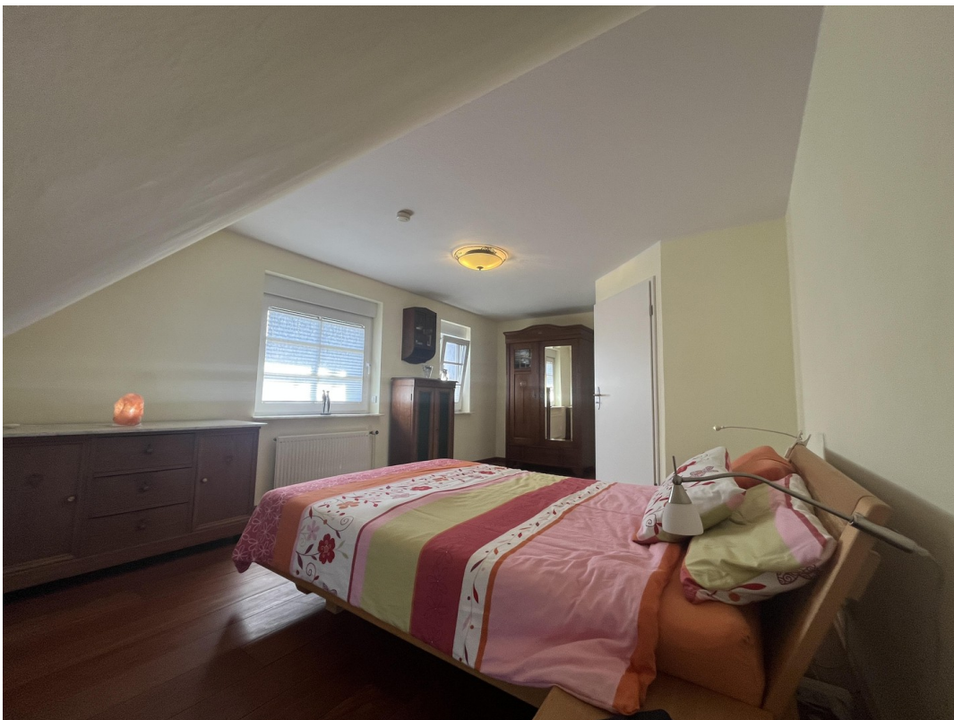
1. OG Schlafzimmer