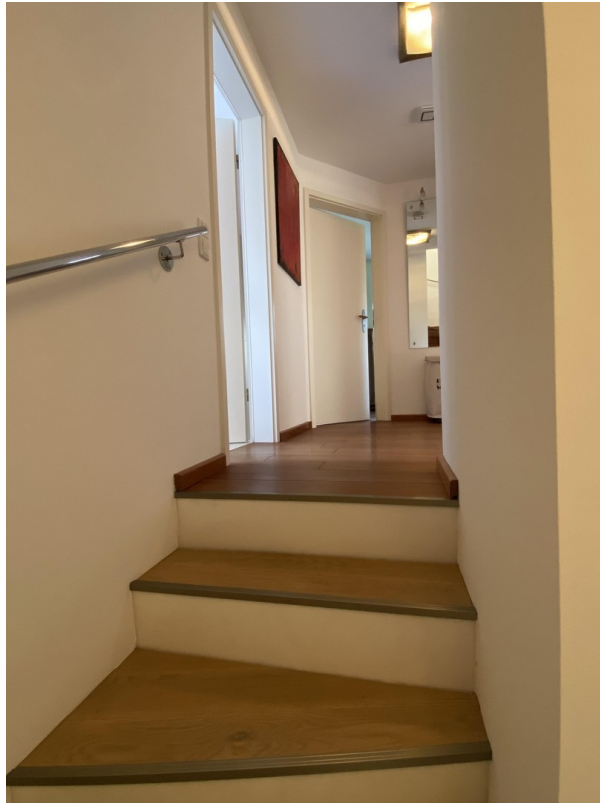
Treppe zum 1. OG