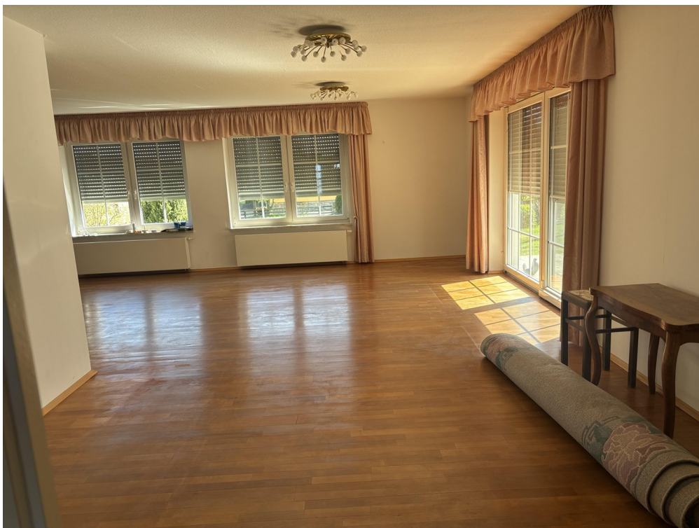
Wohnbereich mit Terrassentür