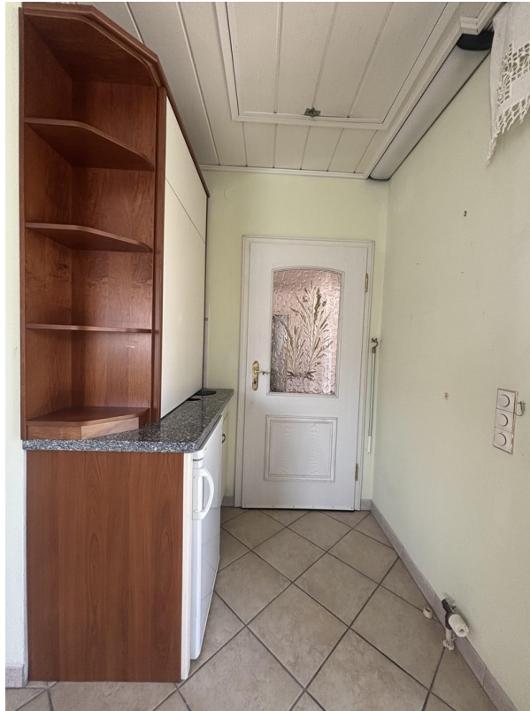
für Zapfanlage u. 2.Spülbecken