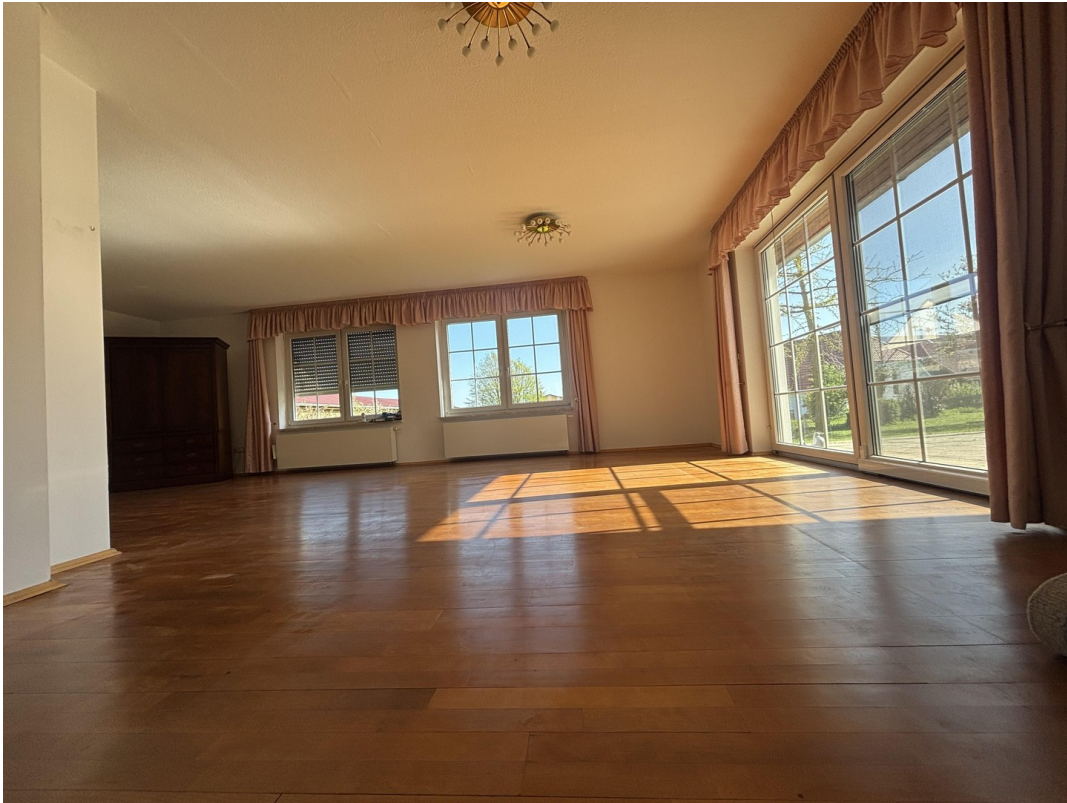
Wohnbereich mit Terrassentür