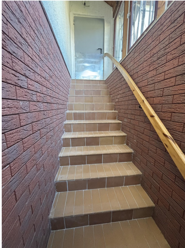
2. Treppenaufgang außen