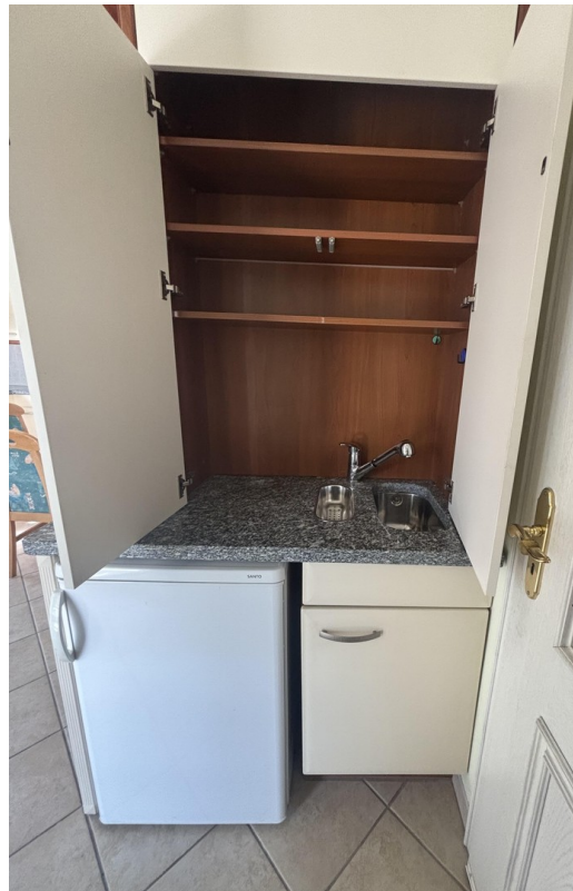
für Zapfanlage u. 2.Spülbecken