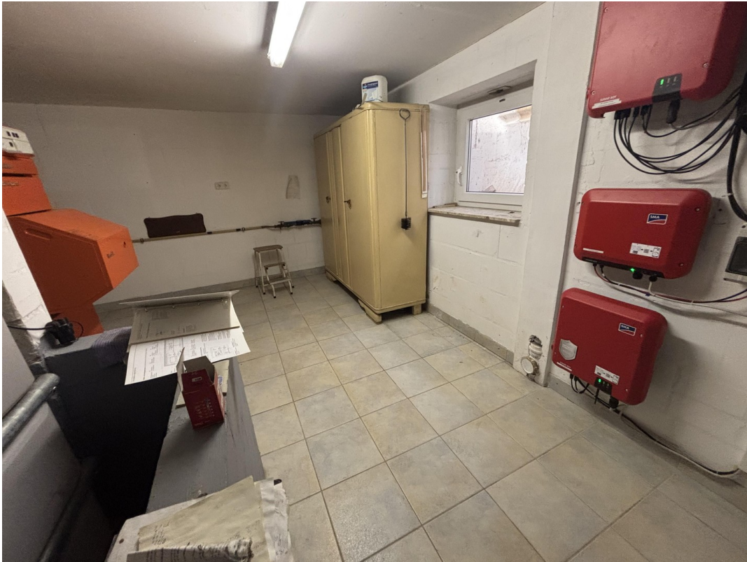
Heizungsraum mit Schrank