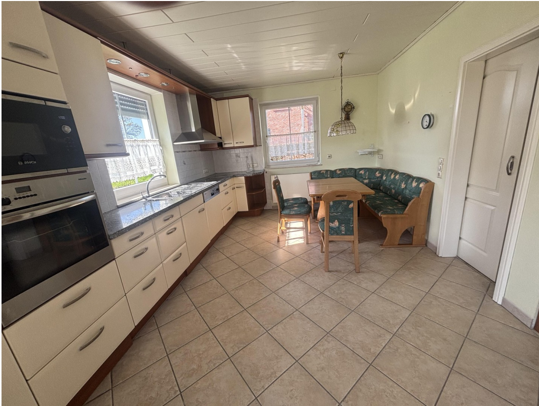
Küchenzeile - Essecke