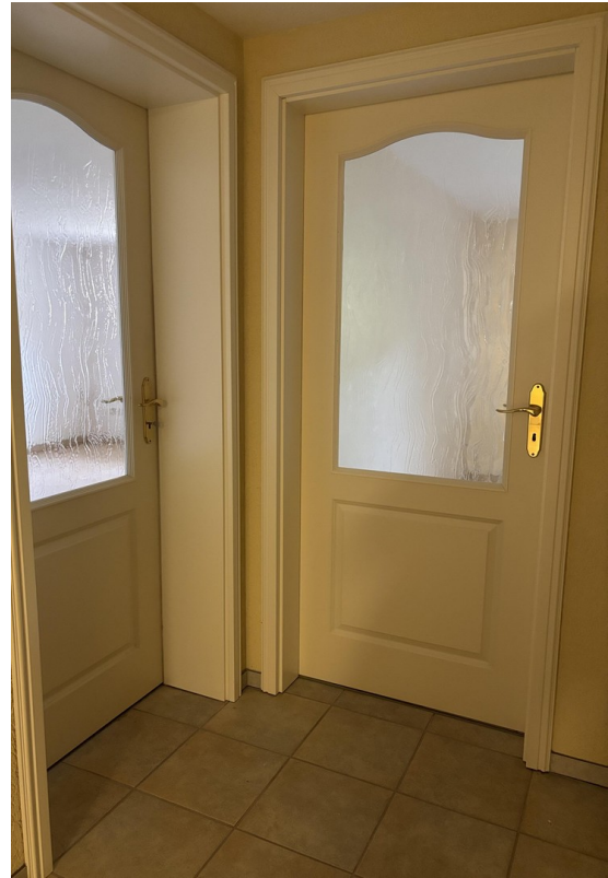
Souterrain _ Türen zum: