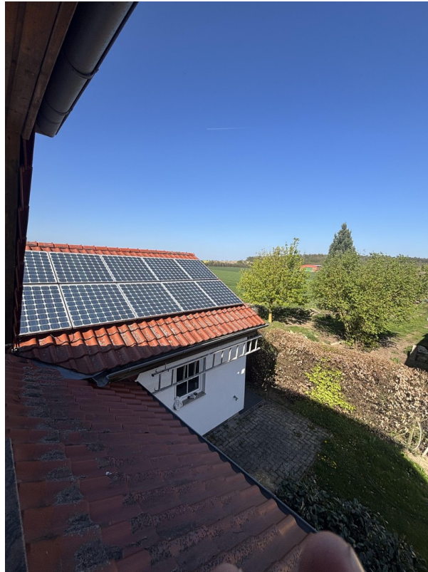
Ausblick auf das Garagendach