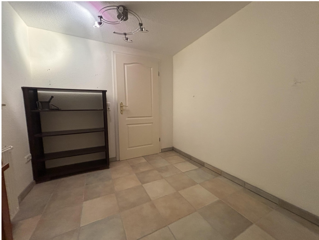
Raum mit Küchenanschluß