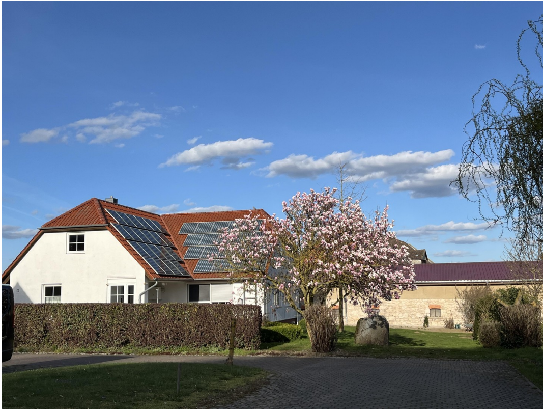
Giebel, Garten Hecke, Findling