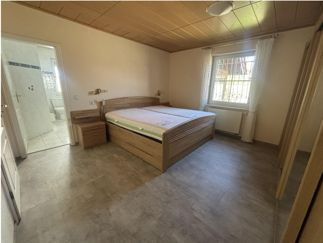
Schlafzimmer mit Tür zum Bad