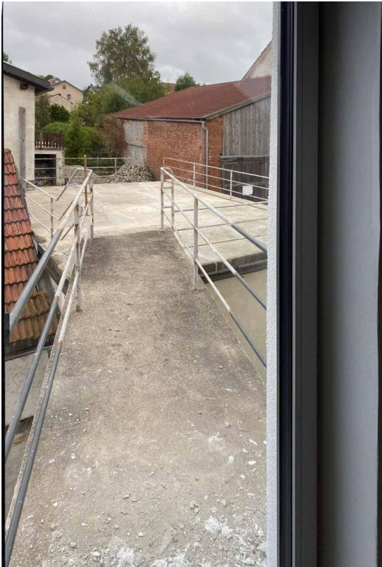
Brücke zur Terrasse