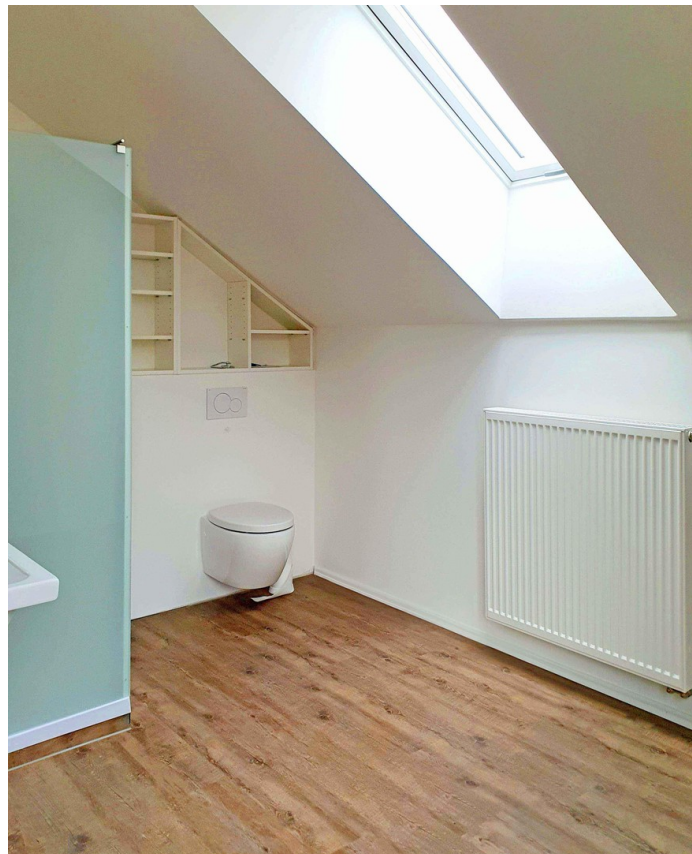
Modernes, helles Bad