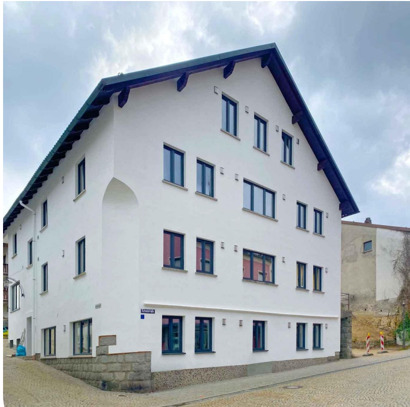
Wohnung im Dachgeschoss