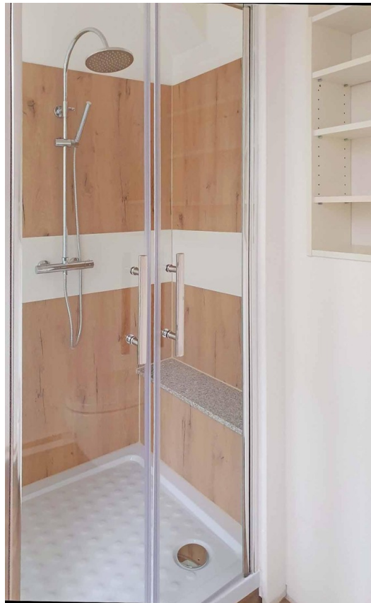
Modernes, helles Bad