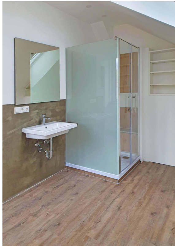
Modernes, helles Bad