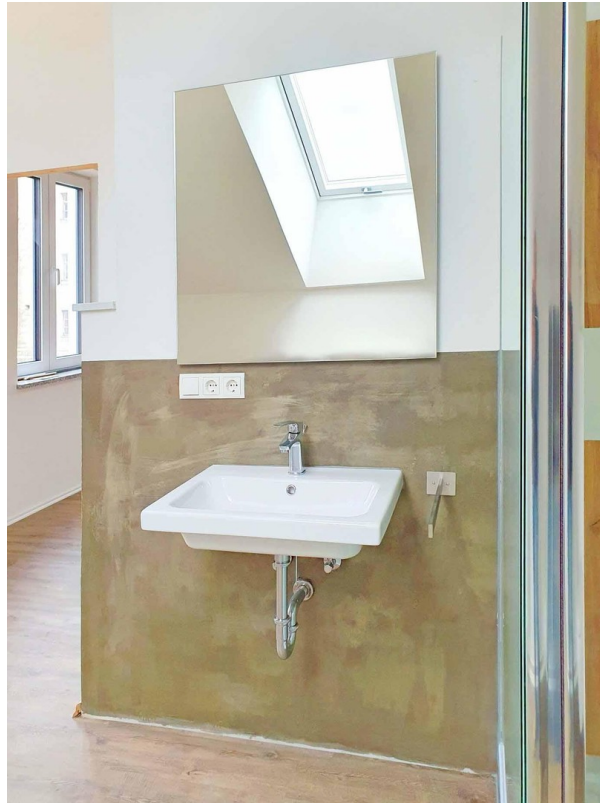
Modernes, helles Bad