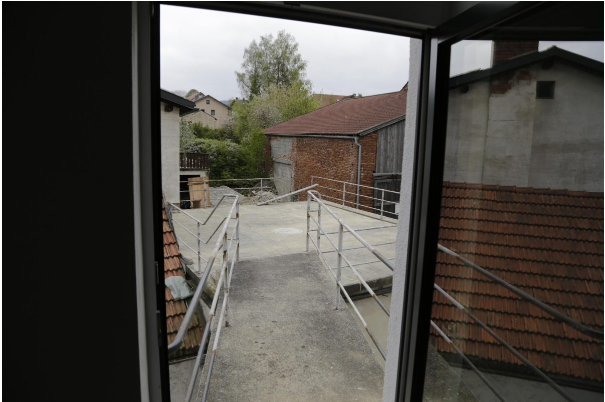
Brücke zur Dachterrasse