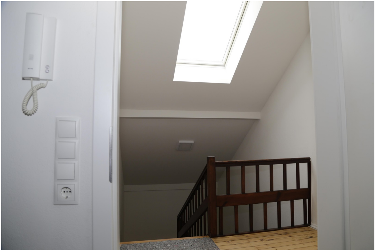
Treppenaufgang und Vorraum