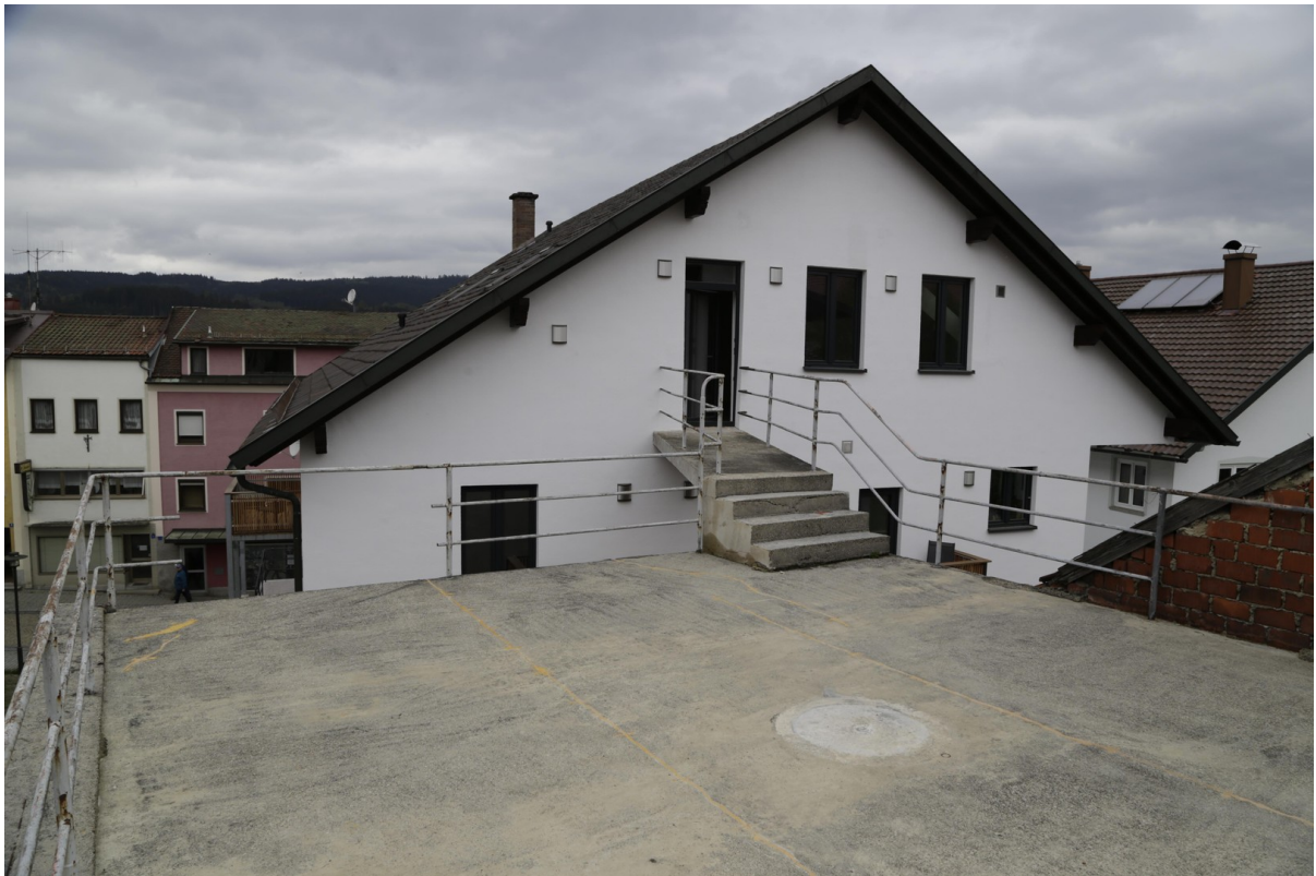
Dachterrasse, wird noch sanier