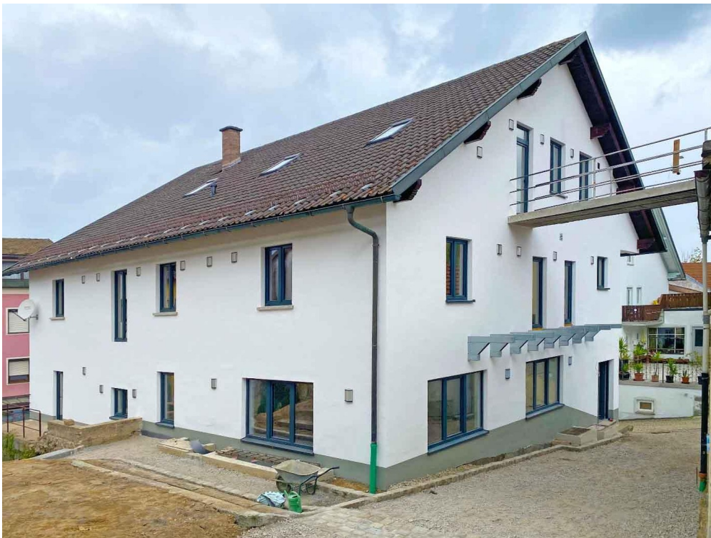
Brücke zur Terrasse