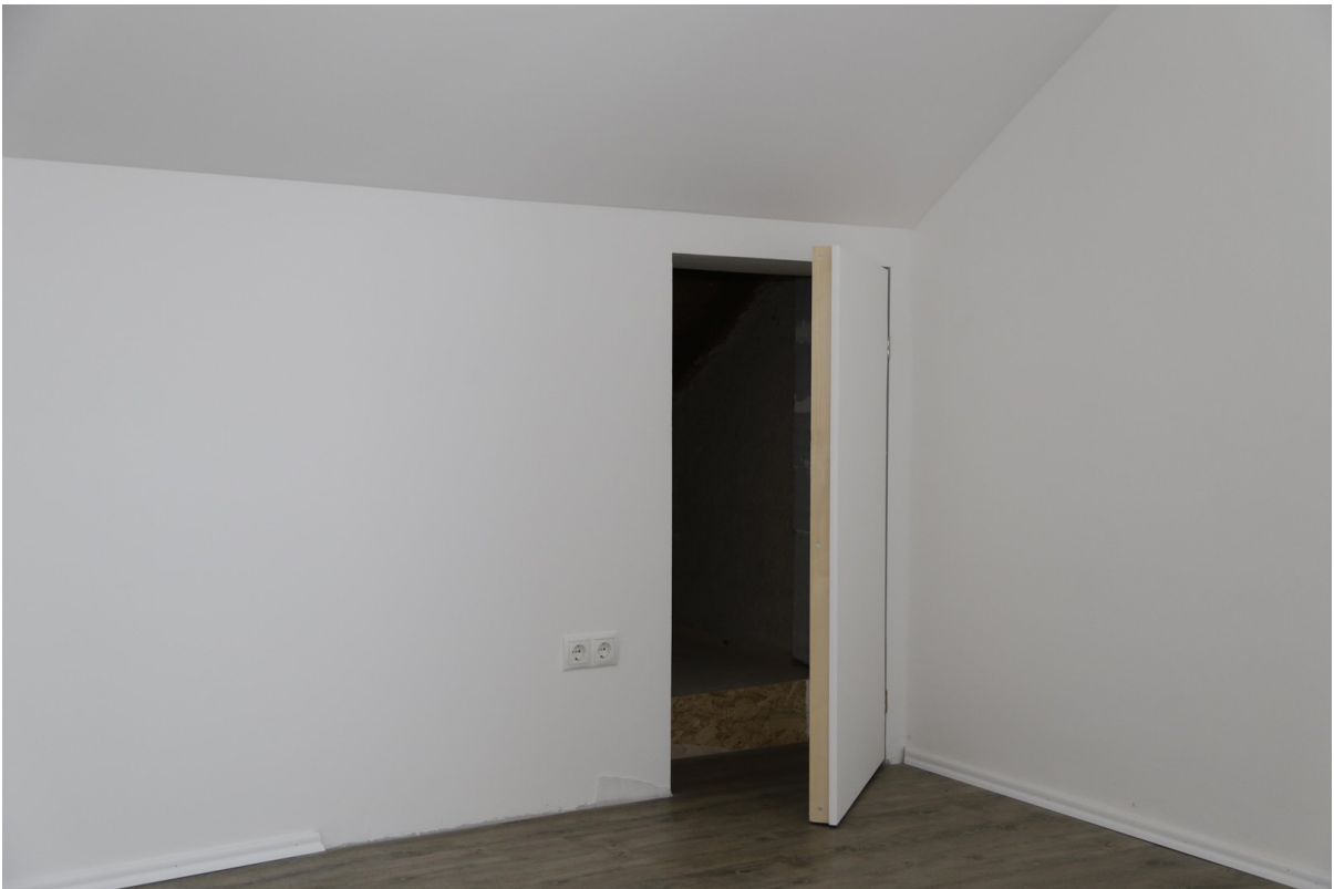
Stauraum im Schlafzimmer