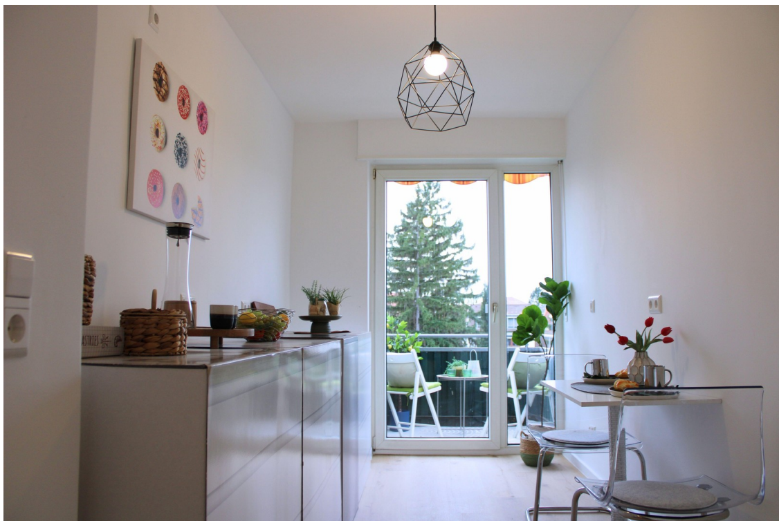
Moderne Küche mit viel Licht