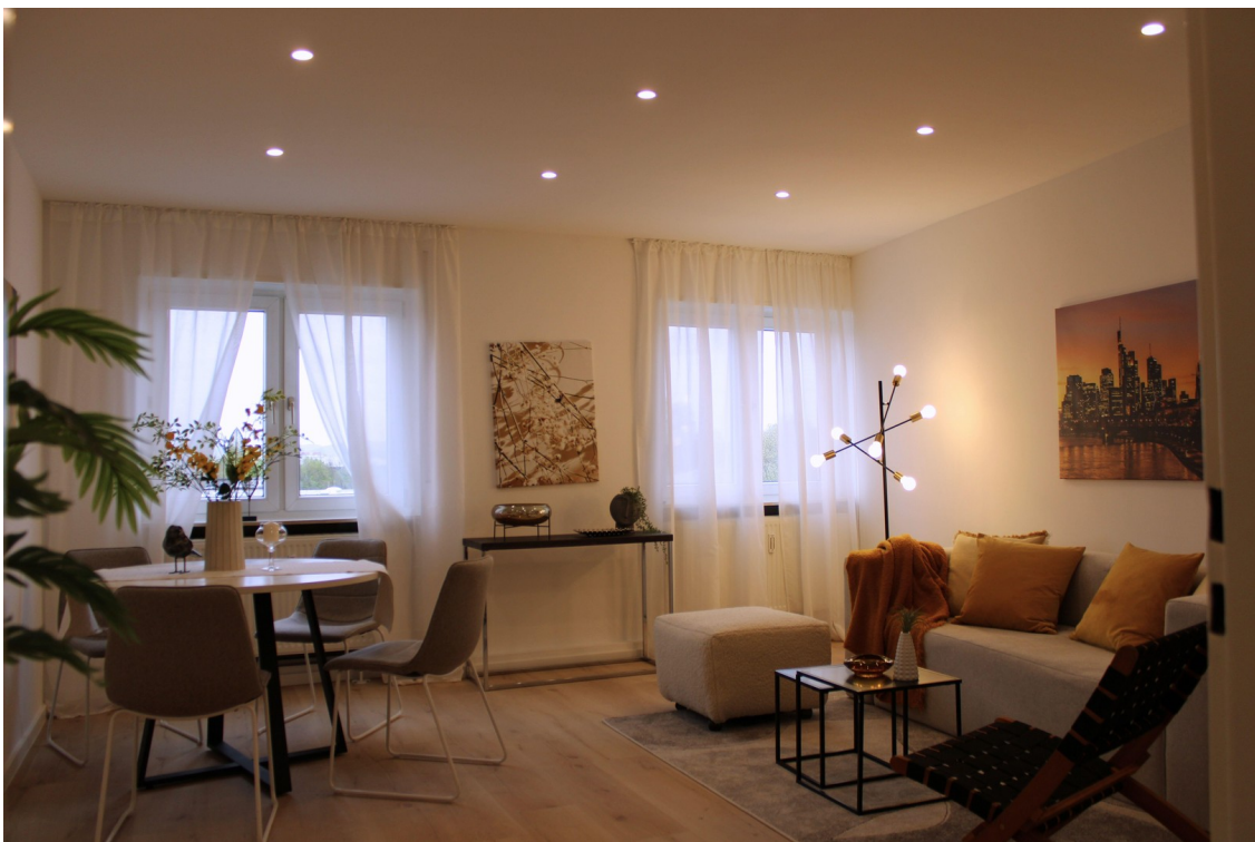
Wohnbereich zum Wohlfühlen