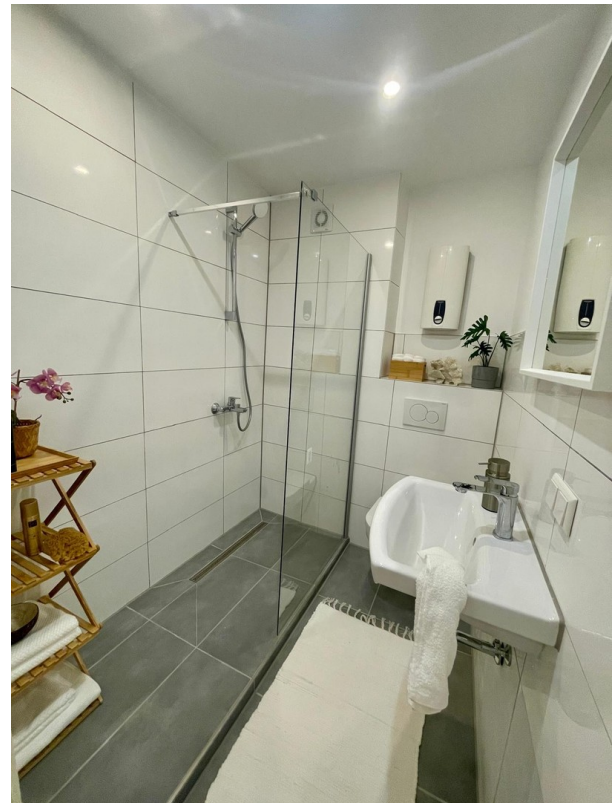
Modernes Bad mit Glasdusche