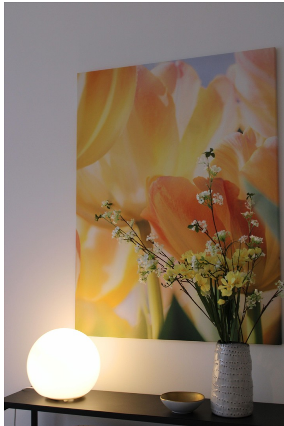
Bild im Schlafzimmer