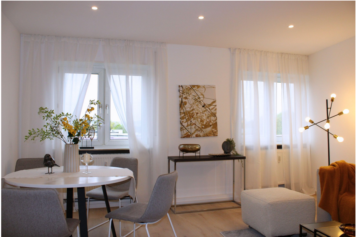
Heller Wohn- und Essbereich