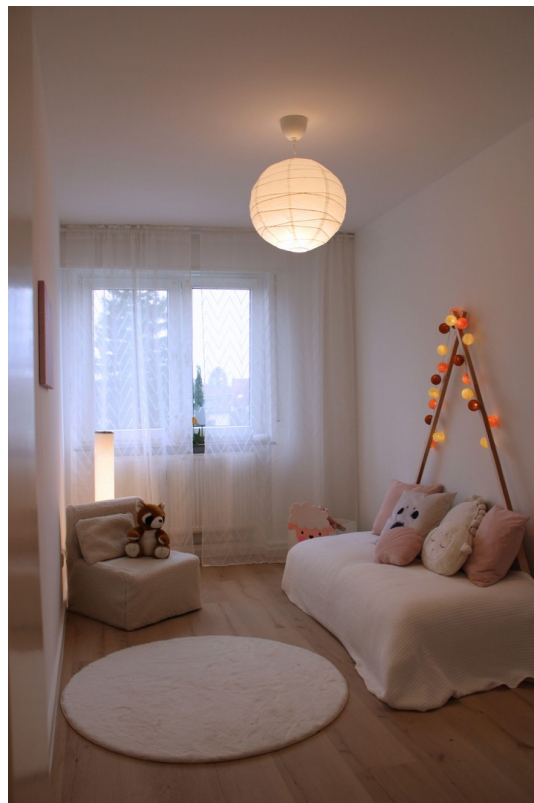
Platz zum Spielen und Träumen