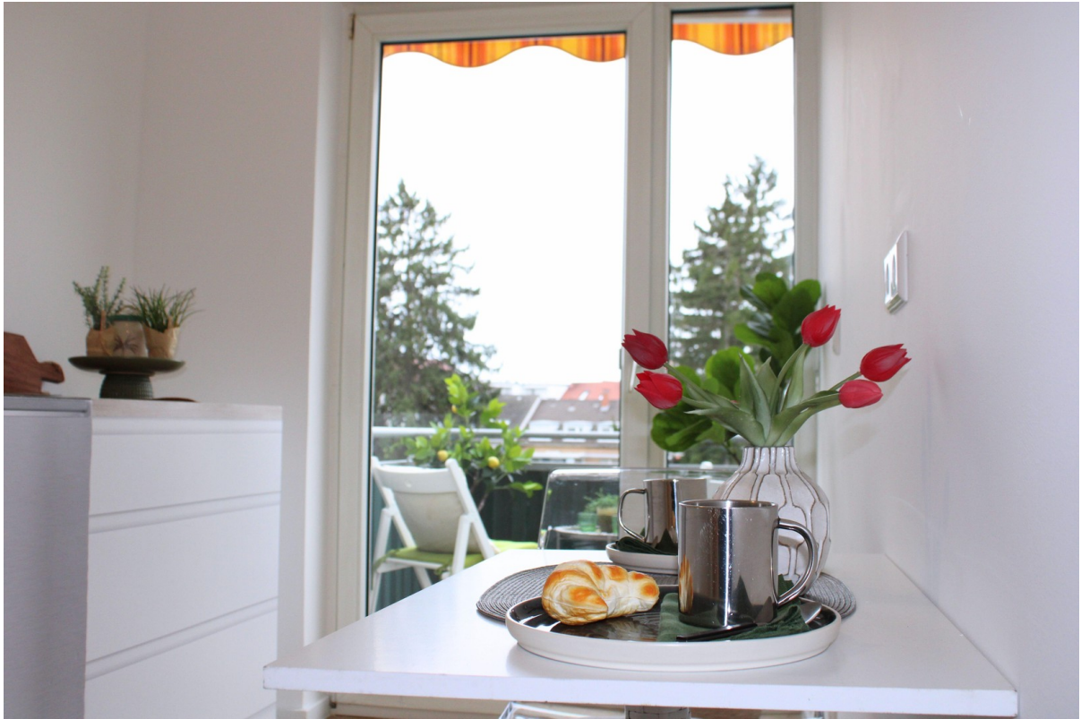
Blick zum Balkon