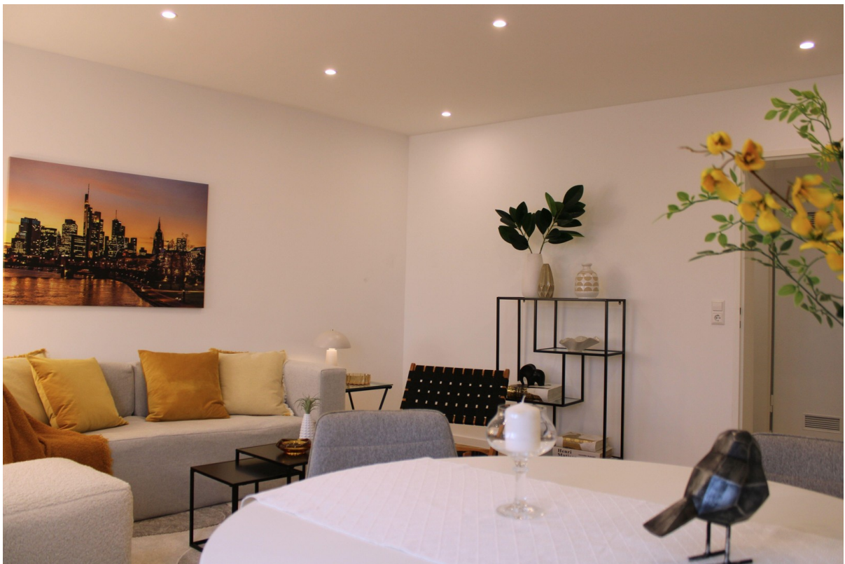
Essplatz mit viel Tageslicht