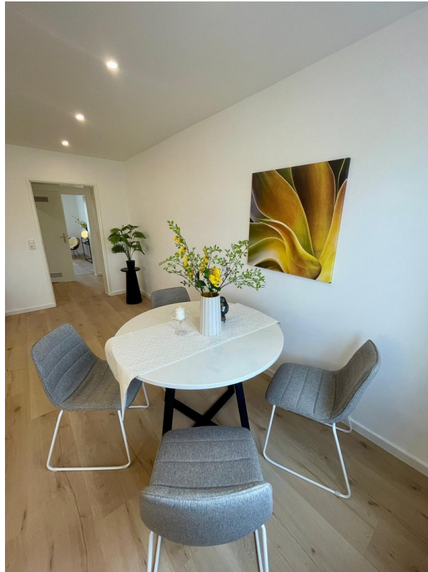
Essplatz mit viel Tageslicht