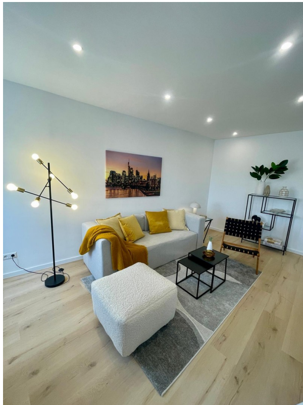
Wohnbereich zum Wohlfühlen