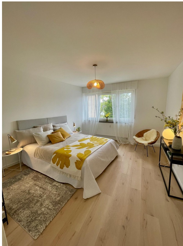
Für erholsame Nächte