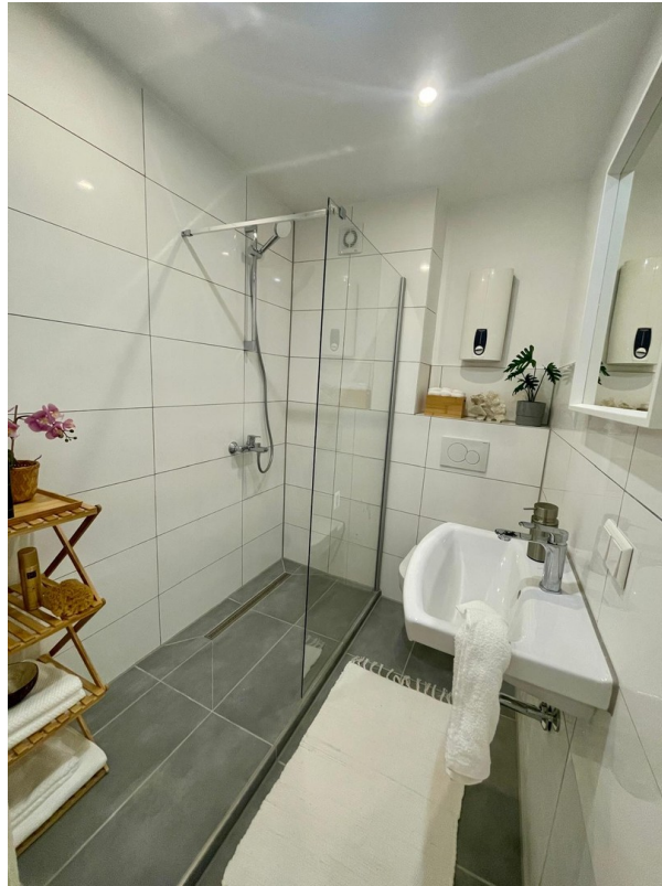
Modernes Bad mit Glasdusche