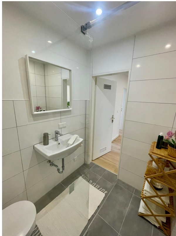
Zeitlos hochwertige Ausstattung