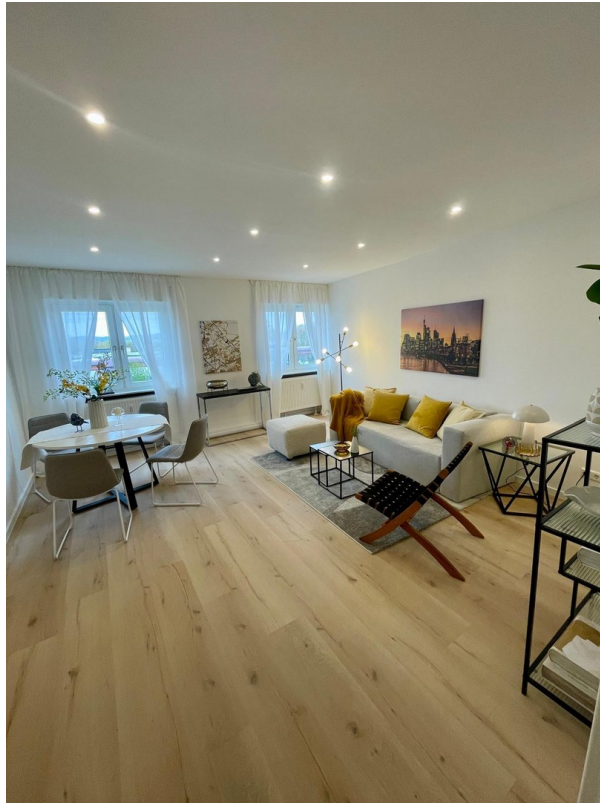
Heller Wohn- und Essbereich