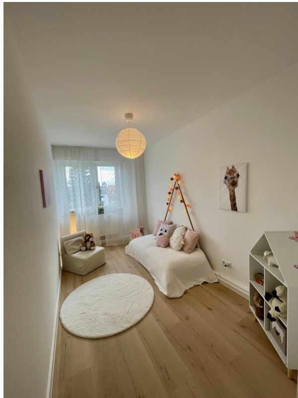
Platz zum Spielen und Träumen