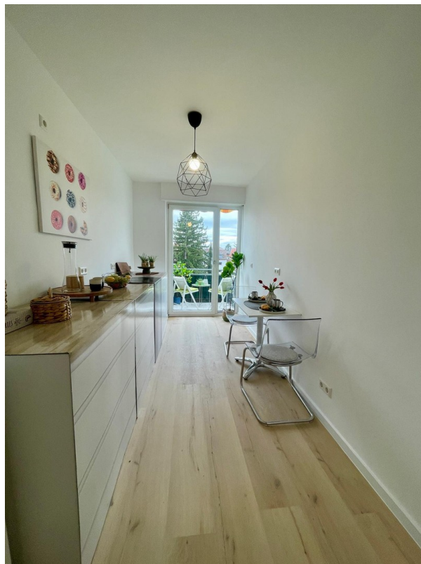
Moderne Küche mit viel Licht