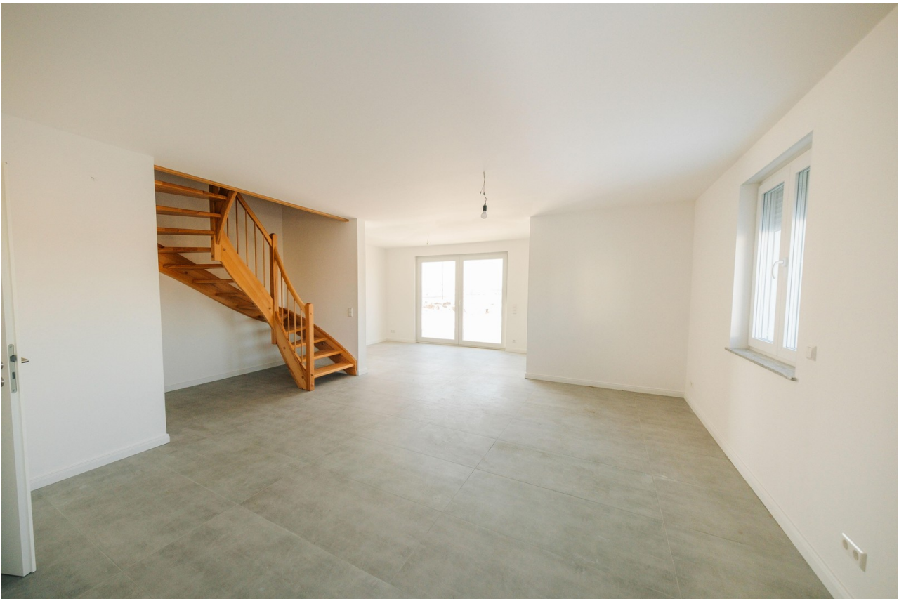
Wohn- und Essbereich/ Küche