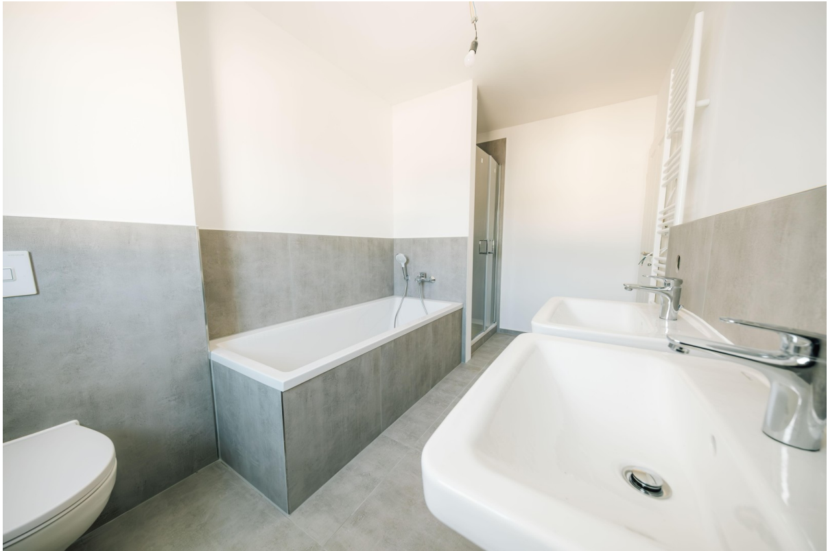
Bad mit Dusche und Wanne