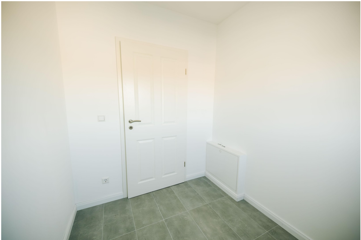
Abstellraum im Obergeschoss