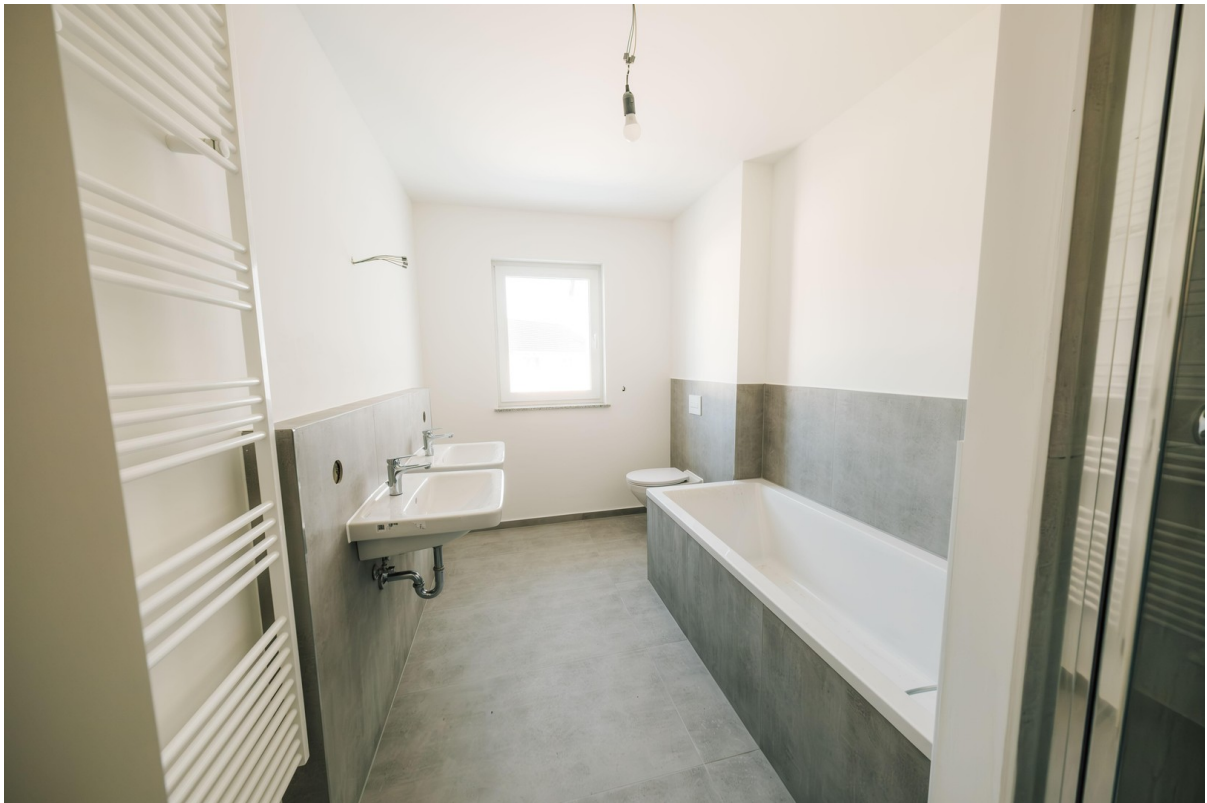
Bad mit Dusche und Wanne