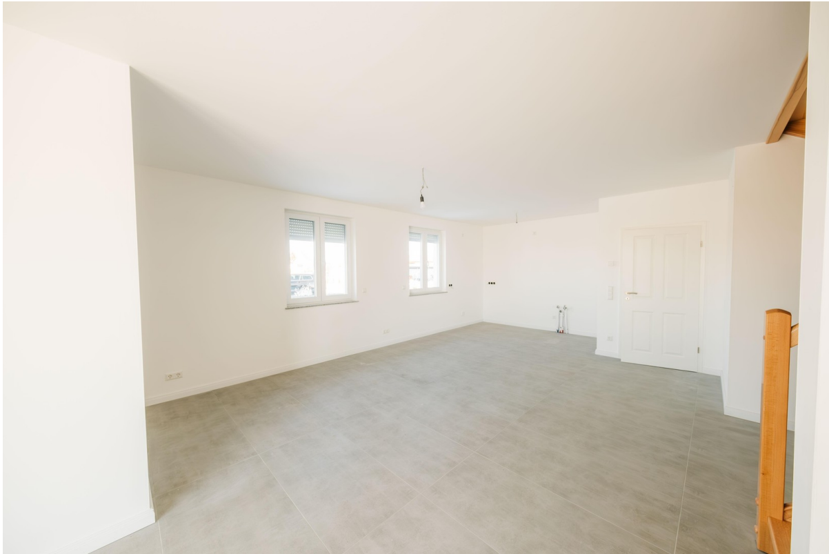
Wohn- und Essbereich/ Küche