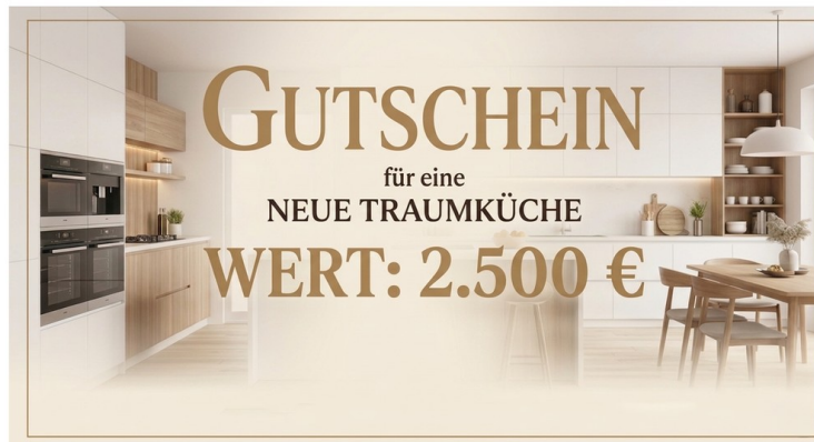
Küchengutschein i.h.v. 2500€